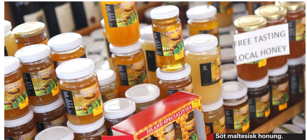
Söt maltesisk honung.

Bay Street Shopping är ett av de bästa shoppingcentren på Malta, det ligger i St Julians vid Inter-Continental Hotel. Det finns också ett mindre shoppingcenter i Sliema Plaza Shopping Centre. ► www.plaza-shopping.com