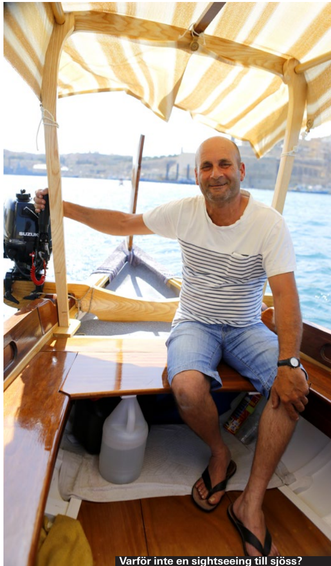
Varför inte en sightseeing till sjöss?

Flera av charterarrangörerna har förstås utflykter på ön i programmet. Kolla med din arrangör. Exempelvis kostar en heldagsutflykt inklusive lunch till Gozo 475 kronor med Solresor, en halvdagstur till Valletta 275 kronor. ► www.solresor.se