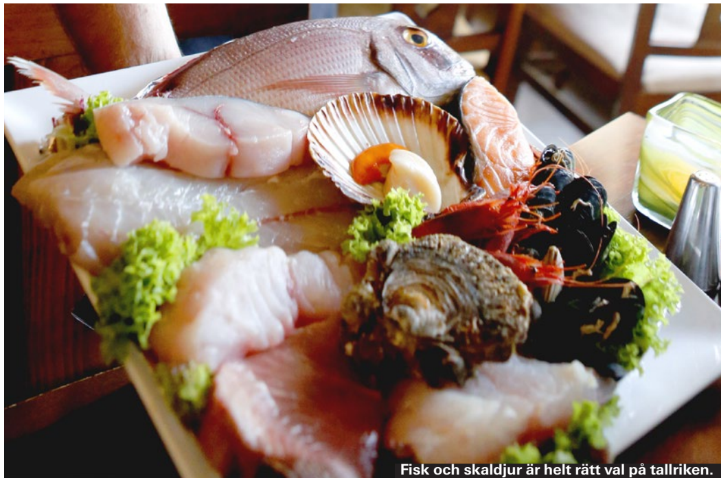
Fisk och skaldjur är helt rätt val på tallriken.

Skaldjur av alla de slag ska man förstås prova när man är på Malta. Hör efter med restaurangen vad som är bäst just den här dagen.