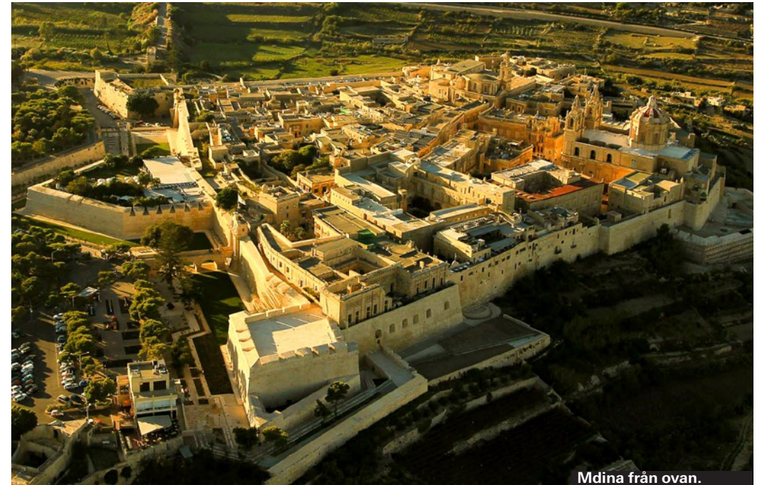
Mdina från ovan.

Maltas tidigare huvudstad Mdina är en av de verkliga upplevelserna på ön. Här ska man vandra runt bland de vackra palatslikande husen som även idag har boenden, även om det känns som att staden är övergiven när man strosar runt i de smala gränderna. Flera bra stopp på rundturen måste du göra, som katedralen och tortyrmuseet Mdina Dungeon. Utsikten från stadsmuren är fin. Precis intill ligger Rabat, där du kan besöka den romerska villan och St Pauls katakomber, gravkamrar som användes fram till 400-talet f.Kr.