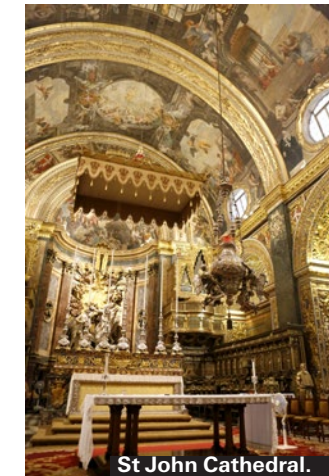
St John Cathedral.

listade världsarven ligger spektakulärt på en höjd med utsikt över Medelhavet. Vibrerande i soldiset ser man också den lilla ön Filfa. Templen är uppförda med solen som riktmärke, vid soluppgång under vissa tider av året lysas exempelvis altaret upp inne i Mnajdra. Civilisationen som uppförde templen dog ut utan att någon förklaring har hittats. Öppet dagligen 8–19.15, något kortare öppet under vinterhalvåret. Biljetter kostar 90 kronor för vuxna och 45 kronor för de små. Glöm ej solhatt och