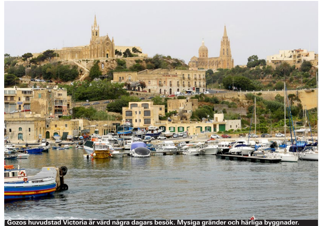
Gozos huvudstad Victoria är värd några dagars besök. Mysiga gränder och härliga byggnader.

Är en höjddare här liksom på många andra håll i Medelhavet. Finns i alla tänkbara och otänkbara sorter. Barnens favorit.