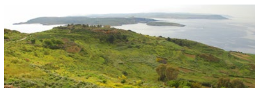
Gozo är ett måste att besöka.

Svenskdriven webbplats om Malta med tips om sevärdheter, information om att flytta till ön och mycket annat. Bloggare som alla är bosatta på ön delar också med sig av tips och erfarenheter