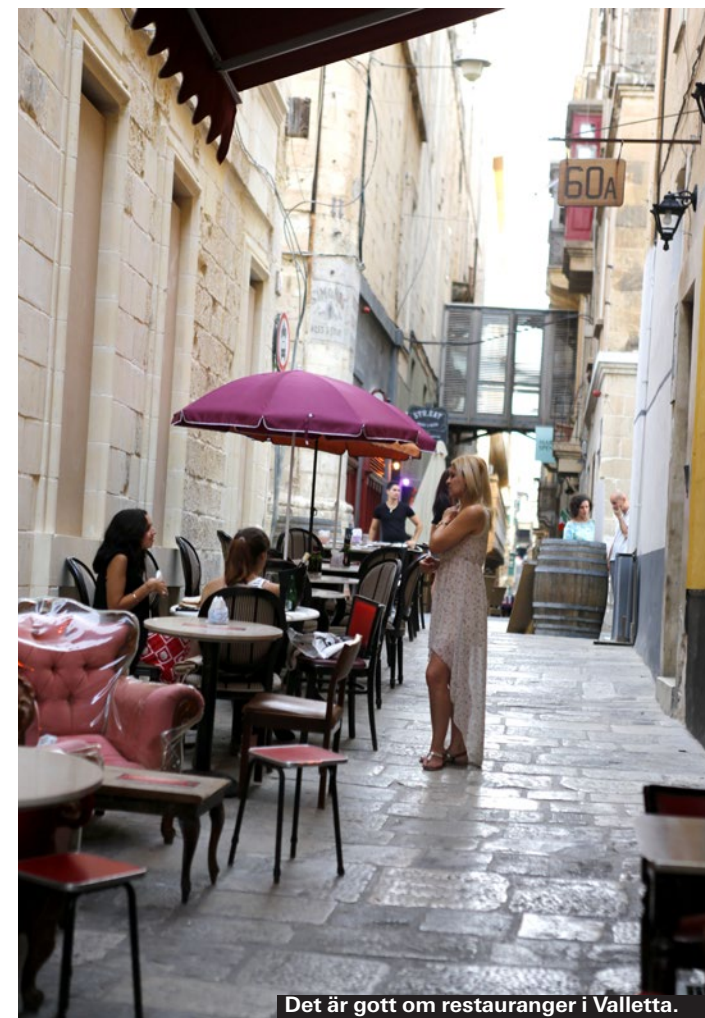
Det är gott om restauranger i Valletta.