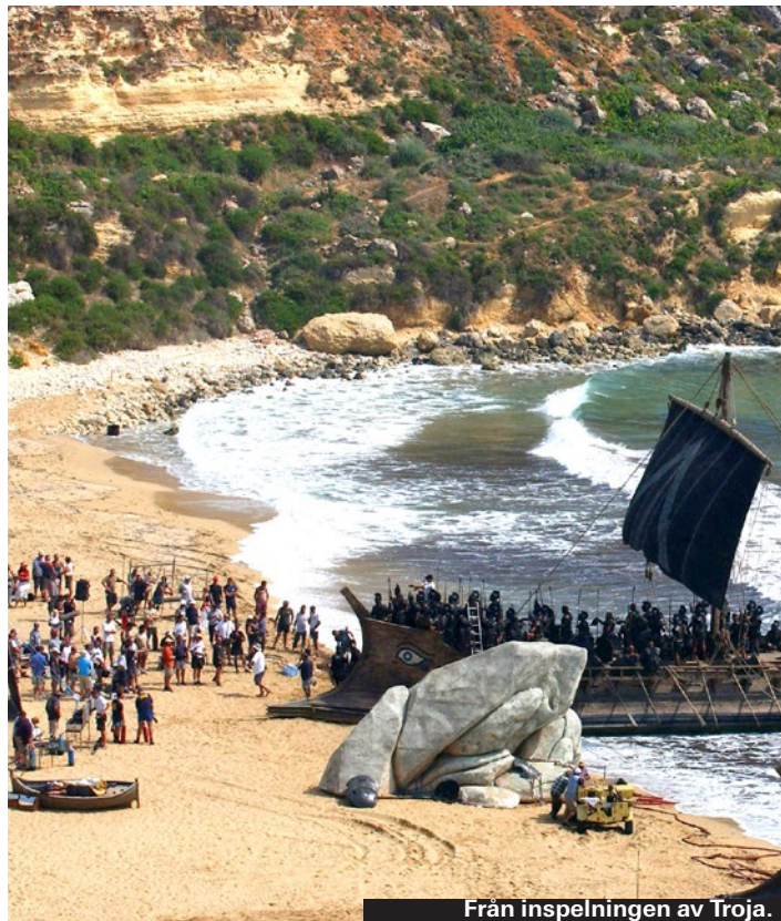
Från inspelningen av Troja.

I huvudstaden Valletta bor endast 6 300 människor, vilket känns som en märklig siffra när man irrar runt i de många grän-