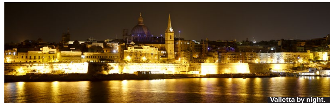
Valletta by night.

Till Malta kan man åka från Sicilien med Virtu Ferries katamaraner. Restiden är cirka 90 minuter mellan Valletta-Pozzallo och 3 timmar Valletta-Catania. Priserna varierar kraftigt beroende på säsong och om man ska göra dagsutflykt eller vara borta flera dagar, se info på webbplatsen. ► 8 Princess Elizabeth Street Ta' Xbiex MSD 11 ► www.virtuferries.com