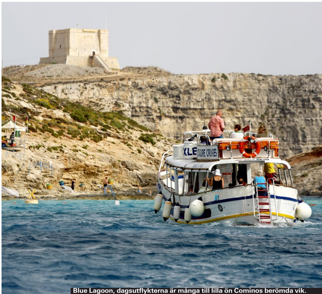
Blue Lagoon, dagsutflykterna är många till lilla ön Cominos berömda vik.

Italienska Sicilien ligger bara en och en halv timme med färja från Malta. Många passar på att göra en dagsutflykt till den vackra ön.