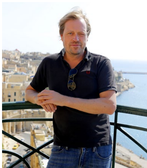
Text & foto: JONAS HENNINGSSON

Lägg till mängder av möjligheter till äventyr, intressant mat som även den speglar ögruppens geografiska plats och historia.