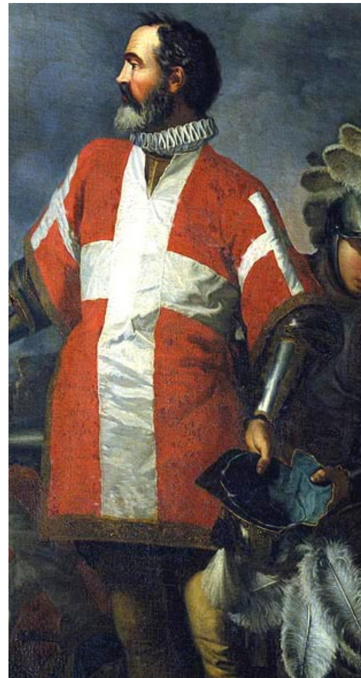
Johanniterordens stormästare Jean Parisot de la Valette, 1494–1568.

Andra världskriget var en hård prövning för malteserna, med 154 dagars oavbrutna bombningar. Malta var britternas viktigaste flottbas i Medelhavet. 1942 fick malteserna kollektivt Georgkorset för sin tapperhet.