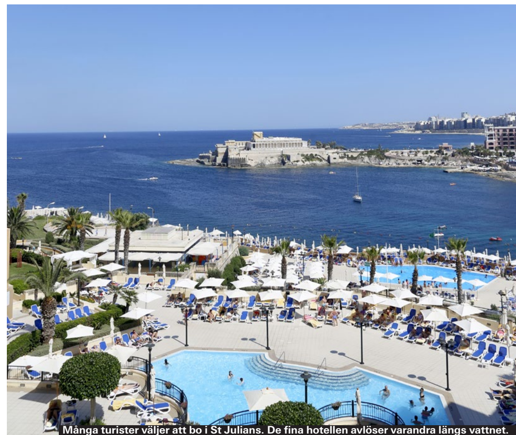
Många turister väljer att bo i St Julians. De fina hotellen avlöser varandra längs vattnet.

Inne i gamla Mdina finns det några få boendeanternativ. Ett trevligt sådant är att hyra Casa Melita, ett gammalt restaurerat hus med egen innergård och takterass som rymmer 4-6 personer. Veckopris varierar mellan 5000 och 7000 kronor beroende på säsong. ▶ Rabat ▶ www.casamelitamalta.iowners.net