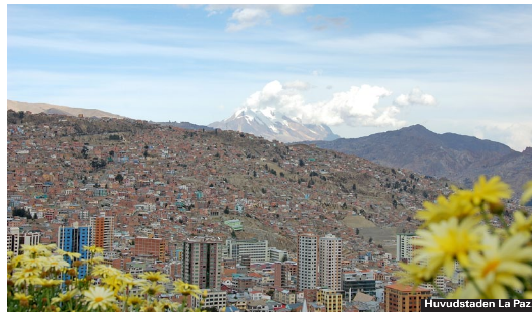
Huvudstaden La Paz.

Vattensvinet är egentligen en jättestor råtta, världens största gnagare. De ser söta men lite enfaldiga ut. Du ser dem i Amazonas, där de lever och betar längs med floderna.