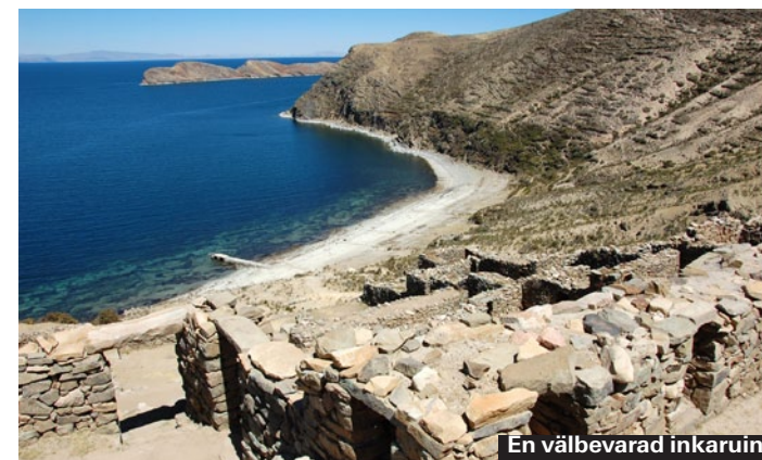
En välbevarad inkaruin.

arna är dammiga vilket gör det bitvis svårt att andas. (Ta med en näsduk att täcka näsa och mun med.) Man bör också vara beredd på att det sprängs med dynamit, vilket kan orsaka smällar och vibrationer. Dessutom måste man krypa vissa sträckor, vilket kan ge problem om man har klaustrofobi. Seriösa arrangörerna har dock två guider för varje grupp, så att den som känner obehag kan vända tillbaka när som helst under turen.