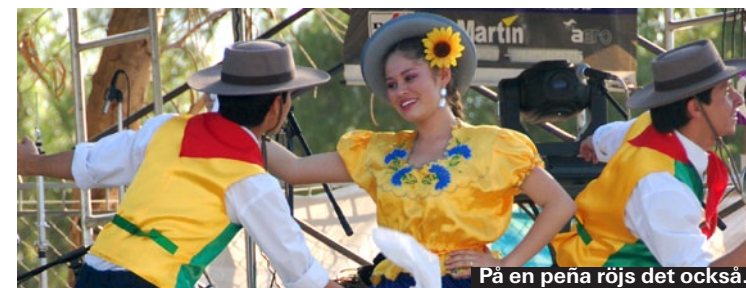
På en peña röjs det också.