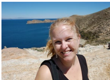
Text & foto: LISA BJERRE

Är man dessutom intresserad av vandring eller äventyrssporter som klättring och mountainbike, då är ett besök i Bolivia ett måste. Frågan är egentligen inte om du ska åka – utan hur länge.