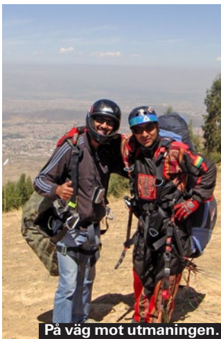
På väg mot utmaningen.

Priset är omkring 700 kronor om man gör den på tre dagar: första dagen tränar man isklättring på en glaciär, andra dagen går man upp till det högsta lägret på berget, och påföljande natt går man upp till toppen (drygt 900