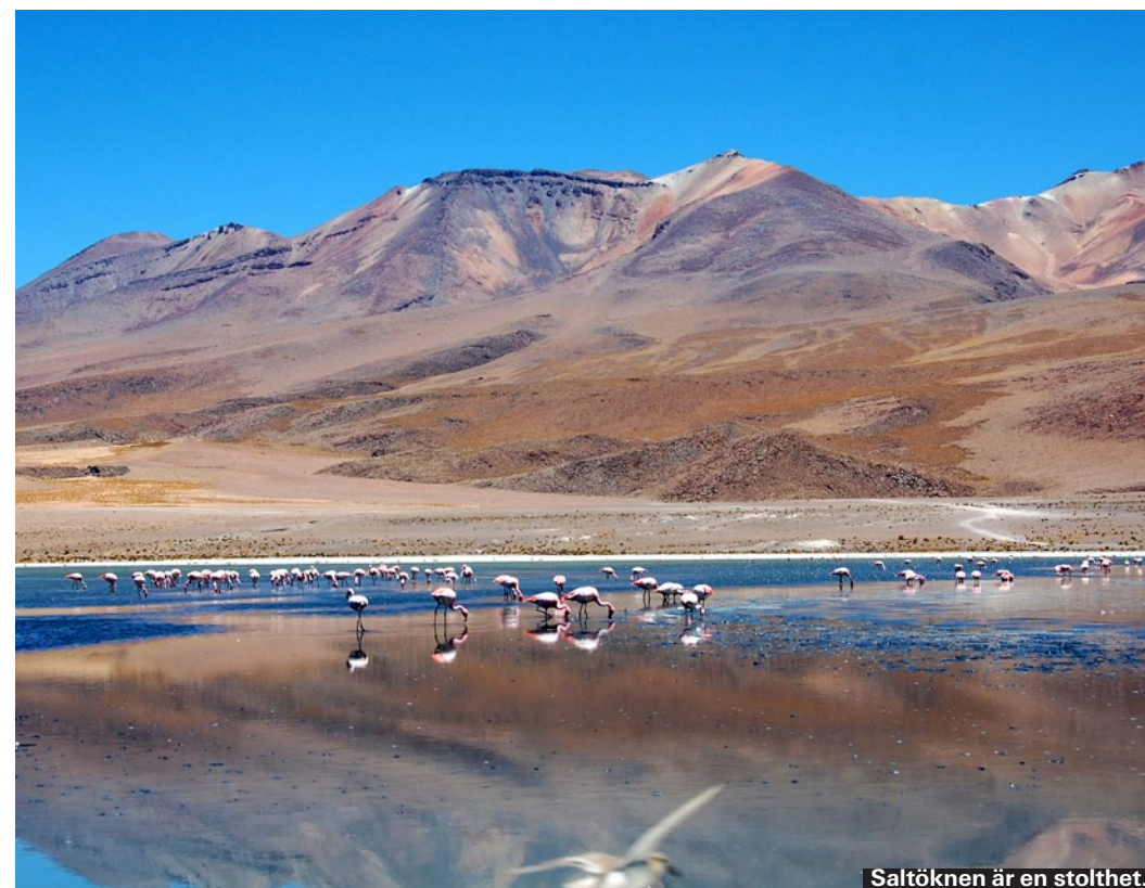
Saltöknen är en stolthet.

Efter självständigheten förlorade Bolivia flera krig mot sina grannländer. Detta resulterade i att man tappade hälften av sin landyta – inklusive den enda kuststräckan.