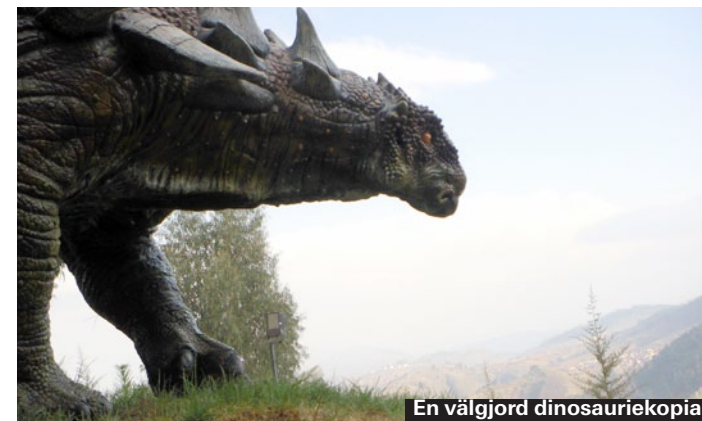
En väljord dinosauriekopia.