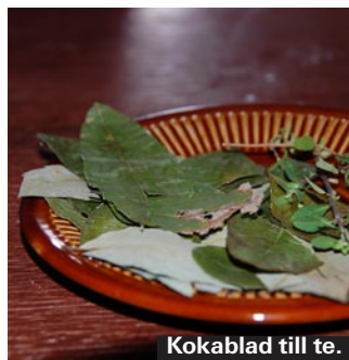
Kokablad till te.

Kokablad har blivit världskända genom att man tillverkar drogen kokain av dem – men i Bolivia är de en gammal, traditionell specialitet som används på en rad andra sätt. Bland annat lägger man kokablad i varmt vatten för att göra "mate de coca", alltså te gjort på kokablad. Denna dryck sägs bland annat vara bra för att bota höjdsjuka. Smaken är ganska speciell och påminner om gräs.