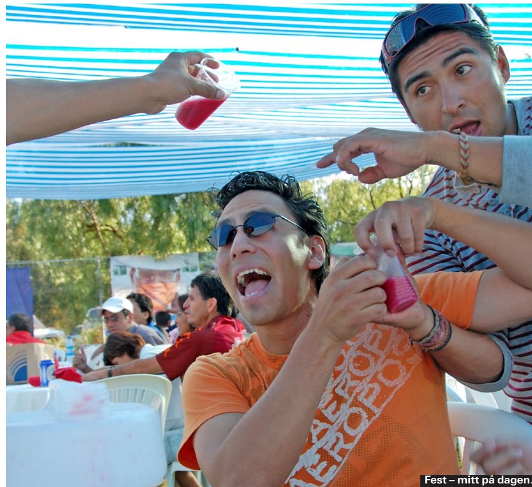
Fest – mitt på dagen.

stad, sägs det – tack vare de rika mineralfynden. I dag finns det så lite metall kvar att inget företag tycker det är värt att satsa på. Därför är det bara "frilansande" arbetare som jobbar i gruvan, med omoderna verktyg. Miljön är väldigt dammig, säkerhetsutrustningen obefintlig och det sägs att många av dem som jobbar i gruvan inte lever längre än till 45. För turister är gruvorna ett populärt utflyktsmål. Flera turistföretag i Potosí gör dagligen utflykter, och uppmanar turister att ta med kokabladd, läsk och dynamit som gåvor till arbetarna. Att besöka gruvorna är ganska tufft. Gång-