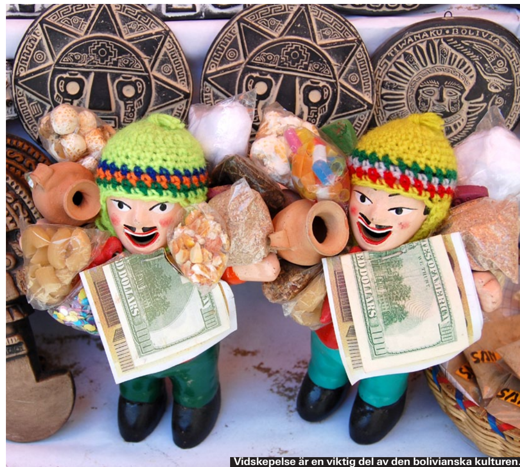
Vidskepelse är en viktig del av den bolivianska kulturen.

Den karga ön Isla del Sol ligger mitt i sjön Titicaca, och är en både vacker och helig plats. Här har modergudinnan Pachamama dyrkats i tusentals år. Enligt legenden var det från Titicacasjön som skaparguden Viracoca kom – det var här som livet började. Dagens Isla del Sol är fattigt och lite slitet. Befolkningen är bitvis riktigt surmulen och många verkar trötta på turister. Trots detta är ön och Titicaca väl värt ett besök. Naturen är slående vacker och det finns en lagom lång vandringsled som löper tvärs över ön. Räkna med att den tar två till fem timmar att gå, och ytterligare en timme ner till närmaste hamn. Därifrån kan man antingen ta båten tillbaka till södra delen av ön, eller återvända till fastlandet (Copacabana). När du planerar vandringen, glöm inte att Titicacasjön ligger på 4 000 m höjd. Du kommer därför att bli betydligt mer andfädd än vad du blir hemma, och det är ganska backigt. Det finns ett flertal hotell och vandrarhem på Isla del Sol, många av dem med vidunderlig utsikt. Räkna dock inte med att ha el (och därmed varmvatten) – strömmen verkar gå ganska ofta på ön.