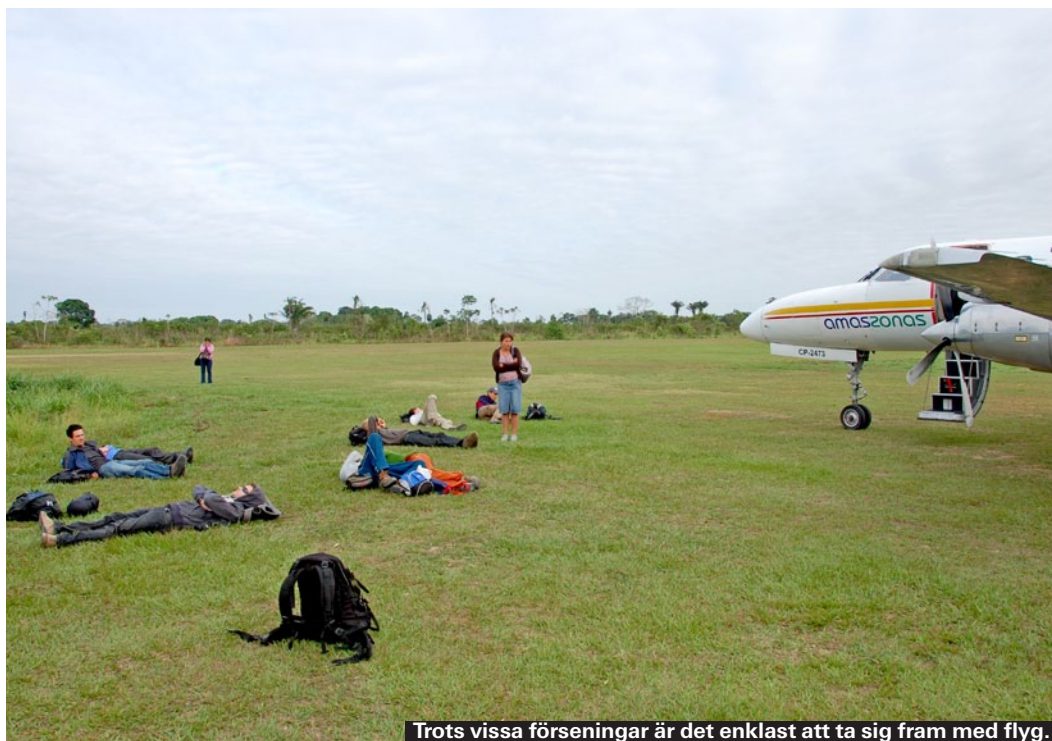
Trots vissa förseningar är det enklast att ta sig fram med flyg.