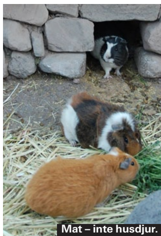
Mät – inte husdjur.

Marsvin är en delikatess i Anderna. På landet bor ofta marsvinen i hemmet eller på tomten, men de är föda – inte husdjur. En del turistrestauranger serverar marsvin, så att besökare ska kunna smaka på denna sydamerikanska specialitet.