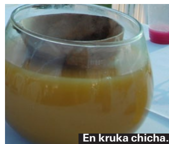
En kruka chicha.