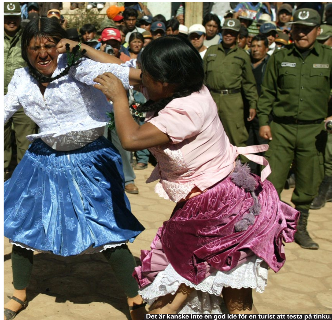
Det är kanske inte en god idé för en turist att testa på tinku.

Colectivos är delade taxis och minibussar som kör längs för- utbestämda ruttor. Det är alltså ungefär samma sak som att åka buss, fast snabbare och smidig- are. Lär du dig vilken sträcka som går hem till ditt hotell, så är det ett prisvärt sätt att ta sig fram – att åka inom en stad kos- tar 1-1,50 kronor.