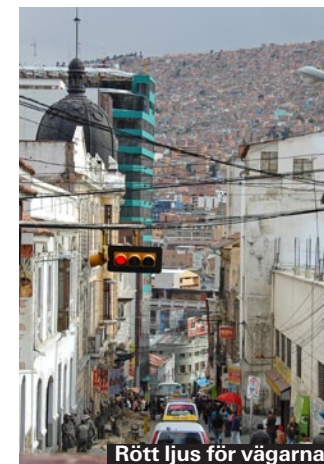
Rött ljus för vägarna.

Bolivia har närmare 40 officiella språk, varav majoriteten är olika ursprungsspråk. De vanligaste är spanska, quechua och aymara. Engelskkunskaperna är det däremot sämre med. Inom turistnäringen kan många lite engelska, men i övrigt räcker det