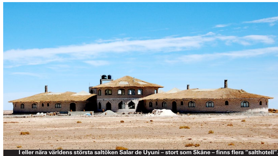
I eller nära världens största saltöknerna Salar de Uyuni – stort som Skåne – finns flera "salthotell".