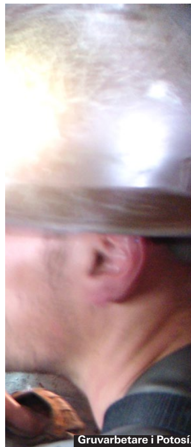
Gruvarbetare i Potosí.

Singani är en stark alkoholhaltig dryck (40 procent) som görs av druvor. Blandar man Singani med Sprite eller färskpressad lime får man den populära drinken "chufalay". Det säljs betydligt mer singani än vad det säljs bolivianskt vin i Bolivia.