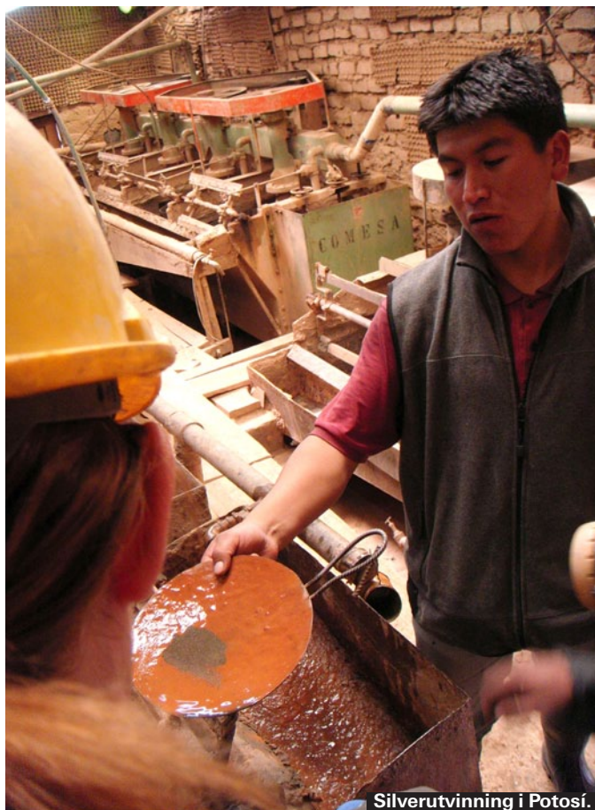
Silverutvinning i Potosí.