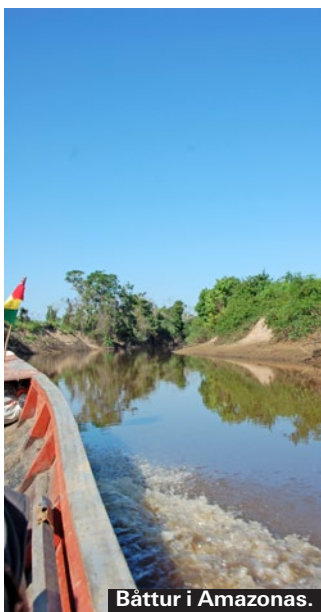
Båttur i Amazonas.

De norra delarna av Bolivia ligger i den exotiska Amazonas-regionen. Här hittar vi regnskog, ursprungsfolk, vilda djur och medicinalväxter. Ett besök i djungeln är ofta mer inriktat på ursprungsfolkens kultur och växter än på djur – djungelns djur är skygga och svåra att se i den täta vegetationen. Städerna Rurrenabaque, Trinidad och Villa Tunari är populära basstationer för den som vill ge sig ut på en djungeltur. Priset för att åka ut i djungeln i ett par dagar varierar kraftigt – de organisationer som drivs av ursprungsfolk tenderar att ta mer betalt och hålla högre kvalitet. De dyraste ligger kring 600 kronor per person och dag, medan vanliga kommersiella företag kan organisera djungelutfläkter för 130-150 kronor per dag.