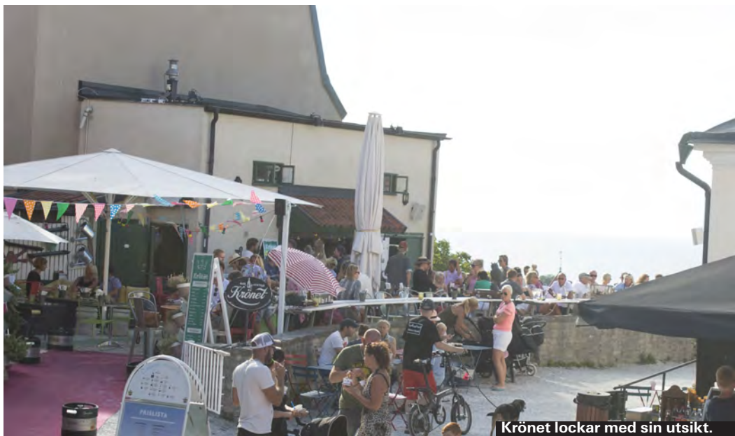
Krönet lockar med sin utsikt.

► St Hansgatan 51 ► www.blacksheeparms.se