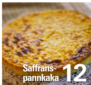
Saffrans- pannkaka 12