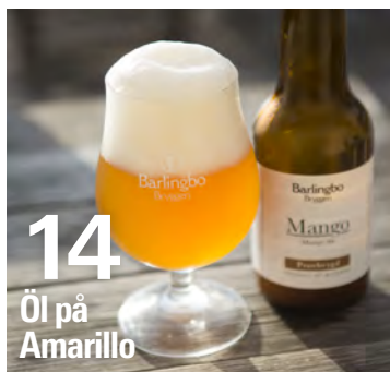
14 Öl på Amarillo