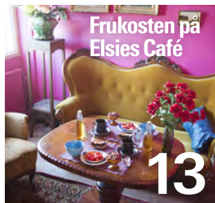
Frukosten på Elsies Café