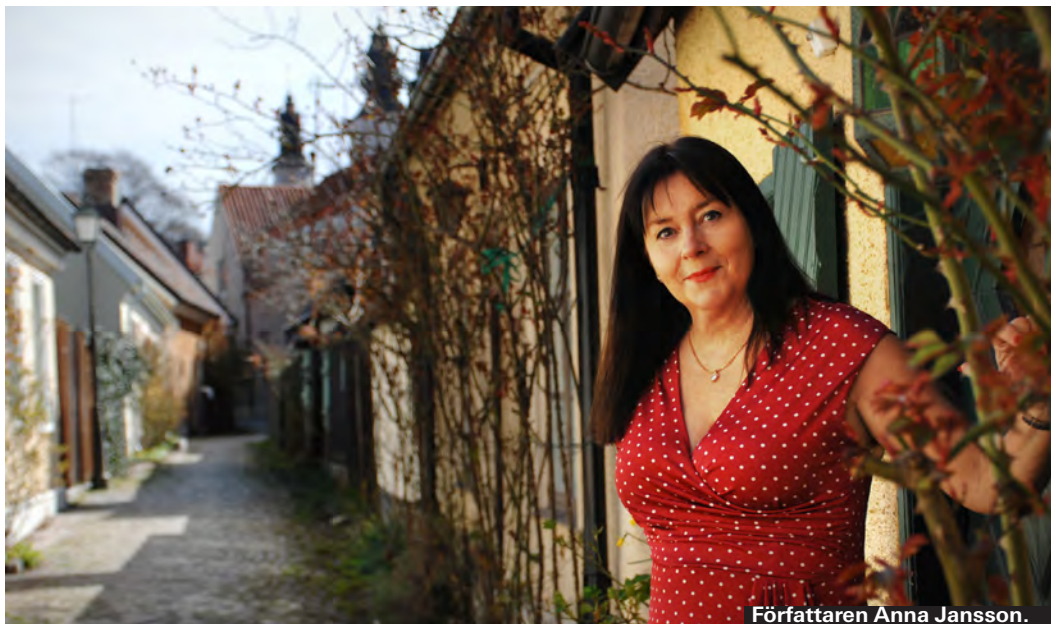
Författaren Anna Jansson.

Anna Jansson, deckarförfattare som i böckerna om Maria Wern verkligen satt Gotland på den litterära kartan, tipsar om sina favoriter. Anna Jansson bor i Visby.