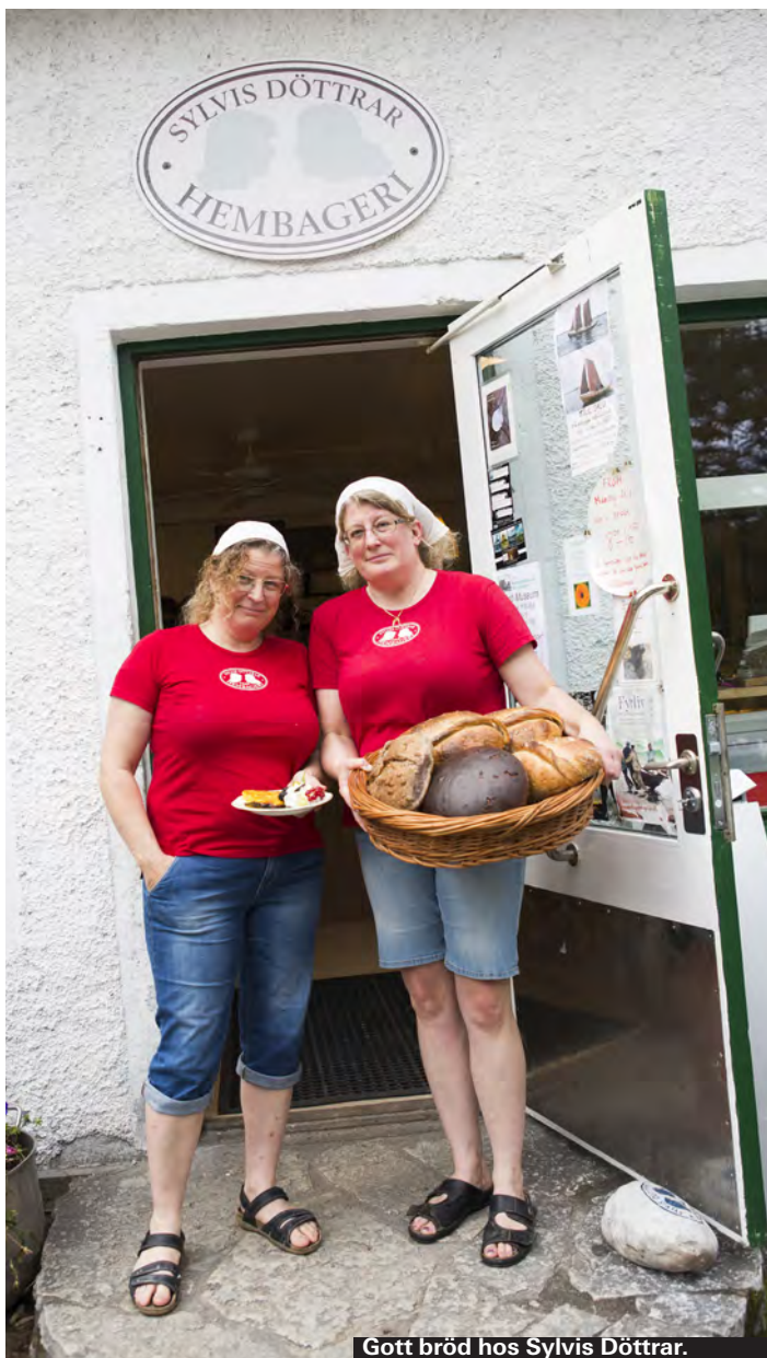
Gott bröd hos Sylvis Döttrar.

► Sjalsö Sjalsövägen 10, Visby ► www.sjalsobageri.se