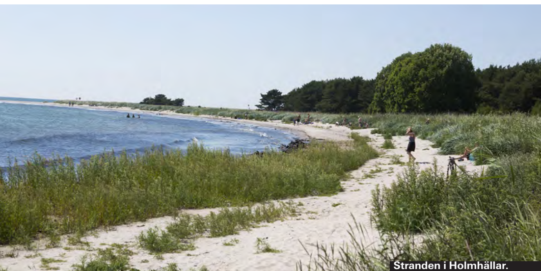
Stranden i Holmhällar.

6 Sudersand Fårös strandpärla Sudersand är lätt att förälska sig i. Fin sand, härligt bad och alltid sol (faktiskt). Sudersand är en lång (fem kilometer) sommardröm. Åker du hit från Gotland gäller det att dra tidigt så du slipper köerna på Fåröfärjan. Bäst är att stanna några nätter på Fårö och se mer när du ändå tagit dig hit upp.