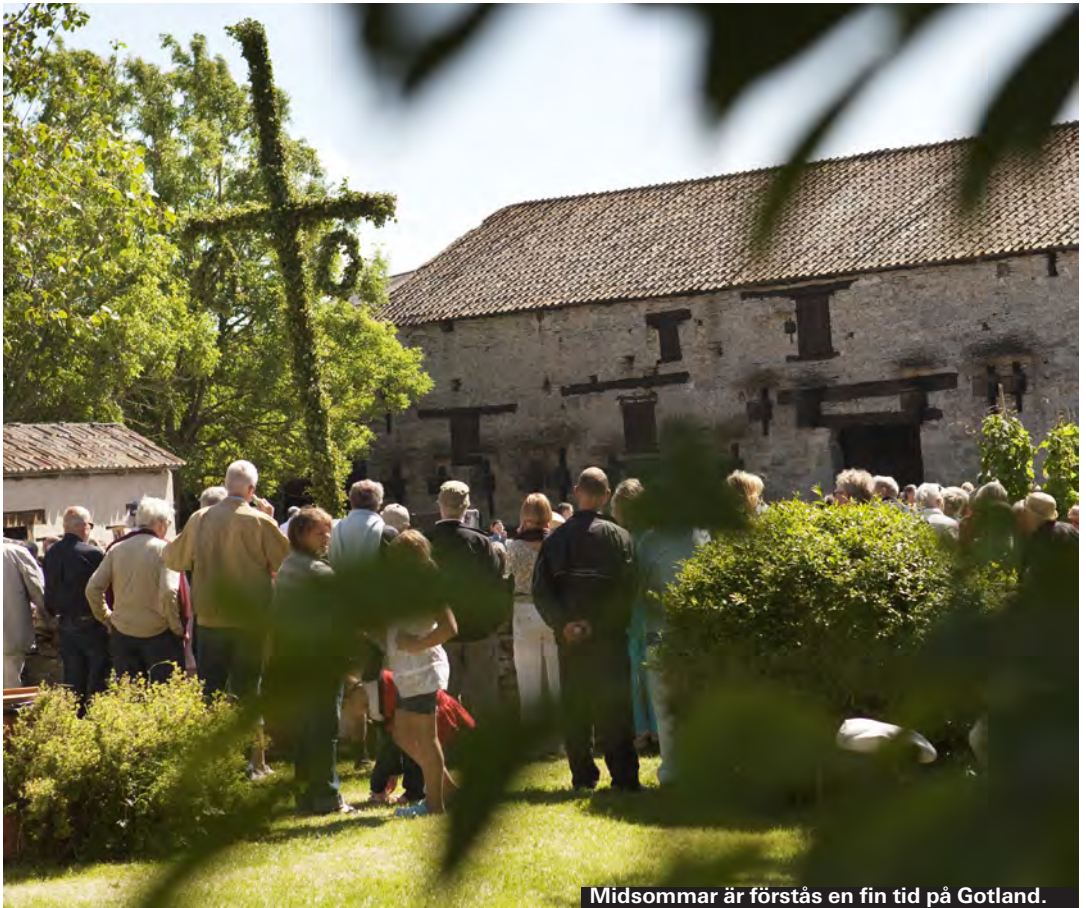
Midsommar är förstås en fin tid på Gotland.

De stora högtidshelgerna är förstås populära att besöka ön. Framförallt veckorna innan jul är fina i Visby med marknader och pyntning. Påsk är veckan då ön vaknar upp efter vintervilan och gör sig redo för att ta emot fler besökare igen. Många öppnar sina verksamheter runt påsk.