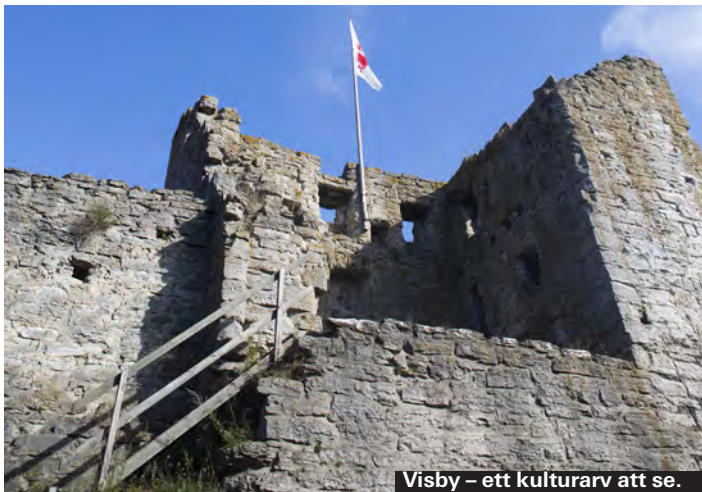
Visby – ett kulturarv att se.

I Fornsalen kan du bland se världens största silverskatt från