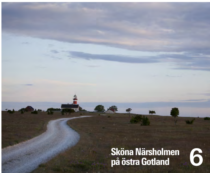
Sköna Närsholmen på östra Gotland 6