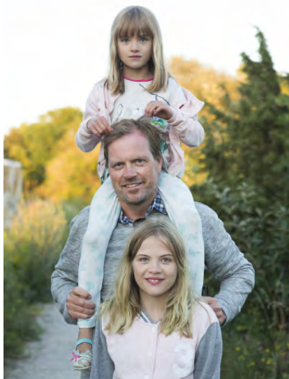
Text & foto: JONAS HENNINGSSON

Det finns verkligen ett Gotland för alla. Ön är väldigt olika beroende på vilken del man utforskar. Somliga dras med i Visbys hektiska sommartempo. Andra lockas av Sudrets majestätiska natur, en del längtar till östkustens många långsträckta stränder. Några kan inte vänta på att få dra norrut och hoppa på den lilla färjan till Fårö för den lilla utpostens lockelser.