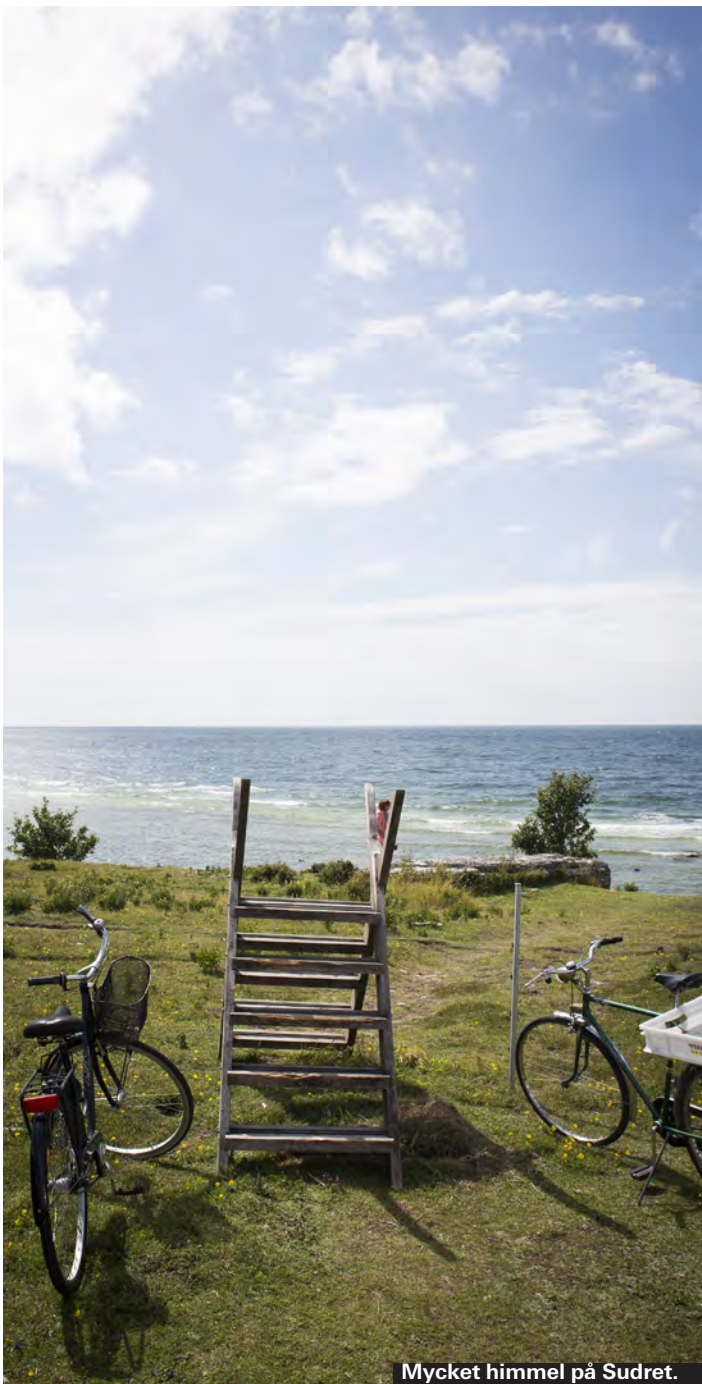
Mycket himmel på Sudret.

Norra delen av ön har de senaste åren blivit allt trendigare. Furillen och Bungenäs sätter tonen och lockar även internationella resenärer hit. Men även för den som inte sukter efter trendspaningar finns finfina upptäckter häruppe. Kyllaj och Stenkusten är några favoriter, men du kommer att hitta dina egna, var så säker.