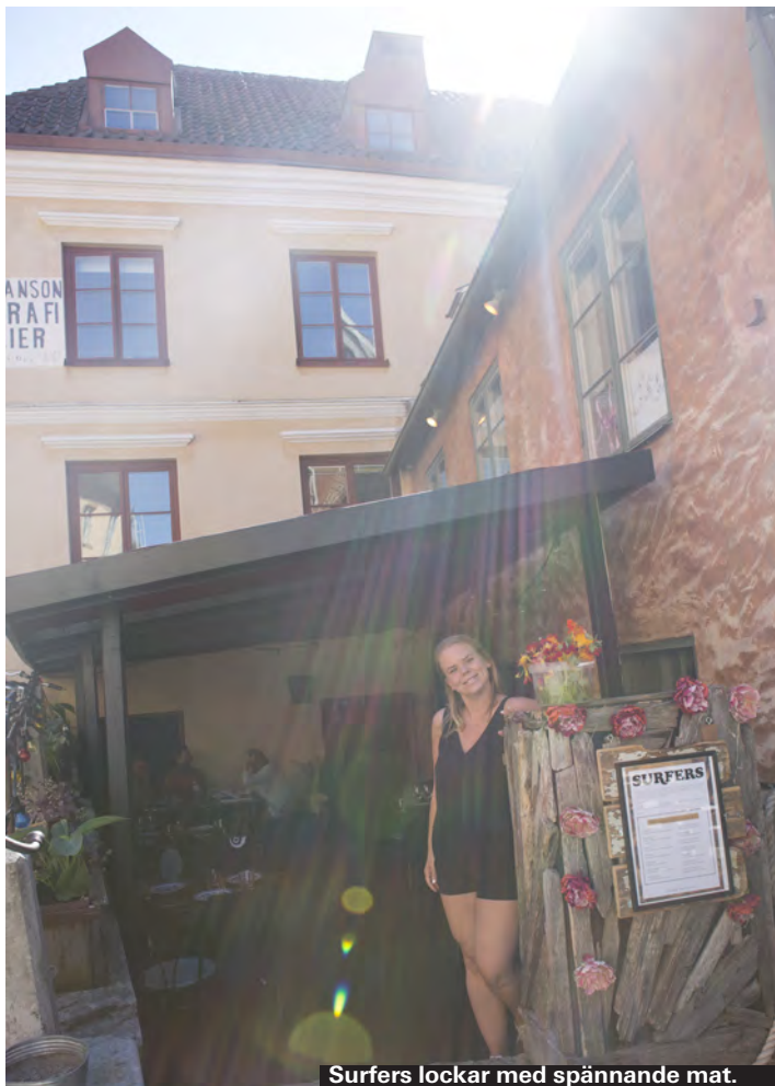
Surfers lockar med spännande mat.

Marcus Samuelssons Manhattan-doftande fun dining-koncept Kitchen & Table på Clarion Hotel har gett