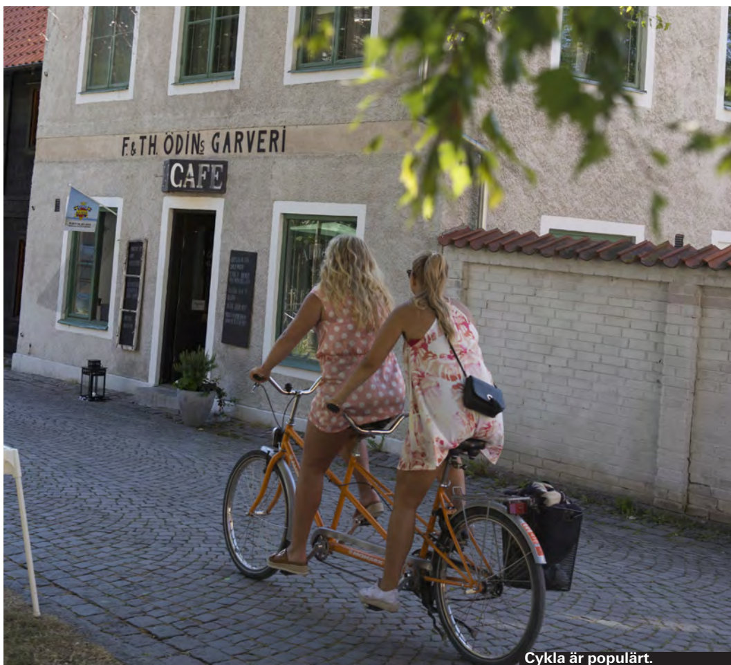
Cykla är populärt.

Många har med sig bilen över på färjan och det är förstäeligt. Ön är stor och vacker och sevärheterna ligger utspridda. För att nå öns bästa och finaste delar är bil ett smidigt transportmedel. Men med det sagt är det klokt att försöka uppleva så mycket av ön som möjligt utanför bilen.