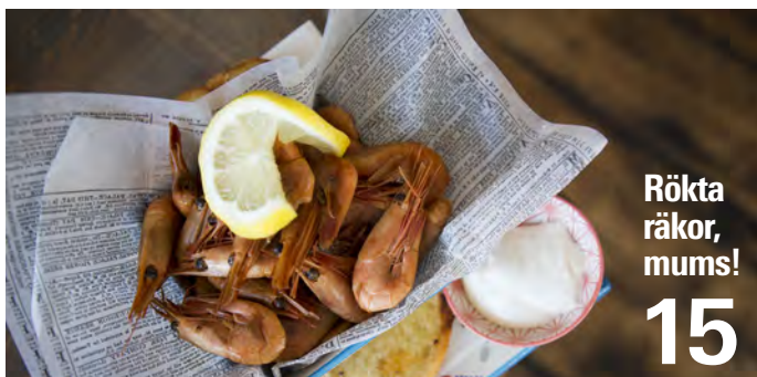
Rökta räkor, mums! 15