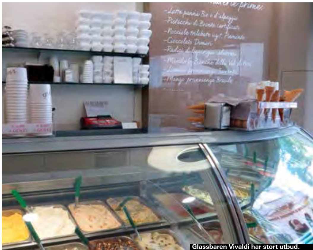
Glassbaren Vivaldi har stort utbud.