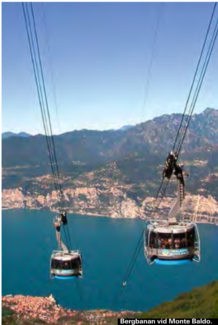
Bergbanan vid Monte Baldo.

Lombardiets största skogsområde är 11 000 hektar. Här, mellan sjö och berg blandas det bästa av Gardasjön och inlandet. Parken sträcker sig