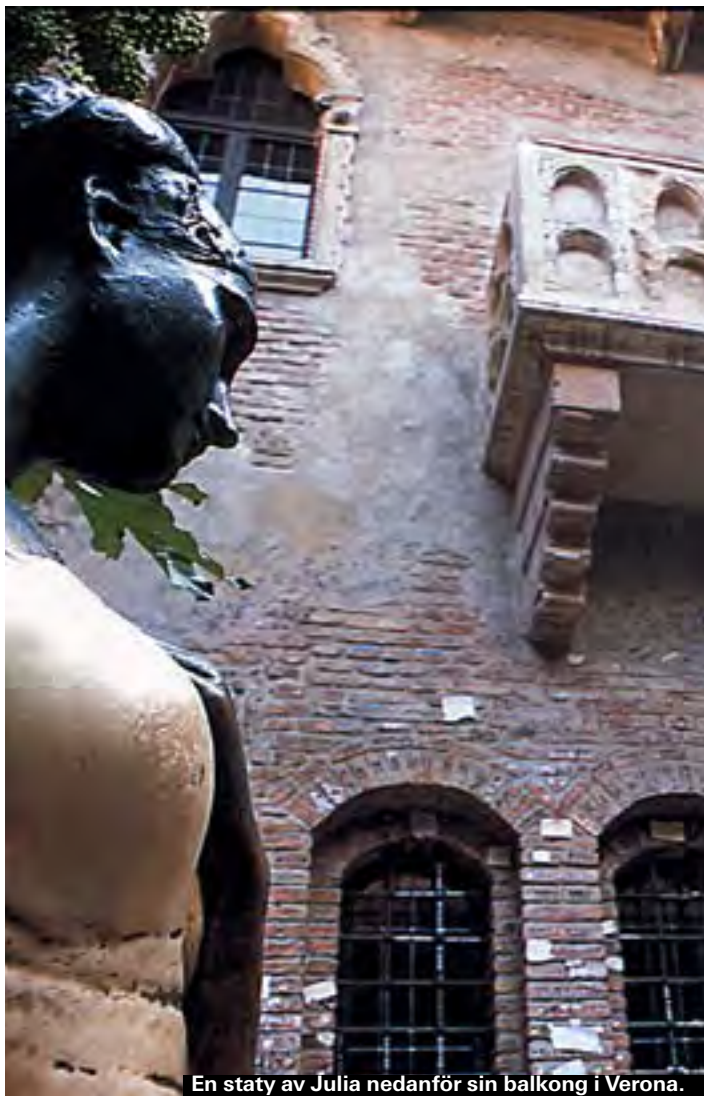
En staty av Julia nedanför sin balkong i Verona.

Charmiga Cremona kallas ofta för musikstaden. Redan på medeltiden var stadens katedral en plats för konserter och i dag har staden några av Italiens