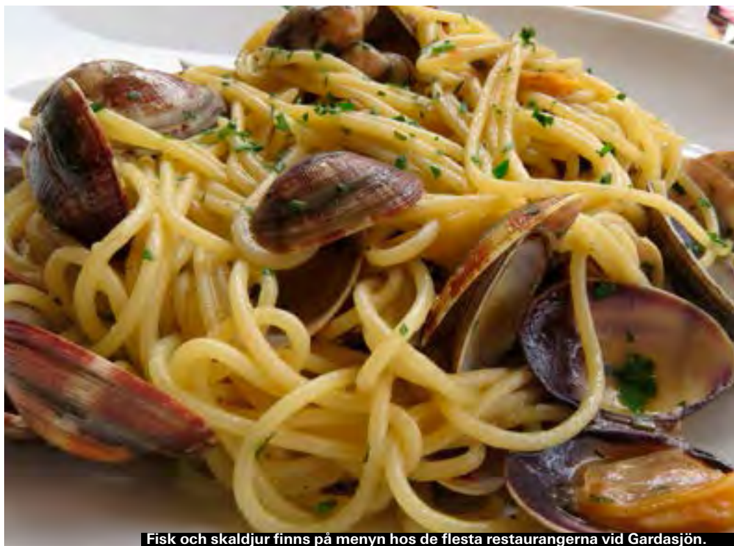
Fisk och skaldjur finns på menyn hos de flesta restaurangerna vid Gardasjön.