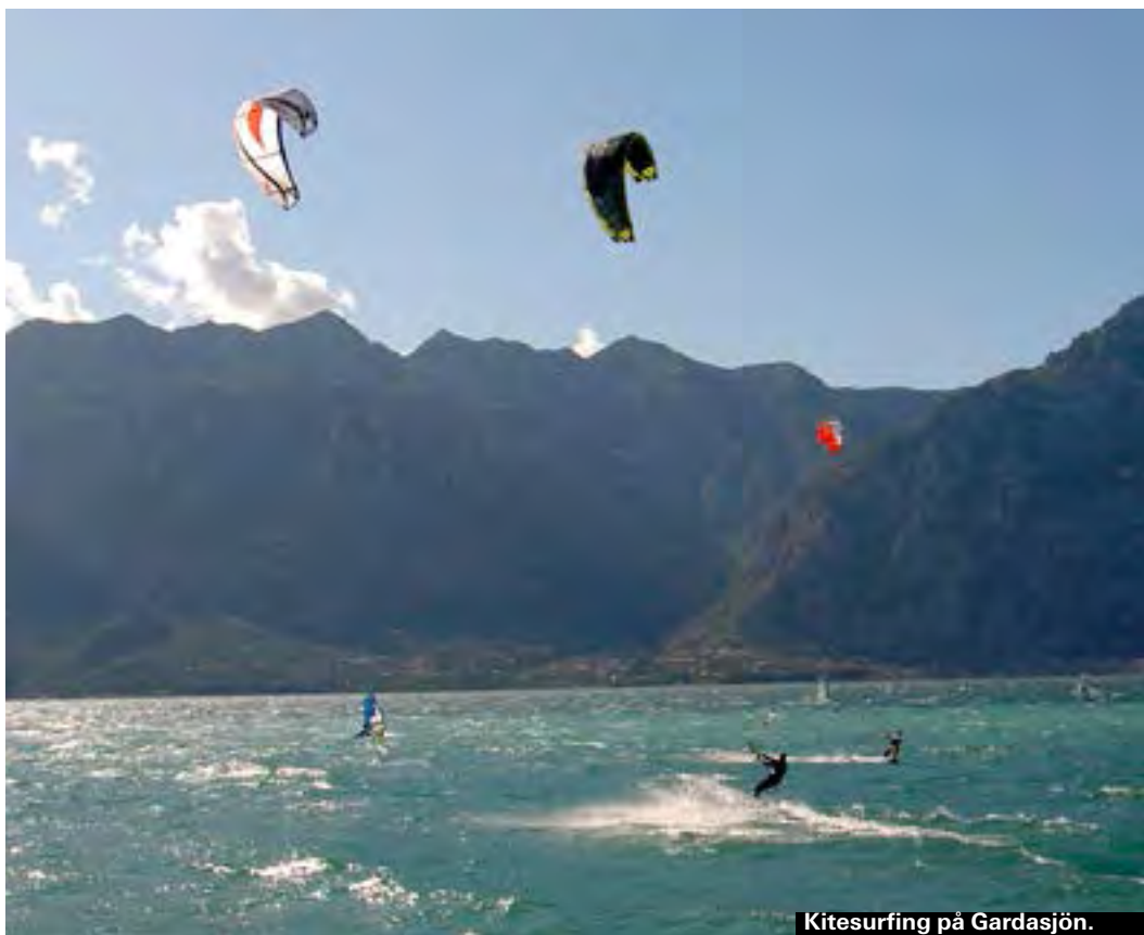
Kitesurfing på Gardasjön.