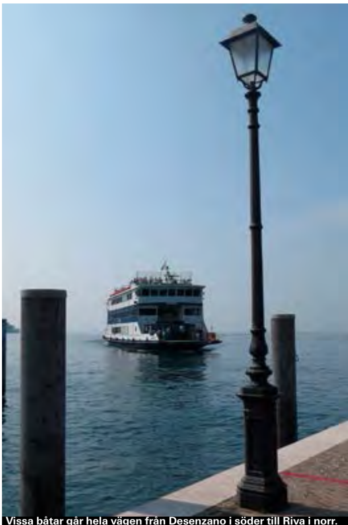
Vissa båtar går hela vägen från Desenzano i söder till Riva i norr.

Det går att åka buss från Sverige till Gardasjön. Till exempel