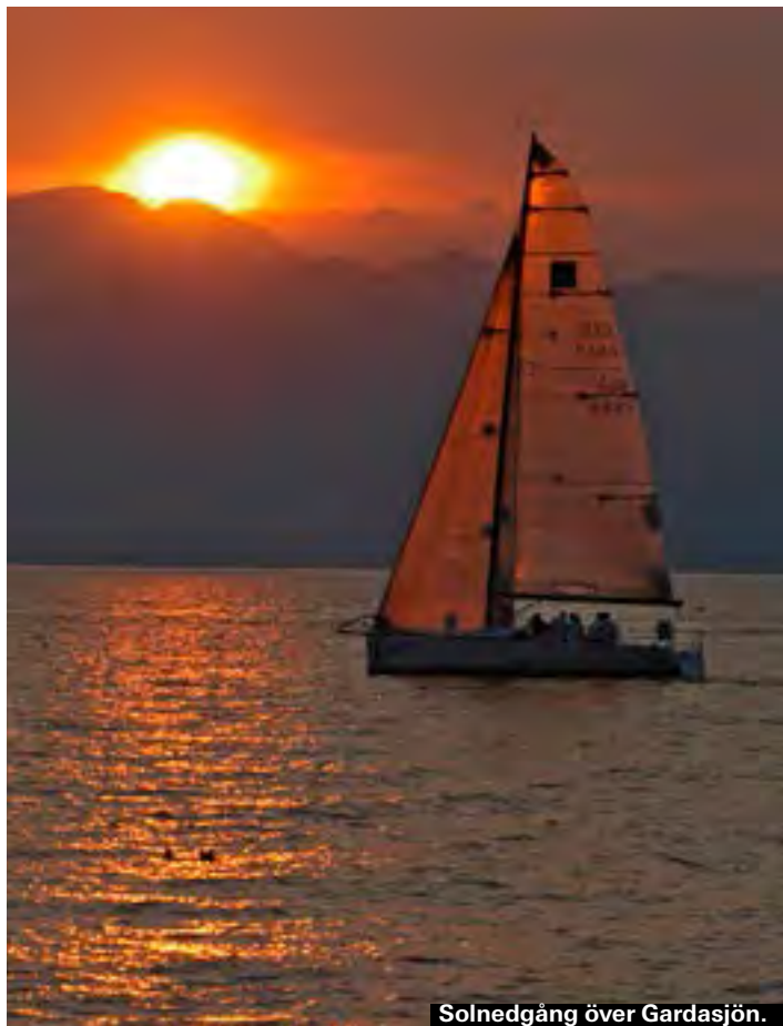
Solnedgång över Gardasjön.

"Ett av världens underverk". Så kallade Winston Churchill vägen la Provinciale 38. Vägen som börjar i Gardesana och