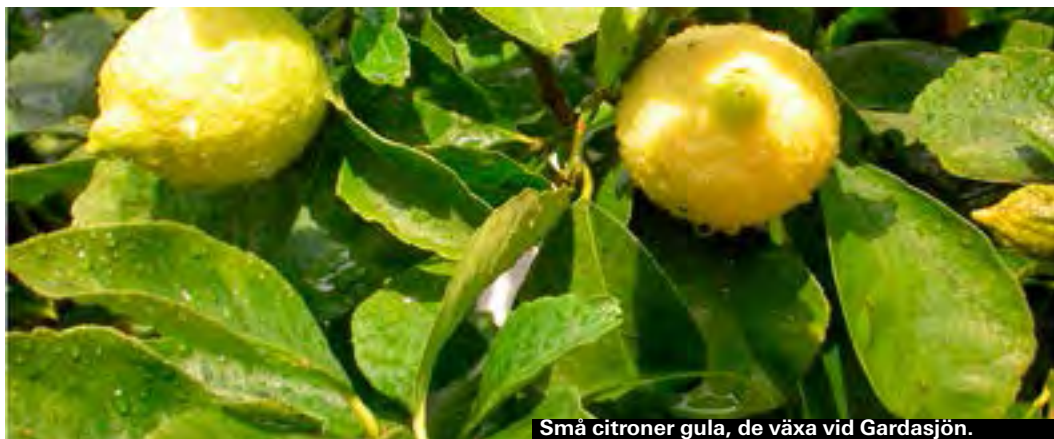
Små citroner gula, de växa vid Gardasjön.

► Via A. Sala 24, Valeggio sul Mincio ► www.pastificioemelli.it