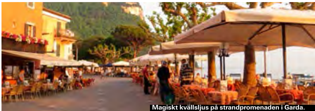
Magiskt kvällsljus på strandpromenaden i Garda.

Radiotaxi Peschiera del Garda: +39 045 755 2348. Radiotaxi Desenzano: +39 030 914 1527.