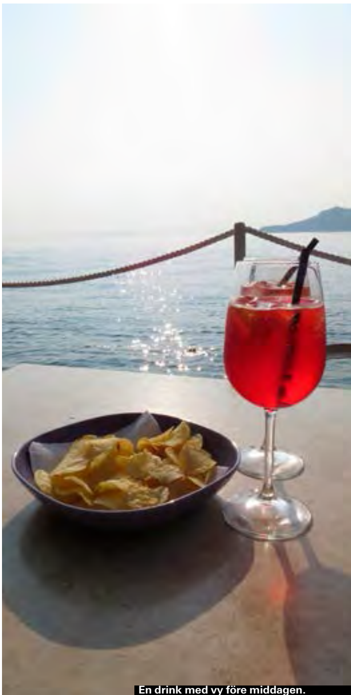
En drink med vy före middagen.