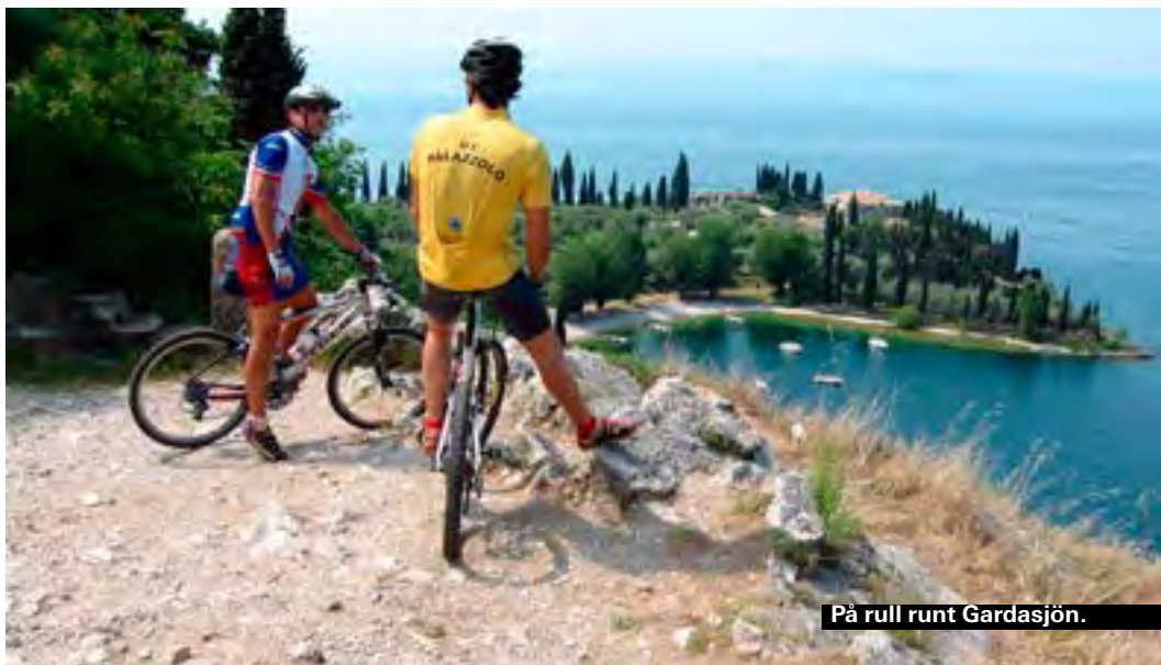
På rull runt Gardasjön.