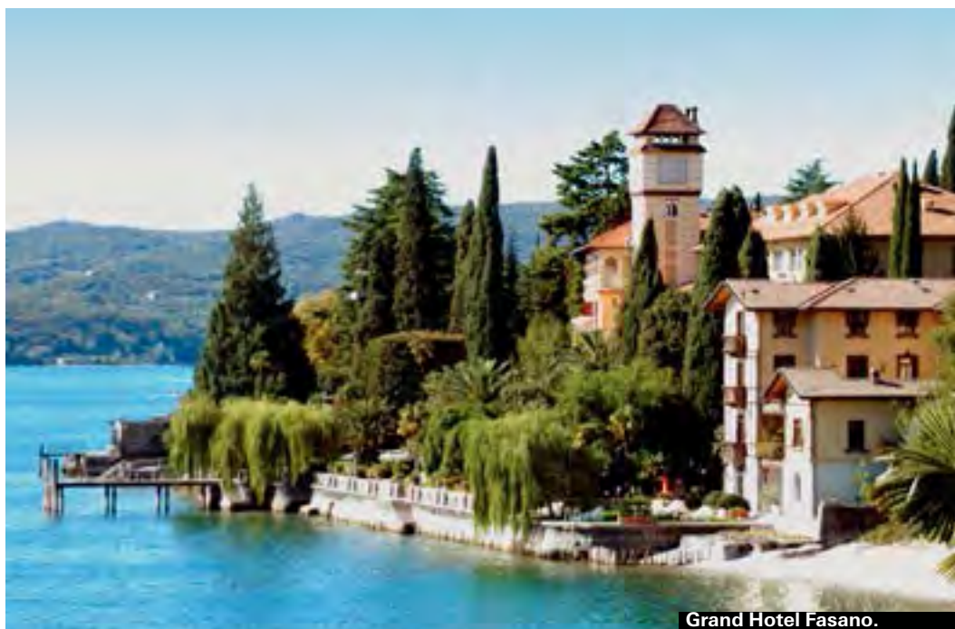
Grand Hotel Fasano.

► Piazza Flaminia 7, Sirmione ► www.hotelcatullo.it