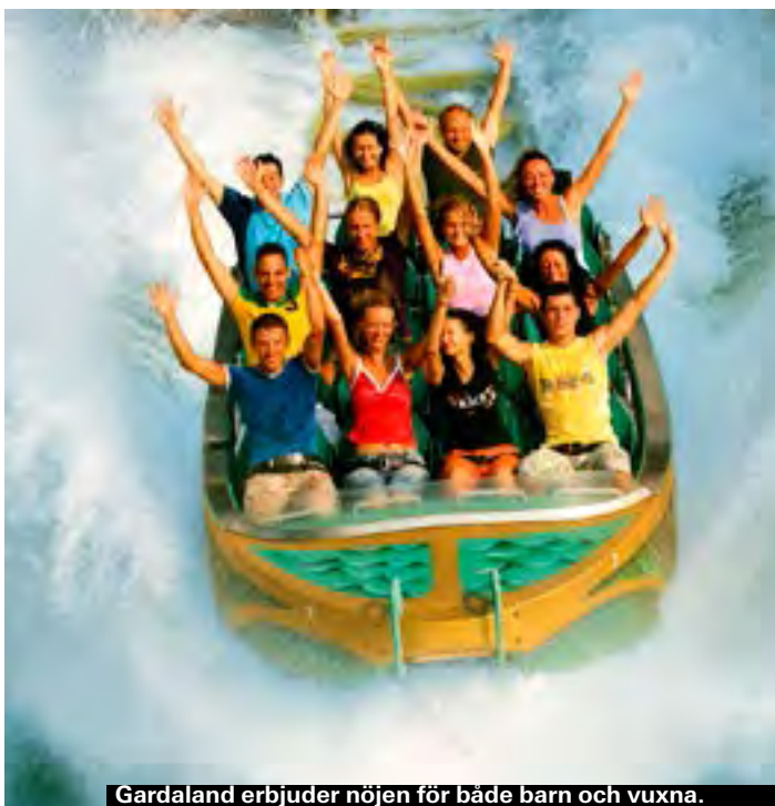
Gardaland erbjuder nöjen för både barn och vuxna.

I Bussolengo, på vägen mot Verona ligger ett spännande zoo, som dels består av en traditionell djurpark, dels av en