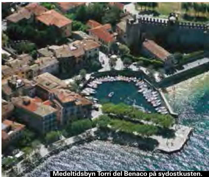
Medeltidsbyn Torri del Benaco på sydostkusten.

På Gardasjöns södra strand ligger de livliga semesterorterna Sirmione och Desenzano. Här blomstrar turismen under sommarhalvåret och letar man