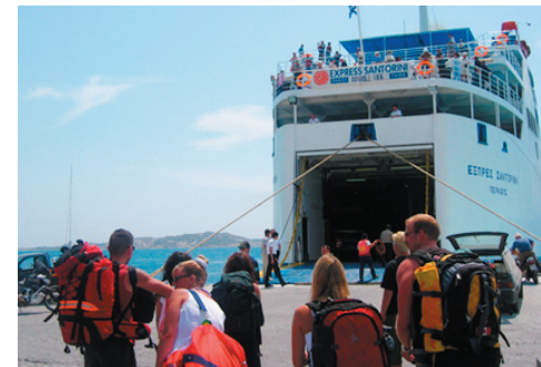
När du kliver av färjan möts du av lokalbor som hyr ut rum till överkomliga priser