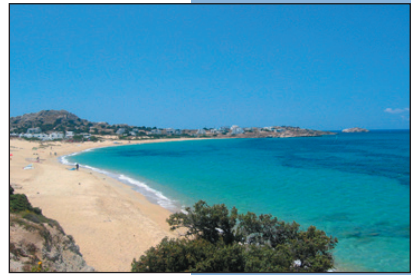
Mikri Vigla är en populär strand bland surfarna