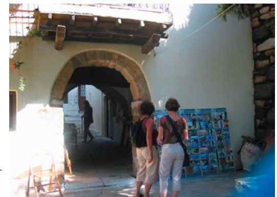
Kastro är Naxos stads mysiga gamla stadsdel