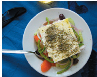
Klassisk grekisk sallad

Tomater fyllda med ris som mixas med grönsaker, exempelvis lök, persilja, dill och bitar av zucchini. Kan i vissa fall även innehålla kött. Bakas i ugn.