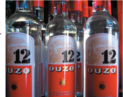
Grekerna dricker oftast sin Ouzo blandad med vatten och is

Det finns två för Grekland typiska kaffesorter, dels "grekiskt kaffe", dels "frapé". Det grekiska