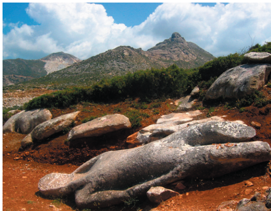
En av Kourosstatyerna utanför Melanes

Tre km söder om Ano Sangri står detta fina tempel som tillägnats den grekiska gudinnan Demeter. Templet uppfördes på 600-talet f.Kr, det förstördes delvis på 700-talet e.Kr och fick därefter förfalla. Grekiska arkeologer återupptäckte templet 1949, mellan 1976 och 1995 gjordes omfattande arkeologiska utgrävningar och därefter bestämde man sig för att restaurera det. Delar är idag renoverat, kopior