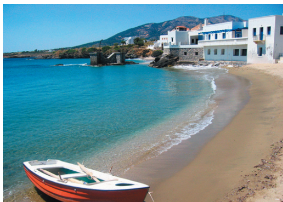
I fiskebyn Moutsouna finner du lugn och ro