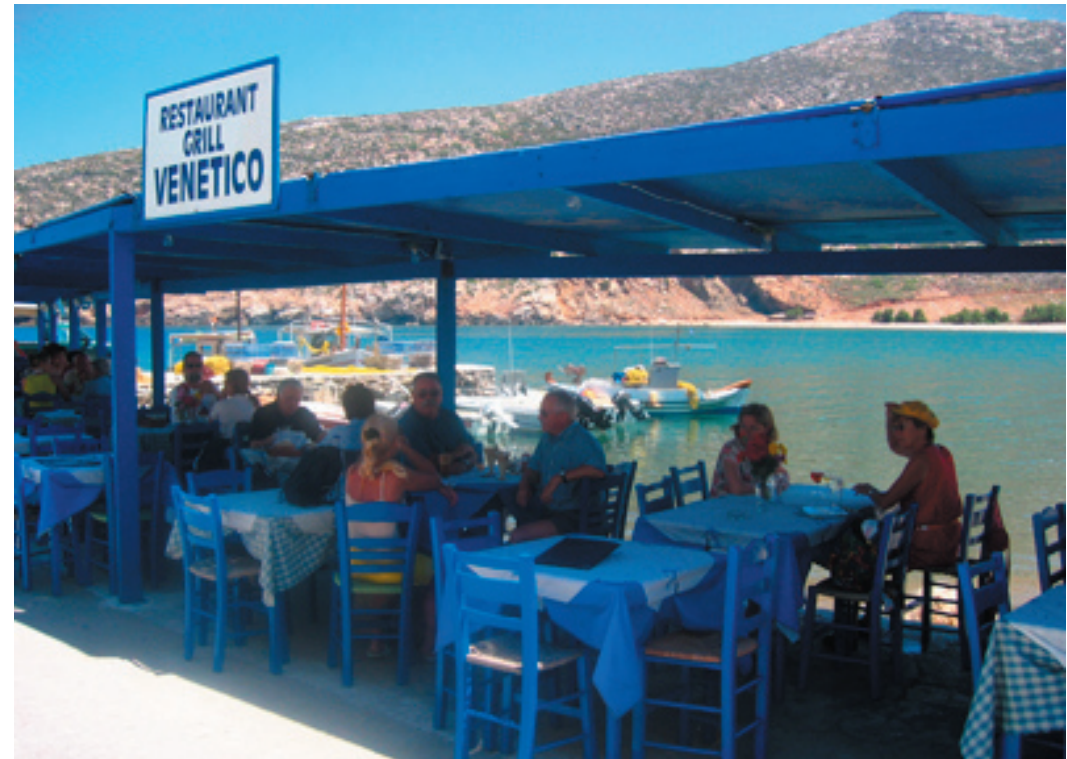
En av de många inbjudande tavernorna i Apollonas