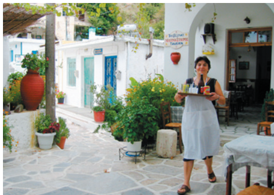
Koronos erbjuder ett andrum från alla turister