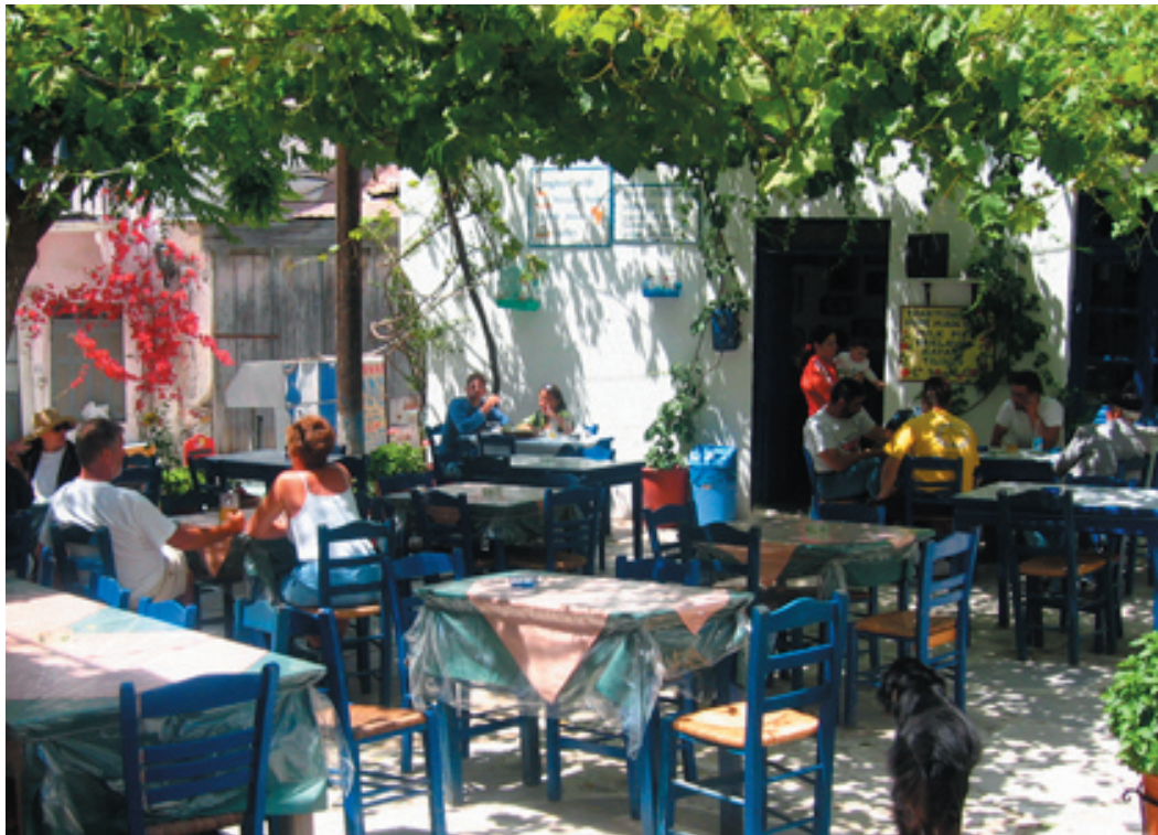
Trädgårdstaverna i gemytliga Chalki - Naxos tidigare huvudstad

Gillar du likörer måste du köpa hem några flaskor Kitron, den är lika god till kaffe som till aperitif. Finns att köpa i flera Kitronbutiker i Naxos stad och på Valindras Kitrondestilleri i Chalki.