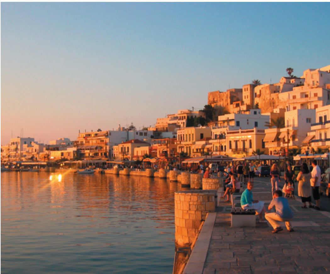
Softa på hamnpromenaden i Naxos stad i solnedgången

N axos är ett av de mest ultimata resmålen i Grekland. Det är en lagom liten ö för att hinna se på en vecka, men samtidigt så pass stor att det finns något kvar att upptäcka nästa gång.