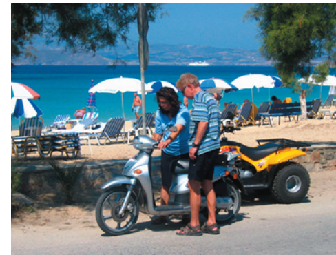
Tre dagar på moped brukar räcka för att se hela ön