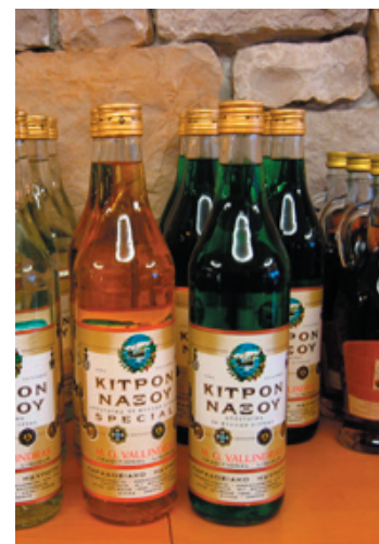
Kitronlikören är något av Naxos specialitet

Frapé är Greklands svar på iskaffe. Man häller vatten i en drinkblandare, fyller på med Nescafé, mjölk, socker och skakar ordentligt. Serveras med is i dricksglas med sugrör.