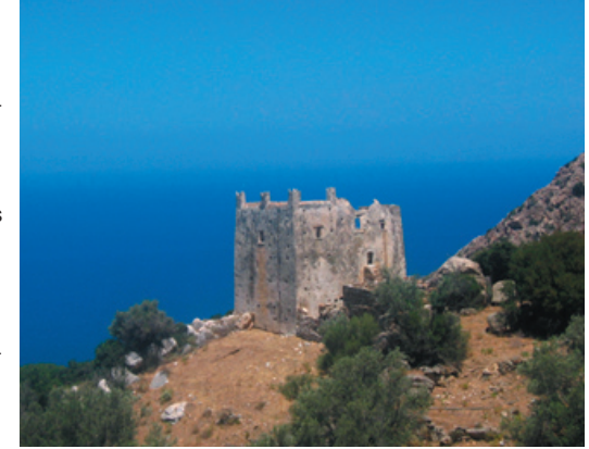
Ett av alla Naxos vackra gamla försvarstorn

Heldagstur med båt till Greklands mest spektakulära ö Santorini. Under en dag hinner man kanske inte se så mycket, men ett besök i de berömda byarna Fira och Oia hinns gott och väl med. Biljetter säljs på resebyråerna. Till Santorini kan man även åka med reguljär färja, flera avgångar dagligen.