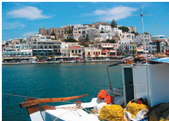
Naxos stad sett från hamnen

Gammalt fiskeläge på norra delen av ön som sakta förvandlats till en liten semesterort. Byn är ett av Naxos populäraste utflyktsmål, främst tack vare den stora Kourosstatyn som ligger ovanför byn, men även för den ganska fina stranden och de många inbjudande tavernorna som strategiskt ligger längs vattnet.