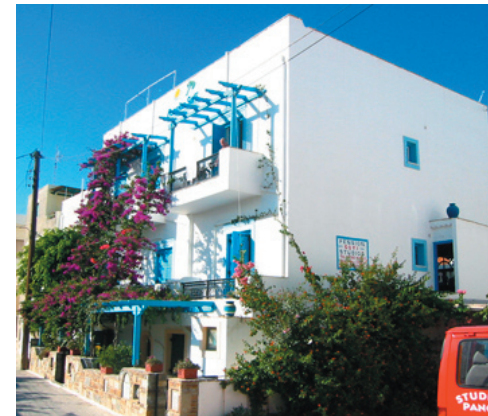
Pension Sofi har mycket gästvänliga ägare