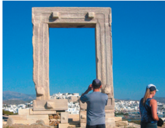
Portaran på Pálatia-halvön välkomnar alla som kommer till Naxos stad med båt

av kolonner och pelare har rests och man får en ganska klar bild över hur templet en gång såg ut.