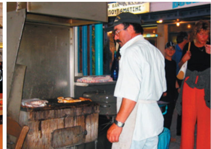
To Limanaki serverar underbar grillad bläckfisk