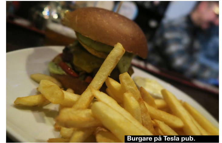
Burgare på Tesla pub.

► Totorių g. 5 ► www.facebook.com/teslagrillpub/