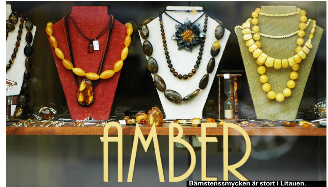
Bärnstenssmycken är stort i Litauen.

Litauen är bra på båda och priserna mycket låga.