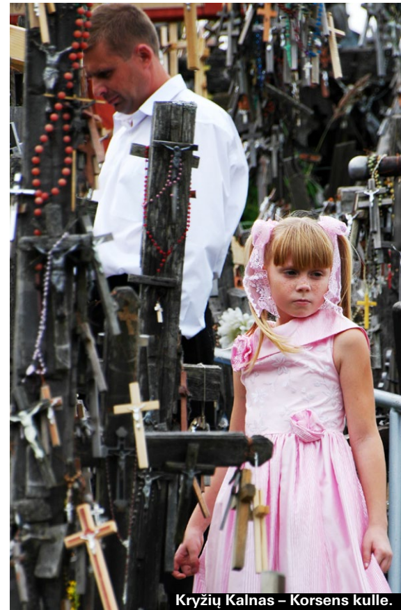
Kryžių Kalnas – Korsens kulle.

Blandskogsområde med massor av små sjöar, fina vandringsleder och en hel del vilt, som hjortar och vildsvin, nästan så långt österut som man kan komma i Litauen. ► www.aparkai.lt