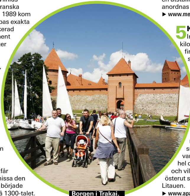
Borgen i Trakai.

trävimplarna med figurer, hus och symboler i svart, vitt och rött – flaggor som traktens fiskare förr prydde sina båtar och hus med. Från sent 1800-tal, när Nida ännu var tyskt, flockades tyska intellektuella hit – mest berömd var författaren Thomas Mann som bodde här flera somrar, här finns ett museum om honom. Nida har mestadels små fina pensionat och numera finns flera utmärkta matställen. Missa inte det fina bärnstenmuseumet – Kuriska näset var länge en av de största producenterna av bärnsten i världen. Än i dag hittar man bärnsten som spolas i land på våra ränder. ► visitneringa.com