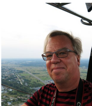
Text & foto: JOHAN ÖBERG

Men det finns mer att upptäcka bortom stadsgränsen: På nära håll är Trakai med sina sjöar och minst sagt imponerande borg ett givet utflyktsmål, den konstintresserade ger sig ut till Europas geografiska mittpunkt och kollar monumentalkonst och den med mer tid ska varken missa Korsens kulle eller en av Östersjökustens allra vackraste trakter – Kuriska näset. God tur och återvänd snart igen – resan har ju bara kostat hälften mot semester hemma, så man kan säga att man får två resor till priset av en.