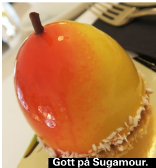
Gott på Sugamour.