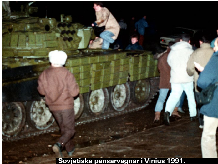
Sovjetiska pansarvagnar i Vilnius 1991.

En årligen återkommande multikulturfestival som hålls under tre dagar tidigt i september. Mycket är gratis dessutom.