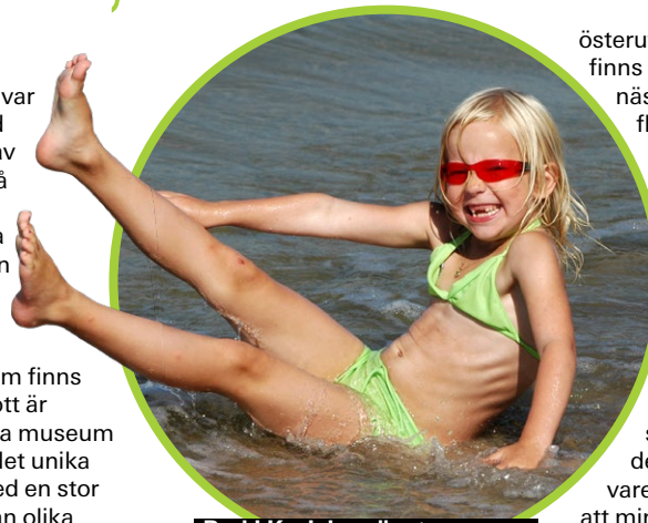
Bad i Kuriska näset.

Hela Kuriska näset är 98 kilometer långt (hälften tillhör Litauen och är mestadels nationalpark, hälften Ryssland) och består egentligen bara av sand, täckt av tallskog med några få rara byar på insidan av näset och en enda låååång, len sandstrand på den sida som vetter mot Östersjön. Vid ett par av byarna är det barer, solstolar och aktiviteter på