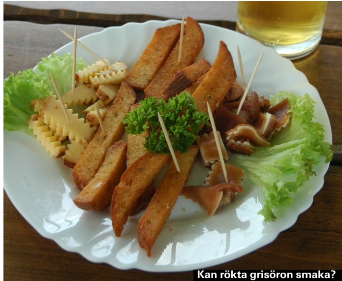
Kan rökta grisöron smaka?

Många litauer bara "måste" ha dess två superbilliga snacks