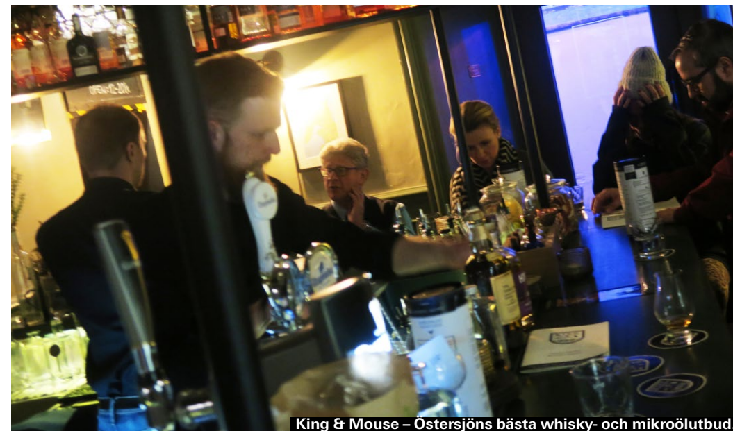
King & Mouse – Östersjöns bästa whisky- och mikroölutbud.