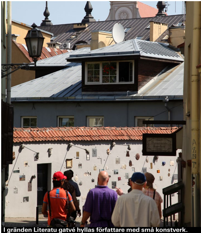
I gränden Literatu gatvė hyllas författare med små konstverk.

Att stadsdelen 1997 utropade sig till en självständig republik ska mer ses som ett konstprojekt än politisk handling. Då var Užupis hårt nedslitet och kulturarbetare flyttade in i fallfärdiga hus med ingen eller låg hyra. I dag har stadsdelen delvis gentrifierats, men charmen finns kvar