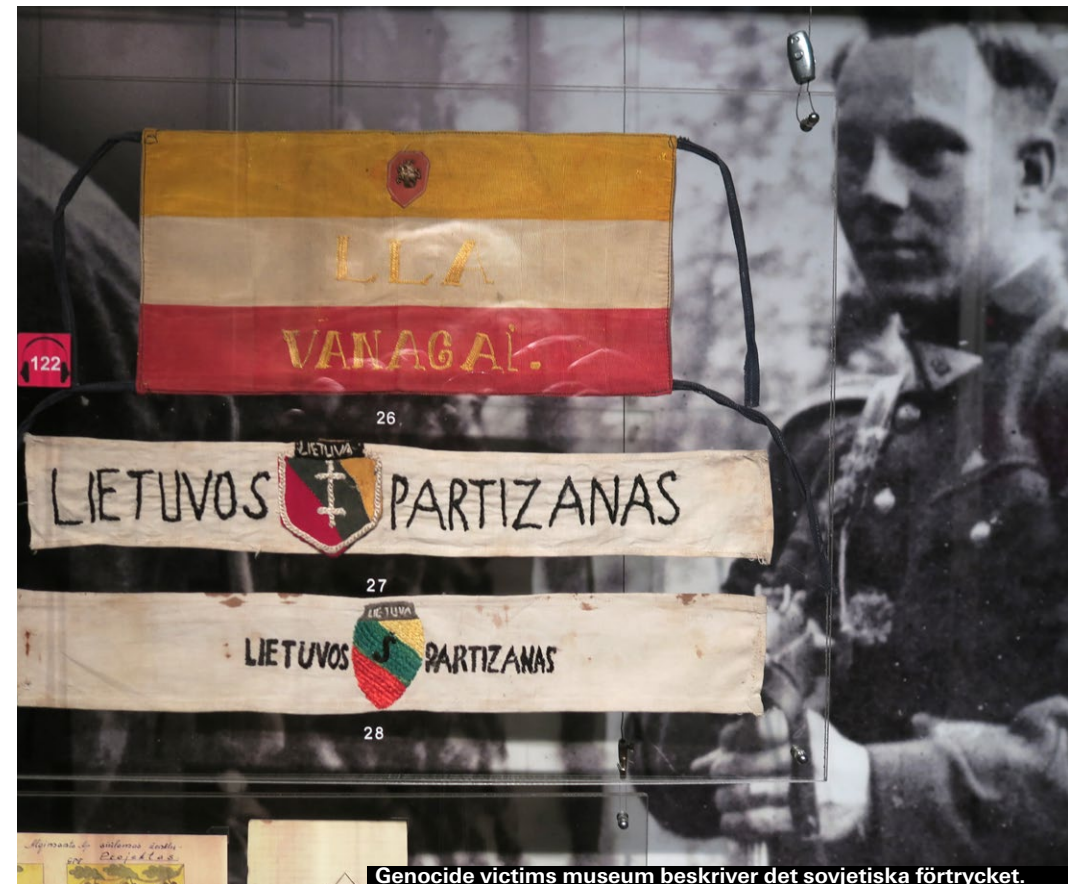
Genocide victims museum beskriver det sovjetiska förtrycket.