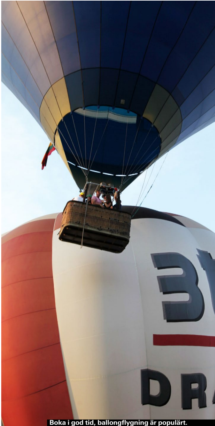
Boka i god tid, ballongflygning är populärt.

Riskerna är små. Litauiska ballongpiloter hör till de mest erfarna i världen. Störst skaderisk är det vid landning om det blåser mycket – håll i er och följ pilotens instruktioner!