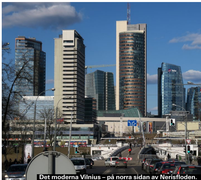
Det moderna Vilnius – på norra sidan av Nerisfloden.

där en 3-dagarsbiljett bara kostar 2,90 euro och en månadsbiljett går på 3,90 euro. Man registrera sig och köper sin biljett på hemsidan.