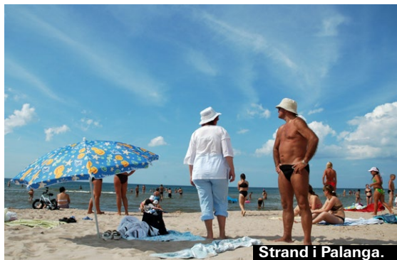
Strand i Palanga.

Litauens enda hamnstad så hamnen dominerar staden som ju också har färjeförbindelse med Sverige). Tyvärr förstördes stora delar av staden under andra världskriget men än finns en del fina hus kvar från tiden då staden var tysk och hette Memel. ► www.klaipedainfo.lt