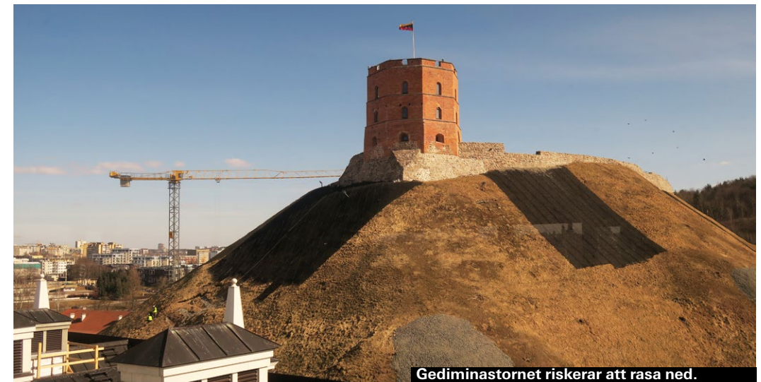
Gediminastornet riskerar att rasa ned.

– Vilnius är en grön stad, som gjord för jogga, cykla eller gå i. Jag går gärna längs nya strandpromenaden vid floden Neris. Ta norra sidan i solen och gå in i stadsdelen Zverynas för att se på trähus och trädgårdar. Här får en del fortfarande hämta vatten i en kommunal blå pump, medan grannen kanske har en Porsche i sitt underjordiska garage. – Den givna kvällspromenaden är längs alla romantiska gränder i innerstan och genom de judiska kvarterens hemiska historia ned över broarna till Vilnius eget Montmartre, bohemstadsdelen Uzupis.