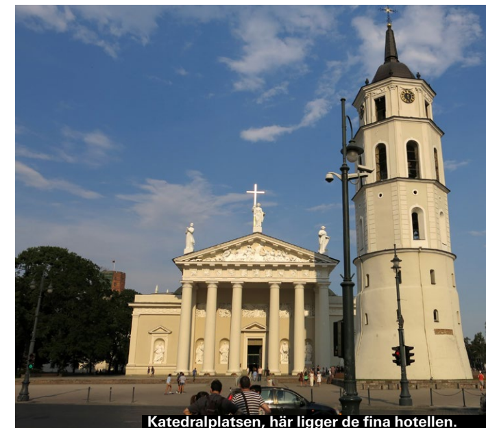
Katedralplatsen, här ligger de fina hotellen.