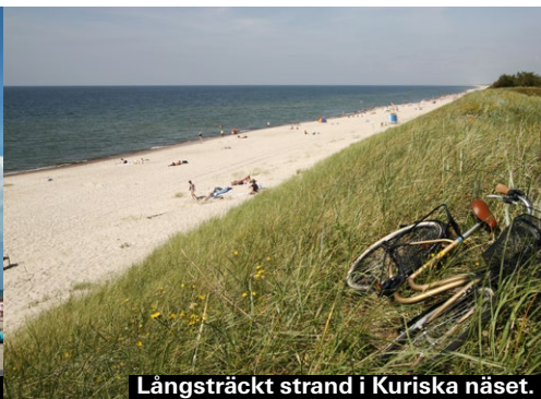
Långsträckt strand i Kuriska näset.