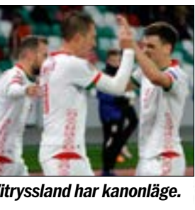
Vitryssland har kanonläge.

Rumänien är något försäkrat av ett par avstängningar, men det duger inte som ursäkt. Ska bara vara toppchans hemma från ett undermåligt Vitryssland. Spikas. Kosovo är i god form och har motivationen och inte blir det bättre av att man har tre spelare avstängda. Får problem. Det är inget fel på viljan hos San Marino, men har ej tillräckligt med resurser för att konkurrera. Vitryssland singlar.