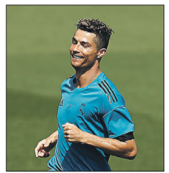
Ronaldo är spelklar.