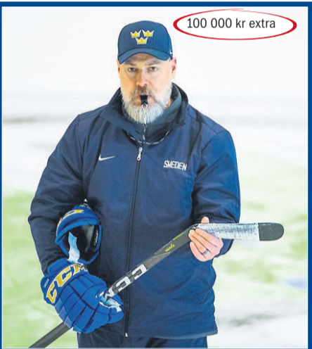
Storseger för Tre Kronor?