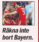
Räkna inte bort Bayern.

Match A: Bayern München är i brygga, efter 1-2-förlusten senast. Kan dock aldrig räknas bort. Real Madrid slog Juventus borta med 3-0 i förra rundan. Var sedan nära att snubbla bort allt i returen. Alltid farligt framåt, men har defensiva brister. Match C: Känns nästan som en final. Bara att kolla in tabellläget. Scunthorpe kan vara en favorit i fara.