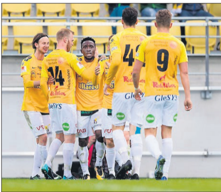
Falkenberg har inlett superettan med fyra raka segrar.