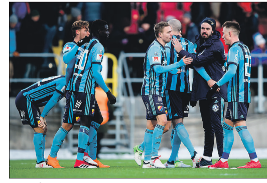
Djurgården spikas mot Trelleborg.