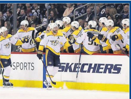
Nashville vinner på bortais?