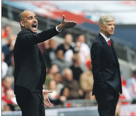
Vem vinner duellen mellan Pep Guardiolas City och Arsène Wengers Arsenal?