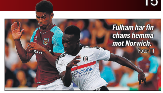
Fulham har fin chans hemma mot Norwich.

Vanskligt att leta spikar i The Championship. Är av hävd en svårtippad serie och det är ju dessutom premiär. Men gillar verkligen Fulhams chanser - inte bara nu till helgen utan sett till hela säsongen. Lyckats behålla merparten av sina nyckelspelare och har alla verktyg som krävs för att blanda sig i toppstriden. Norwich är bra, men känns inte riktigt "färdigbyggt". Olympiakos behöver inte vinna men kommer få fina ytor. Fin chans.