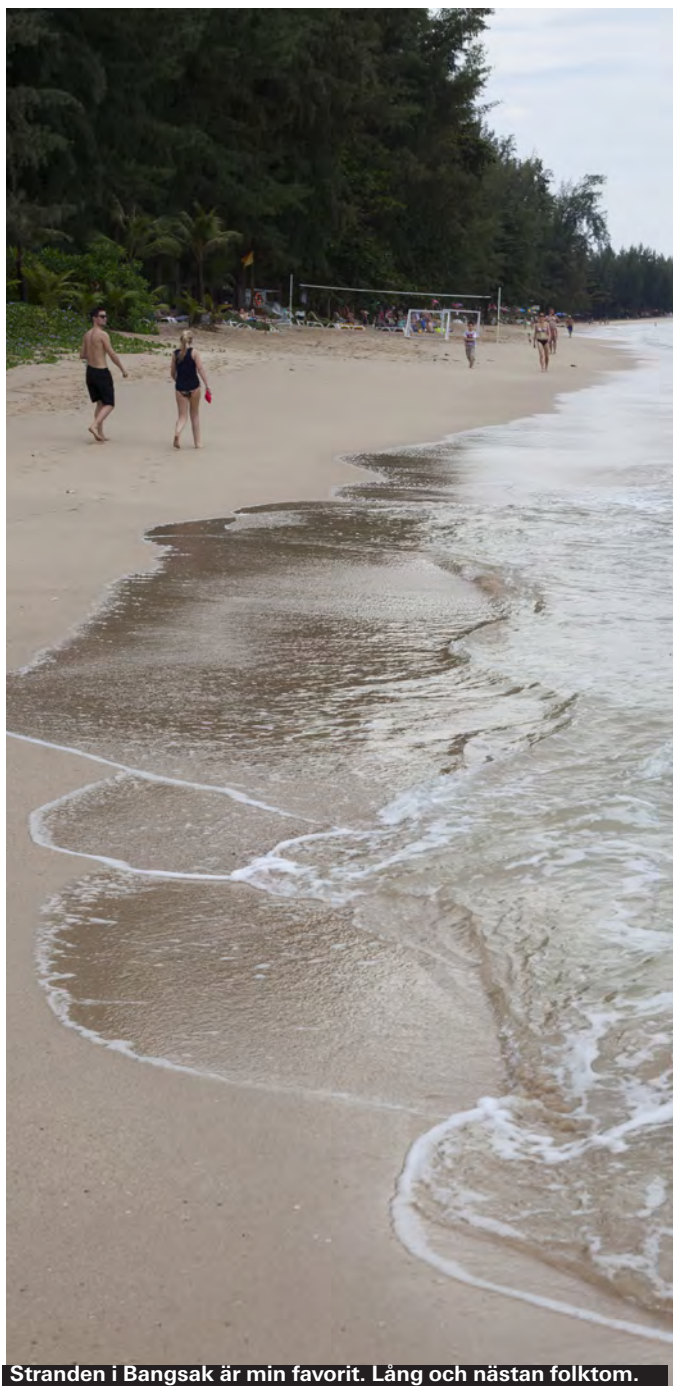
Stranden i Bangsak är min favorit. Lång och nästan folktom.