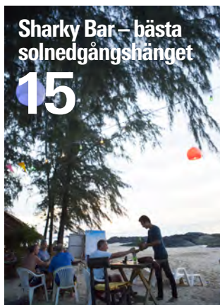
Sharky Bar – bästa solnedgångshänget 15