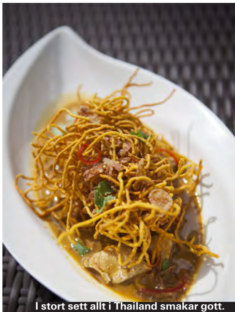
I stort sett allt i Thailand smakar gott.

Kang Keaw Wan Gai är en av mina verkliga favoriter. Kyckling i grön curry. Kyckling är en av de populäraste kötten i Thailand.