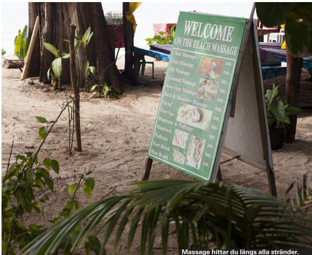
Massage hittar du längs alla stränder.

Förstås. Bada i sammetslent vatten. Missa inte de tidiga morgnarna när du får havet nästan för dig själv och ser solen klättra upp över palmerna. En bättre start på dagen finns inte.