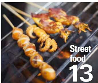
Street food 13