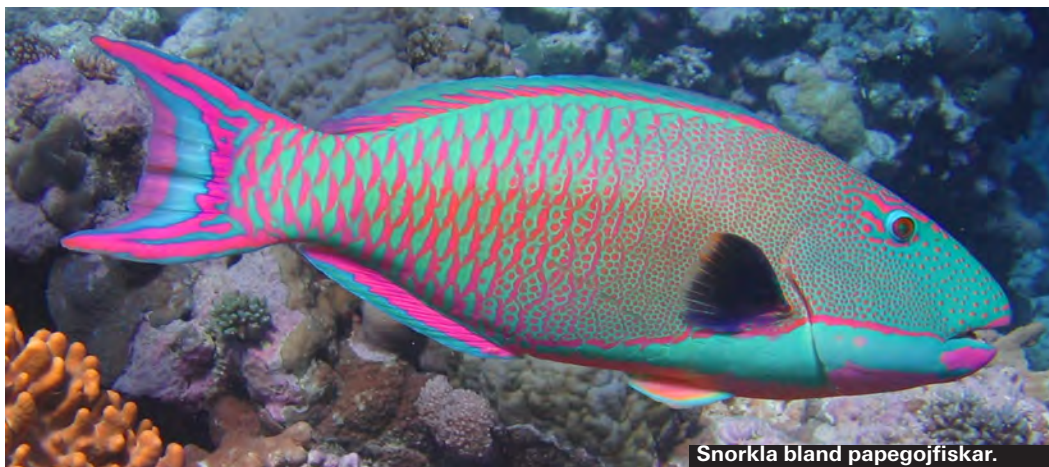
Snorkla bland papegojfishar.

Rockor finns men bara under vissa delar av året.