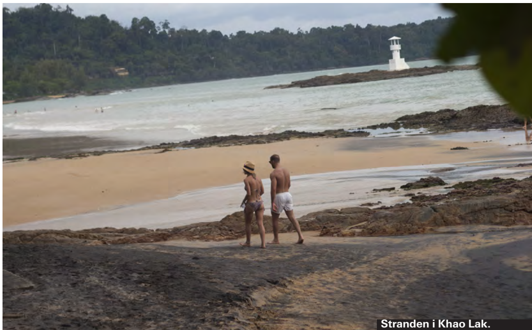
Stranden i Khao Lak.

Naturen är enastående, för många besvaras bilden av hur ett tropiskt paradiset ser ut när de hittar sin egna lilla badvik med genomskinligt vatten, kritvit pudervit sand, vajande palmer och tät tropisk regnskog. Thailand är som allra vackrast här. En tropisk miljö som besöks av så många varje år – självklart kostar det på. Vattenfrågan är ett problem, som besökare kan alla hjälpa till att minimera skadan så mycket som möjligt. Hushåll med vatten, skräpa inte ner. Även hotellen har förstas om ansvar, vilket det känns som att de blir mer och mer medvetna om. Från att tidigare ha ignorerat påverkan har många i alla fall erkänt att det de gör lämnar avtryck. Mycket mer kan förstås göras ändå.