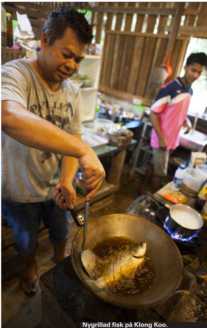
Nygrillad fisk på Klong Koo.

Lom Lay har bara funnits ett år men har redan blivit ett populärt tillhåll för många. Läget på den nästan folktomma Bangsakstranden är perfekt. Personalen gör allt för att du ska trivas. Klockan fem varje eftermiddag fylls det isade bordet på med färsk fisk, då