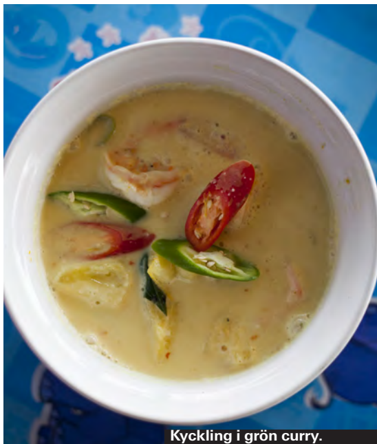
Kyckling i grön curry.