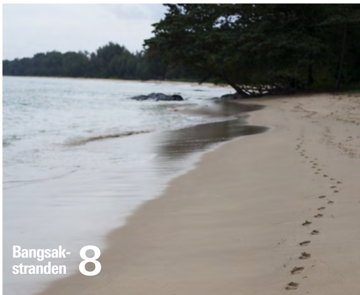
Bangsak- stranden 8