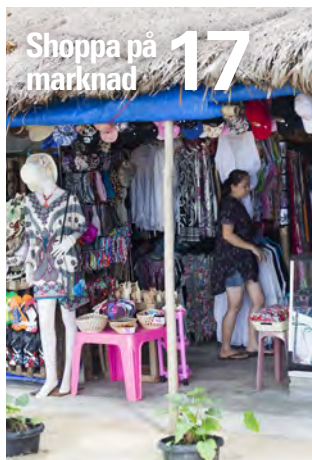
Shoppa på marknad 17