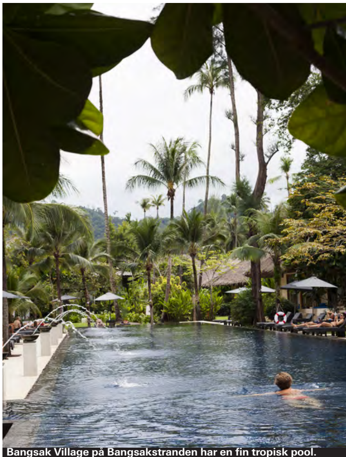
Bangsak Village på Bangsakstranden har en fin tropisk pool.

► 18/1 Moo 7 Nang Thong Beach Petchkasem Road