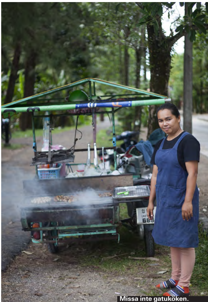
Miss inte gatuköken.

De små ambulerande gatuköken ser man lite överallt. En moped med tillhörande litet kök, så fiffigt. Ofta satsar man på grillspett och annat gott.