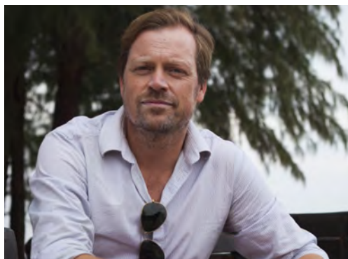
Text & foto: JONAS HENNINGSSON

vindlande upplevelser. Vill du uppleva ännu mer stillsamma platser finns små öar alldeles utanför kusten. Maten, byarna, naturen, ljuden av tropikerna, de magiska solnedgångarna – allt det där kommer att etsa sig fast hos dig. Men mest kommer du att minnas mötena med människorna.