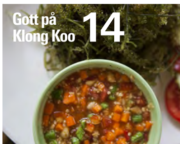
Gott på Klong Koo 14