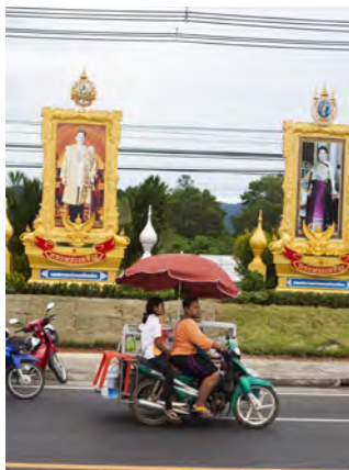
Många hyr motorcykel.

Hotellen har egen taxiservice och längs huvudgatorna finns skyltar överallt med taxi. Använd dem för att åka mellan stränderna, till något vattenfall eller för en lite långre tur, som