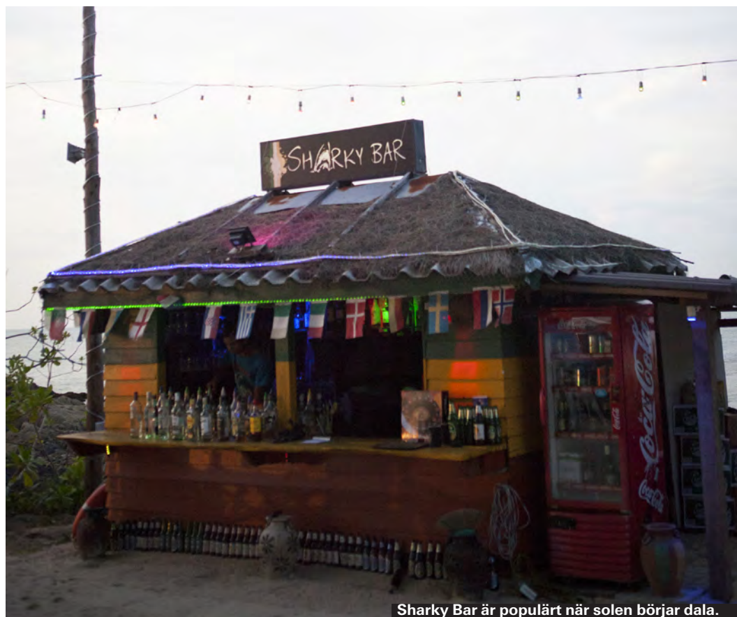
Sharky Bar är populärt när solen börjar dala.

► Pakarang Beach, Khao Lak ► www.memoriesbar-khaolak.com