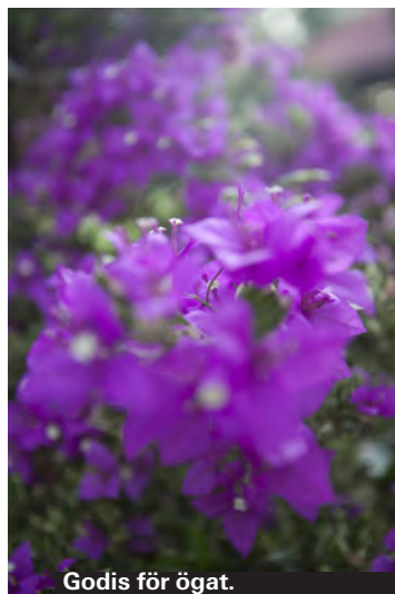
Godis för ögat.