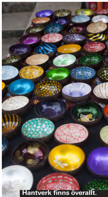
Hantverk finns överallt.

Du kommer inte att vara i Khao Lak länge förrän du ser alla små skräddarateljéer, på varenda strand finns de. Den som vill kan få en måttbeställd kostym med extra byxor och skjortor för runt tusenlappen. Men det är inte helt enkelt att veta vem man ska välja. Kolla runt, fråga runt innan du bestämmer dig.