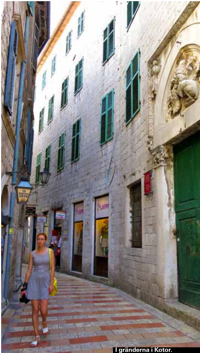
I gränderna i Kotor.