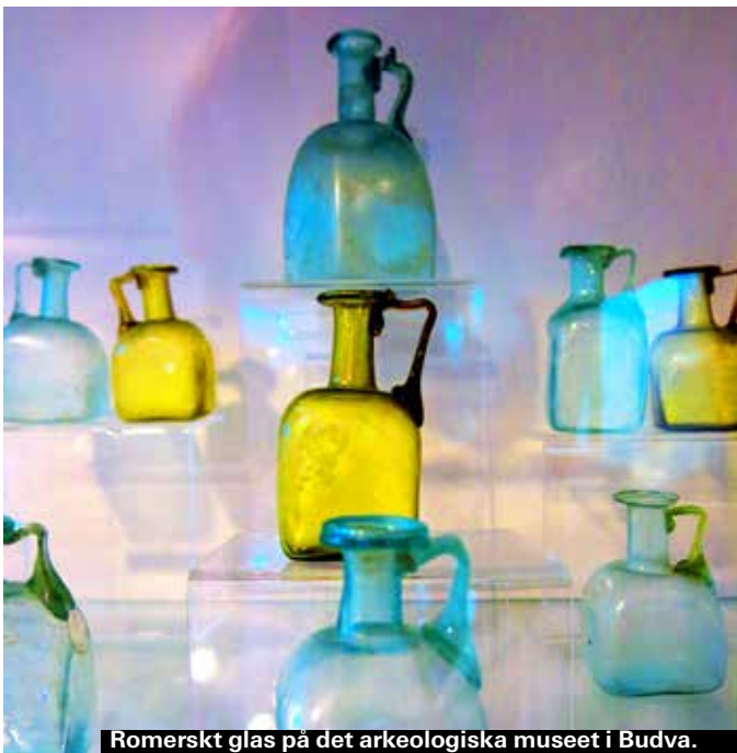
Romerskt glas på det arkeologiska museet i Budva.