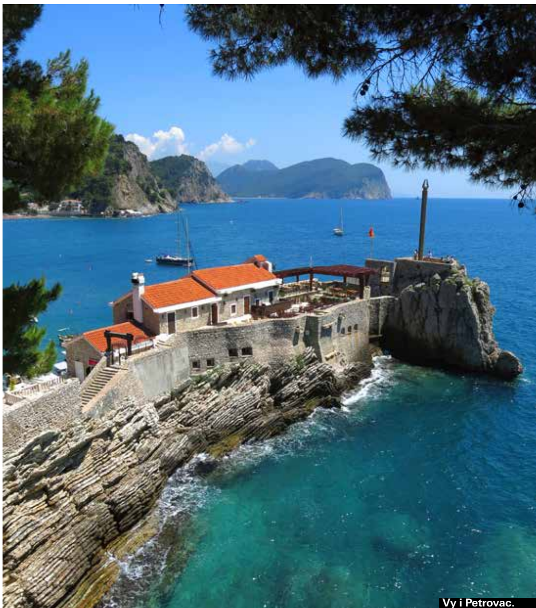
Vy i Petrovac.