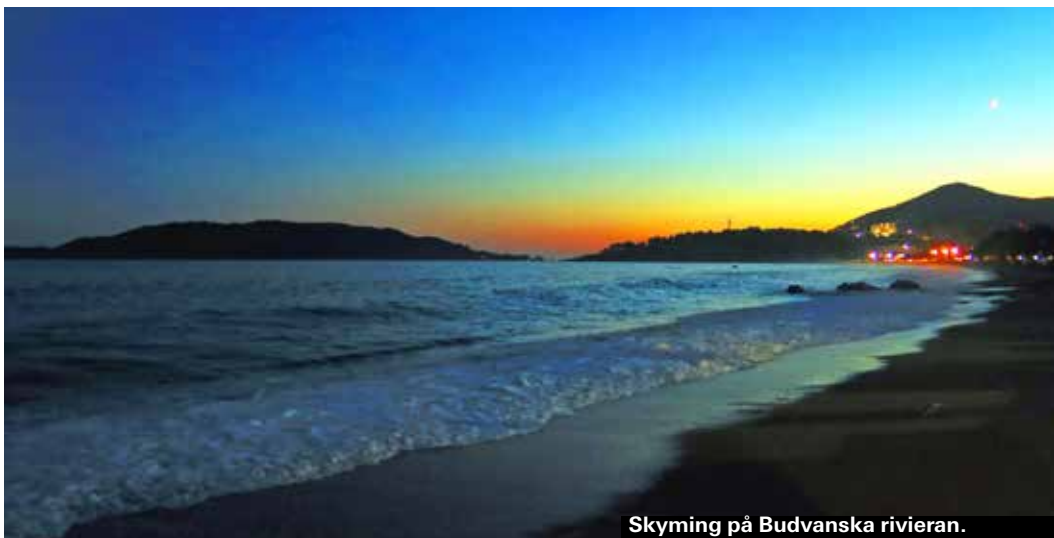
Skymning på Budvanska rivieran.