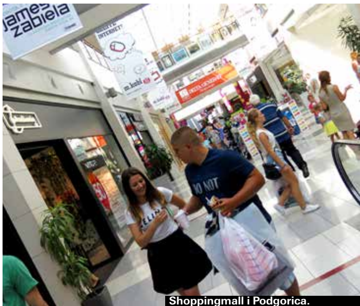
Shoppingmall i Podgorica.

De delar av världsarvsstaden som döljer sig bakom stadsmurarna har gott om fina mode-, souvenir- och hantverksbutiker. Prisnivån går från billigt till höga