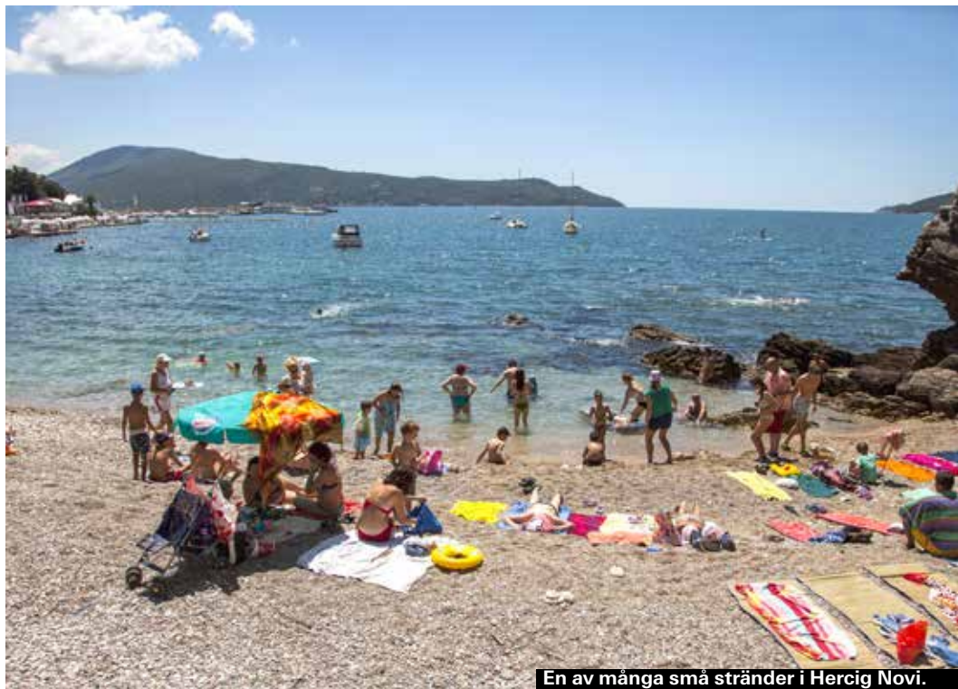
En av många små stränder i Hercig Novi.

Lusticahalvön utanför Kotorbukten har förblivit vild Medelhavsnatur, med en blandning av året-runt-gröna buskar och träd och olivlundar. Här och där leder vägar ner till olika stränder. Att man när man når havet ska befinna sig ihop med hundratals andra och rader av serveringar kommer som en överraskning med tanke på de smala, glestrafikerade vägarna – hur hittar alla hit? det håller i allra högsta grad Žanjice beach med sin lilla mindre tvillingstrand. Men mysigt är det på denna klapperstenstrand i en skyddad vik.