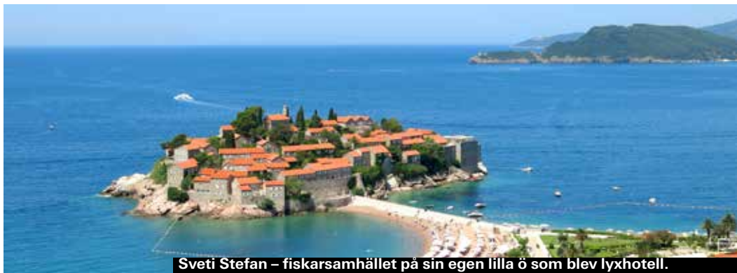
Sveti Stefan – fiskarsamhället på sin egen lilla ö som blev lyxhotell.