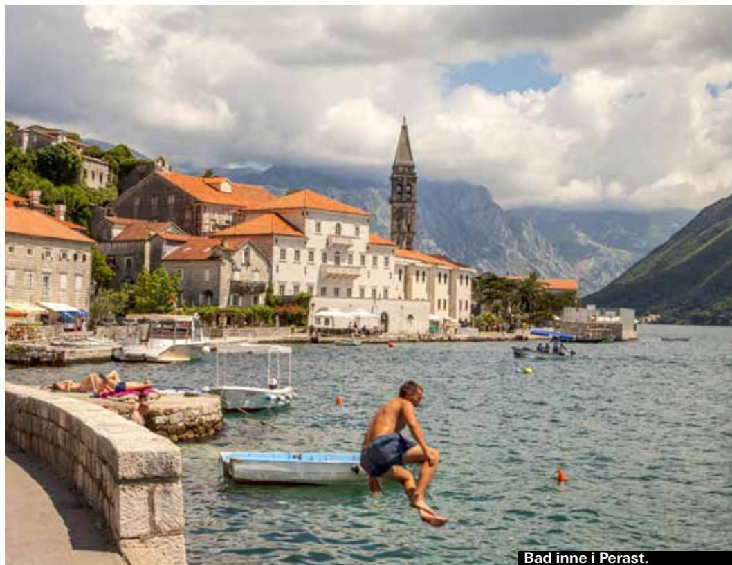
Bad inne i Perast.

Den här lilla flacka ön och en konstgjord ö strax intill är ett av stoppen på båtturen runt Kotorbukten. Titta in i det fina klostret och njut av vyerna över vatten och berg. Inträdet till det lilla museet är 10 kr.