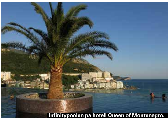
Infinitypoolen på hotell Queen of Montenegro.

Snyggt designat hotell på en kulle nära havet (man har en