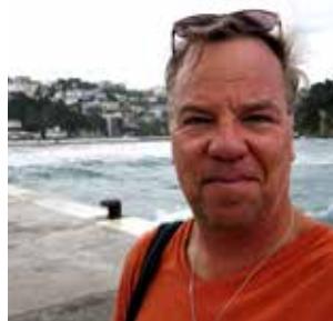
Text och foto: JOHAN ÖBERG

Skönheten är Montenegros främsta trumfkort, men också att landet för de flesta av oss är så okänt att det garanterat finns massor att utforska. Så efter morgondoppet – ut och upptäck!