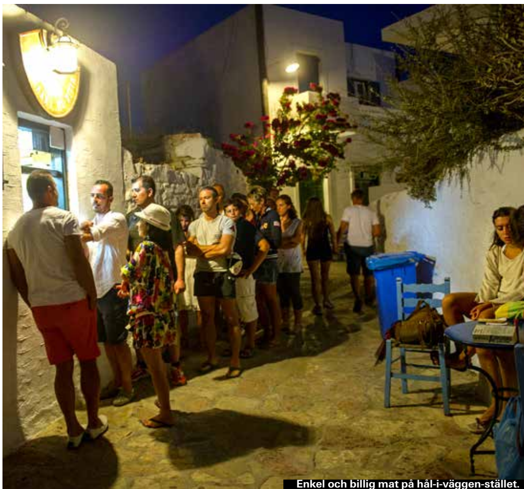
Enkel och billig mat på hål-i-väggen-stället.

Öns i särklass mest populära bespisning är bokstavligen ett hål i väggen. Utanför ett litet fönster med gröna karmar, mitt i byns branta huvudgränd, slingrar sig kön lång medan himmelska dofter letar sig långt ut på gatan. På menyn: pitabröd med kebab, gyros eller souvlaki för 2,50 euro. Varken mer eller mindre.