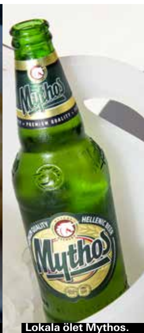
Lokala ölet Mythos.