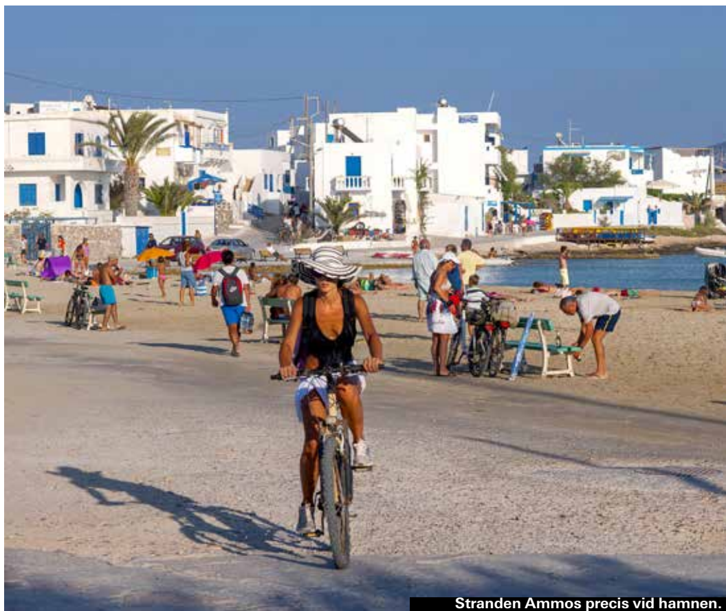
Stranden Ammos precis vid hamnen.