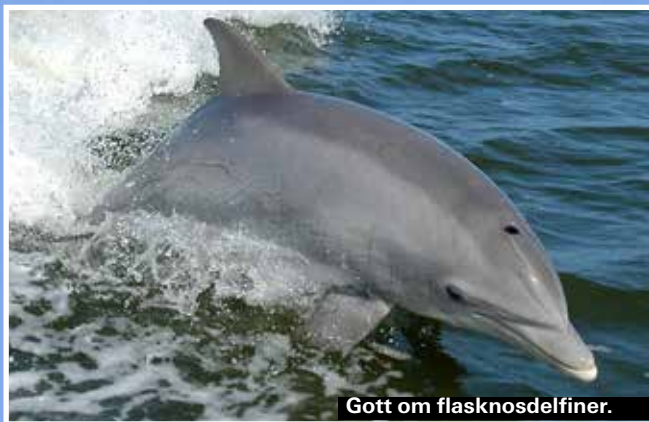
Gott om flasknosdelfiner.