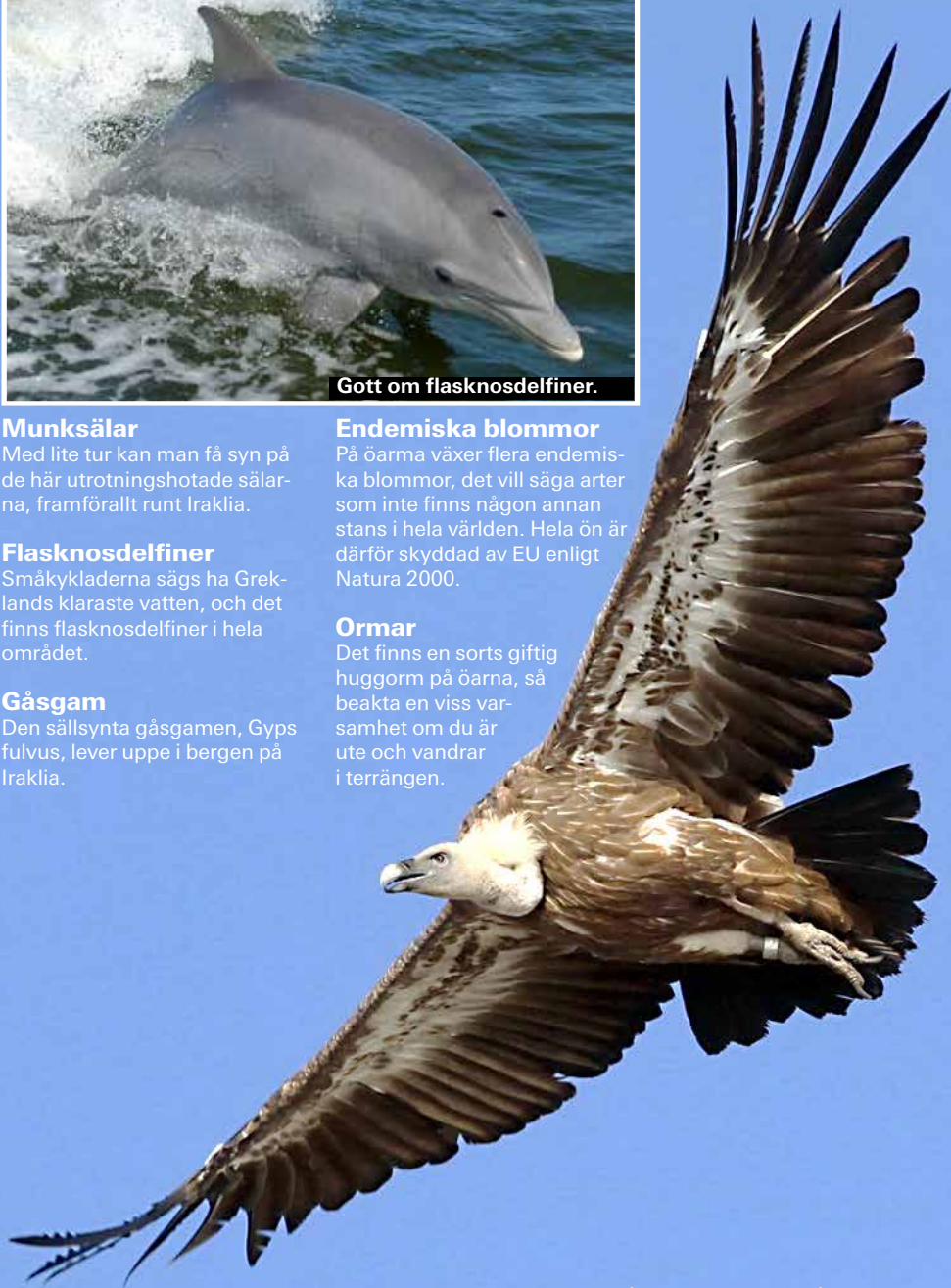
Gåsgamen häckar på Iraklia.

Det finns en sorts giftig huggorm på öarna, så beakta en viss varsamhet om du är ute och vandrar i terrängen.