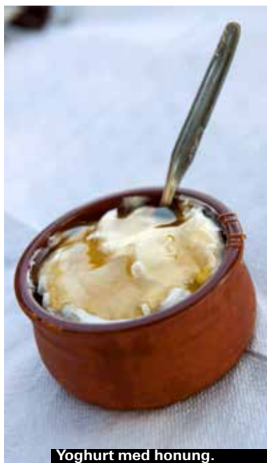
Yoghurt med honung.

Alltid på menyn, i olika varianter. Prova med lokal ost om det finns, den slår nästan alltid den vanliga fetaosten med hästlängder.