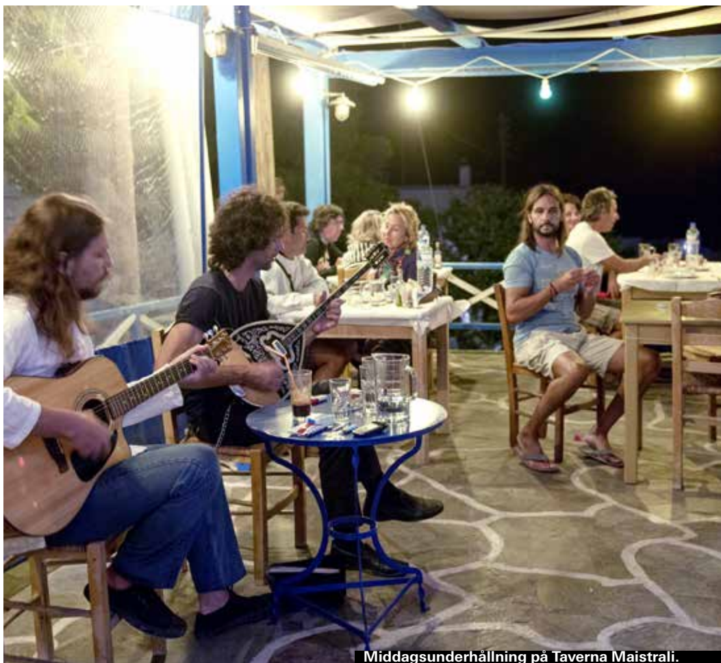
Middagsunderhållning på Taverna Maistrali.