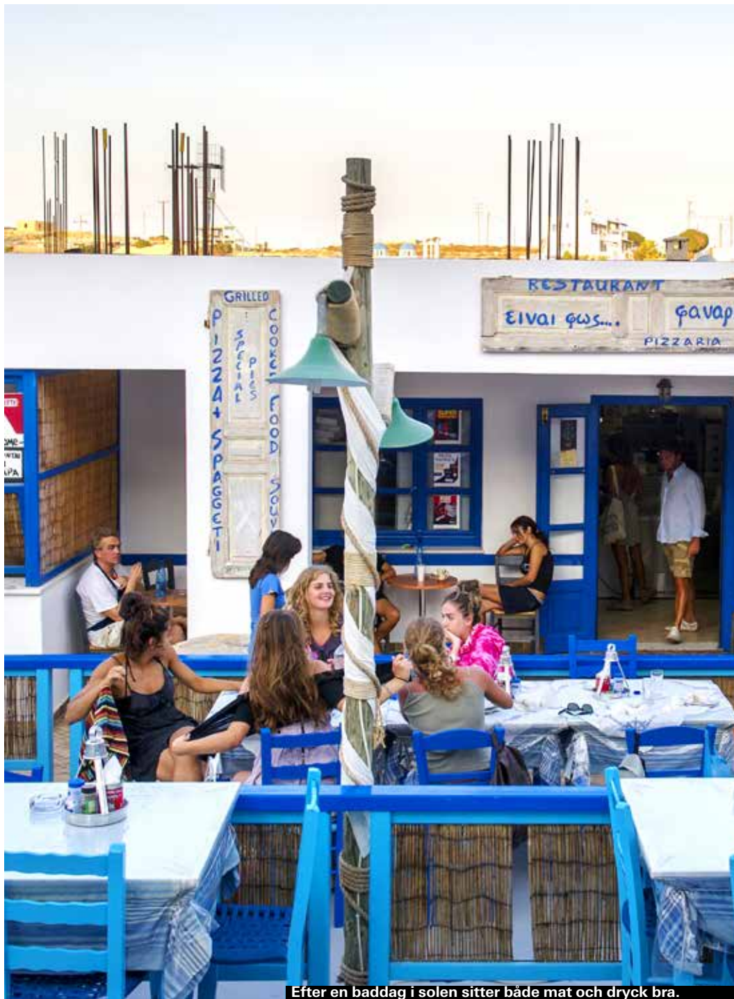
Efter en baddag i solen sitter både mat och dryck bra.