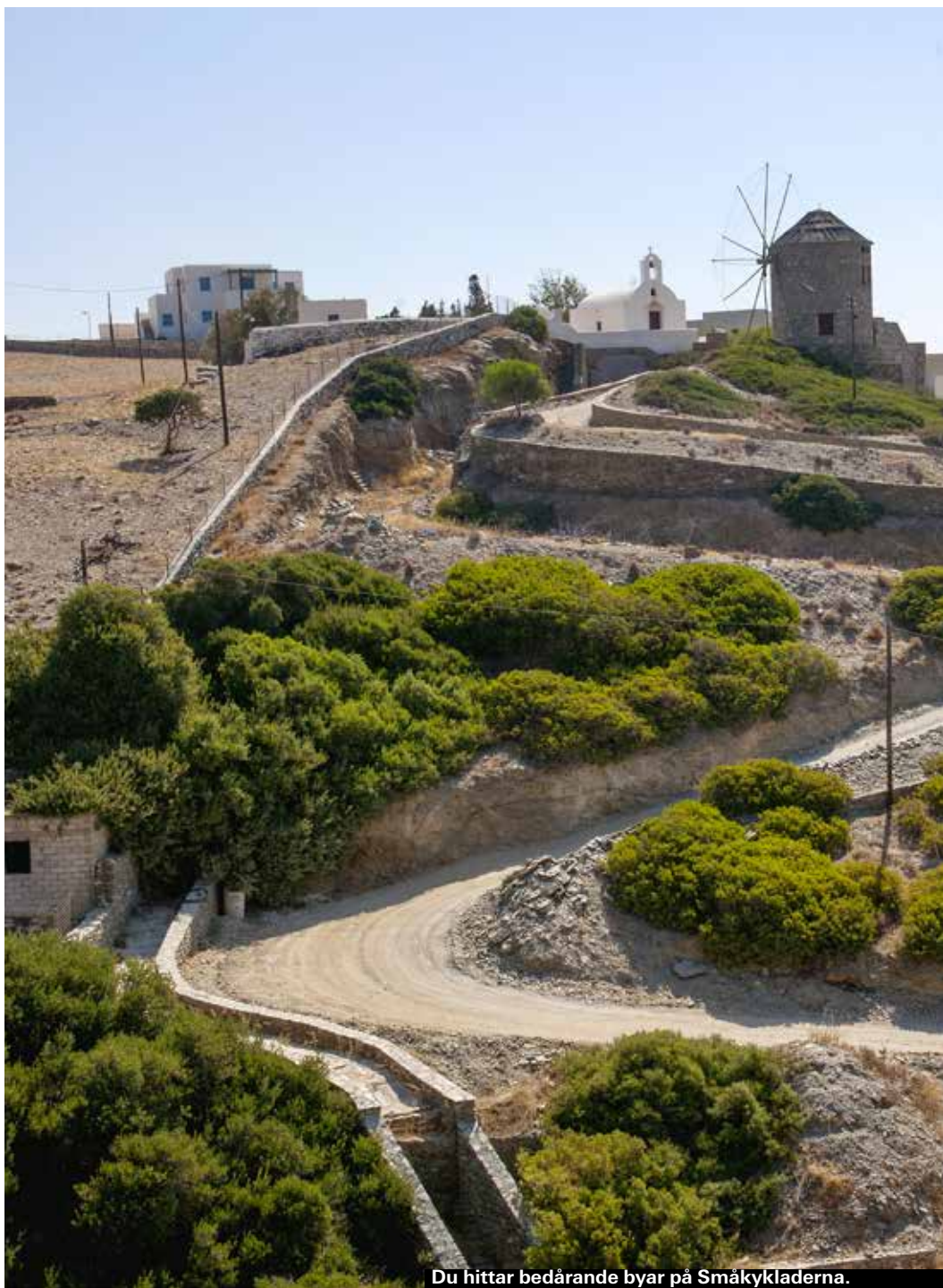
Du hittar bedårande byar på Småkykladerna.