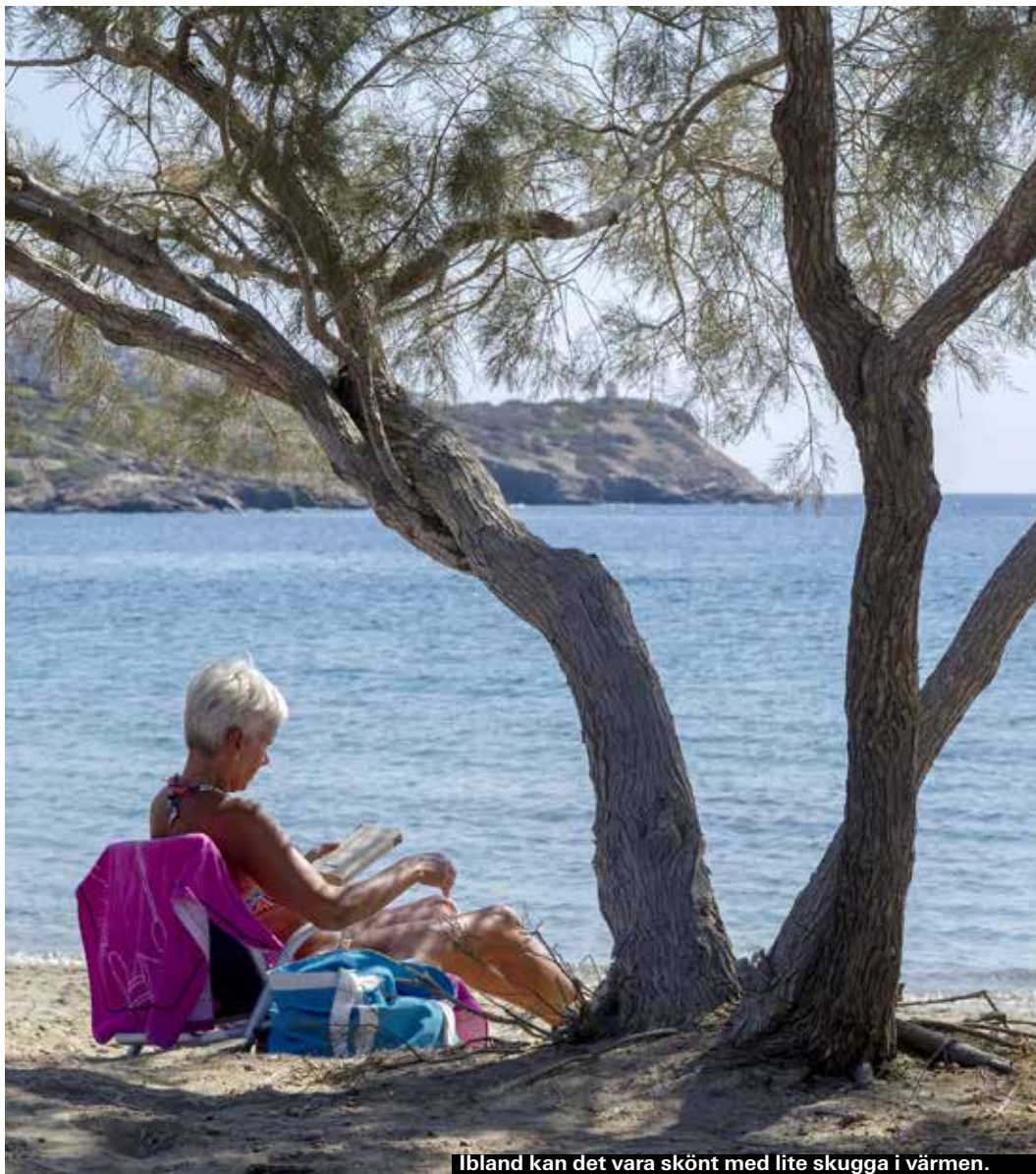
Ibland kan det vara skönt med lite skugga i värmen.