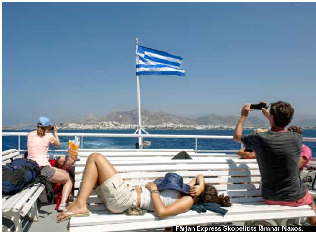
Färjan Express Skopelitits lämnar Naxos.

Bagagehanteringen ombord på båtarna är inte den mest var samma, så packa i en stryktålig rullväska eller en ryggsäck. Räkna med att du kan behöva gå en bit med bagaget, så packa inte mer än du orkar bära.