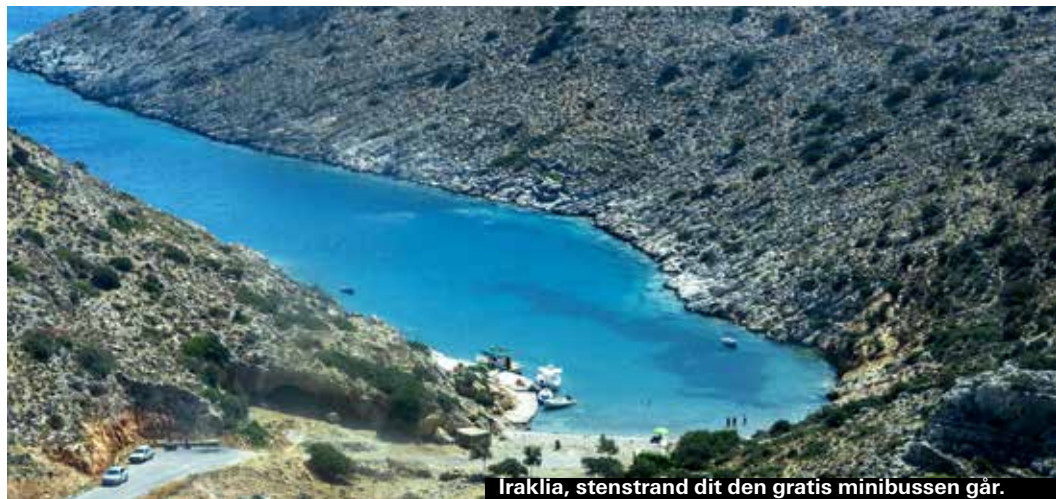
Iraklia, stenstrand dit den gratis minibussen går.

Lämningar av civilisation har hittats så långt tillbaka som 3200 år före Kristus, det vill säga långt före den så kallade Minoiska civilisationen på Kreta. Senare användes öarna av romarna, för att sedan bli tillhåll för pirater under den bysantiska eran. Öarna befolkades åter, främst av fåraherdar från Amorgos, under 1700-talet.