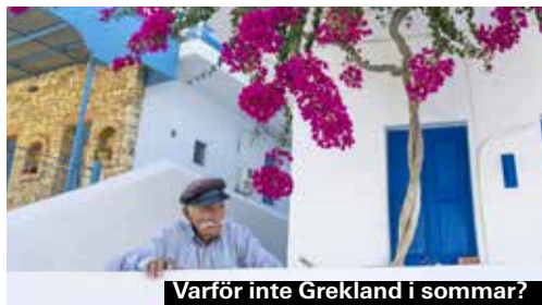
Varför inte Grekland i sommar?

Här får du en bra engelskspråkig resguide över hela ögruppen Kykladerna, och med med en stor