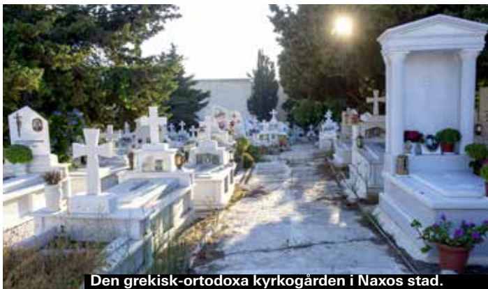
Den grekisk-ortodoxa kyrkogården i Naxos stad.

Öarna i Småkykladerna är några av Greklands minst bebodda öar, och endast Koufounissi, Iraklia, Shinoussa och Donoussa är bebodda. Endast ett hundra-