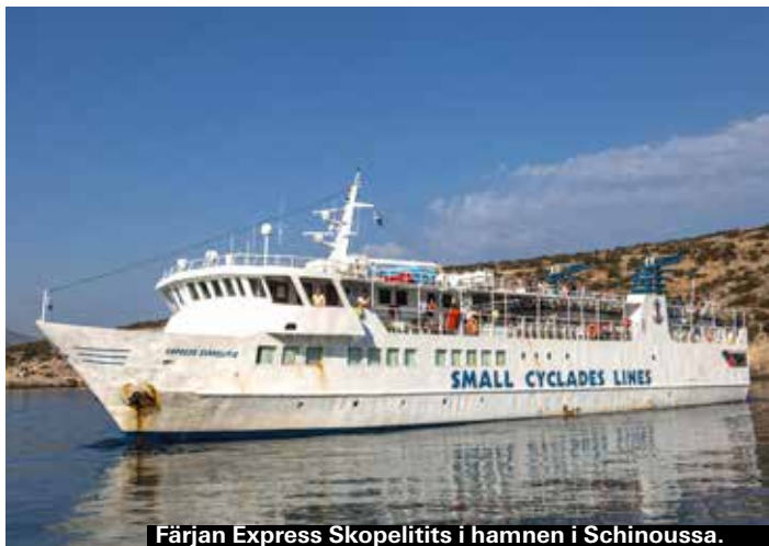
Färjan Express Skopelitis i hamnen i Schinoussa.

att ta The Small Cyclades Line från Naxos. Den lilla färjan Express Skopelitis går sex dagar i veckan från Naxos och trafikerar alla öarna i Småkykladerna. Biljettkontor finns på Naxos och alla öar, en enkelbiljett från Naxos till Koufonissi kostar 7 euro, billigare om man bara ska åka mellan öarna. Blue Star-färjor går från Naxos till vissa av öarna.