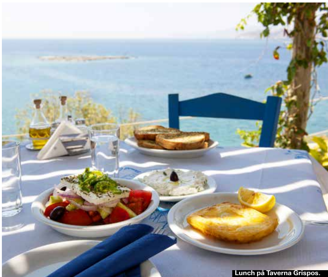
Lunch på Taverna Grispos.