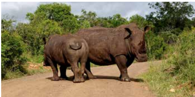
Noshörningarna finns fortfarande, tack vare Hluhluwe.

luwe, finns en bra restaurang och logi i flera olika prisklasser. De enklaste stugorna kostar 760 rand per natt för två. I den andra delen av reservatet, iMfolozi, finns Mpila Camp som har affär men ingen restaurang. Enklaste typen av logi kostar 770 rand per natt för två.