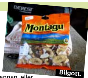
pannan, eller droppar från regnvåt kamera.

Jag har alltid med en halvstor, sliten handduk i bilen. Den fungerar som solskydd över rodnande ben, som dammskydd över kameran, till att torka solkrämskladdiga fingrar eller svett ur