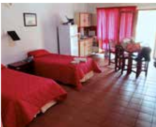
Både kök och badrum finns.