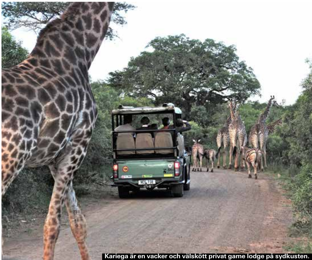
Kariega är en vacker och välskött privat game lodge på sydkusten.