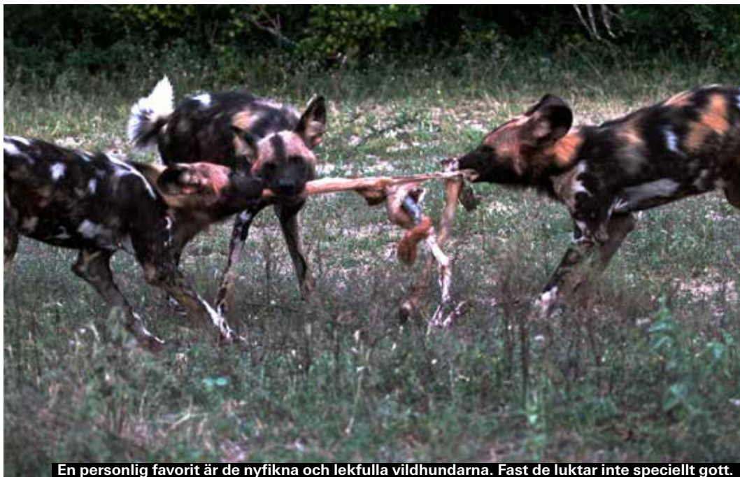
En personlig favorit är de nyfikna och lekfulla vildhundarna. Fast de luktar inte speciellt gott.

En av de nordligare camperna, med fina vägar utmed den mäktiga Letabafloden. Här finns också Krugers fina elefantmuseum, där man kan se (kopior av) några av världens största betar. Bo i stuga med badrum och kök för 965 rand per natt för två eller i safaritält för 485 rand.