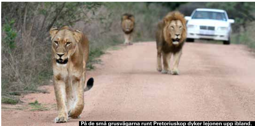
På de små grusvägarna runt Pretoriuskop dyker lejonerna upp ibland.

På vägen mellan campen Skukuza och Malelane gate ligger det lilla kaféet Afsaal. Sydafrikanerna föredrar att hyra en gasgrill och laga sin mat själva, men den ägg och bacon-frukost man kan köpa här smakar alldeles utmärkt – inte minst om man haft turen att se leopard eller lejon på vägen hit. Ibland sitter det en liten uggla i något av träden och om man inte aktar sig kommer en gulnäbbstoko (yellow hornbill) och stjälar maten.