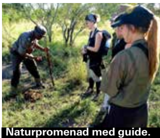
Naturpromenad med guide.

Många av camperna anordnar också "morning walk", då man ger sig av strax före gryningen tillsammans med två beväpnade guider och promenerar i måttlig takt genom naturen under några timmar. Ett underbart avbrott i