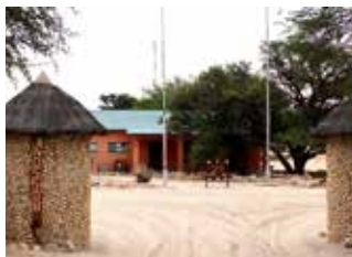
Nossob grindar stängs mot lejonerna så snart man kört in.

inhängnade och erbjuder viss service. Ungefär tre timmar från Twee Rivieren, på den östra vägen som följer Nossobflodens fåra. Området är känt för sina stora lejonflockar, som ibland faller byten alldeles utanför campen. 18 stugor, 20 campingplatser, ungefär samma priser och samma standard som i Mata-Mata.