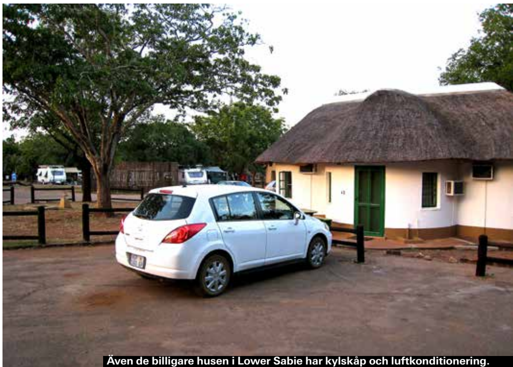
Även de billigare husen i Lower Sabie har kylskåp och luftkonditionering.