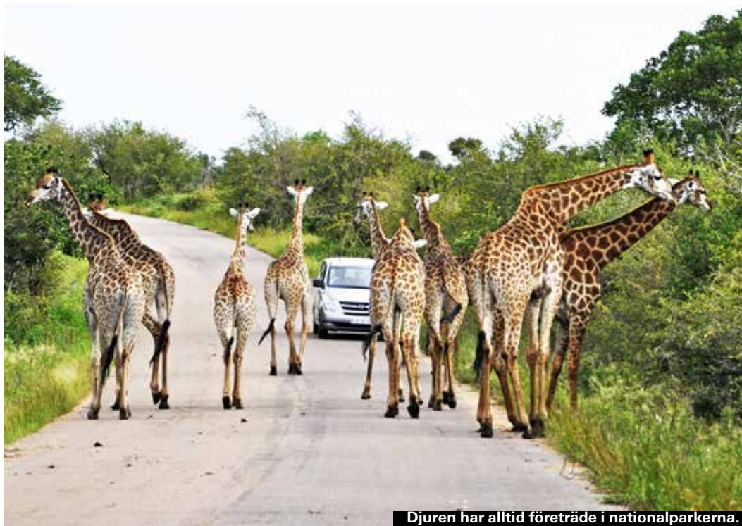
Djuren har alltid företräde i nationalparkerna.