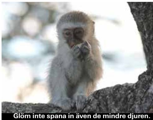
Glöm inte spana in även de mindre djuren.

Allting händer inte genast. Men förr eller senare dyker nog de upp, de där djuren du längtar efter. Ge inte upp!