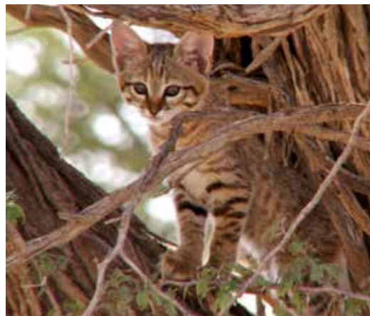
Vildhundar och vildkatter (ovan) är mycket svårare att hitta än flodhästar och antiloper (nedan).