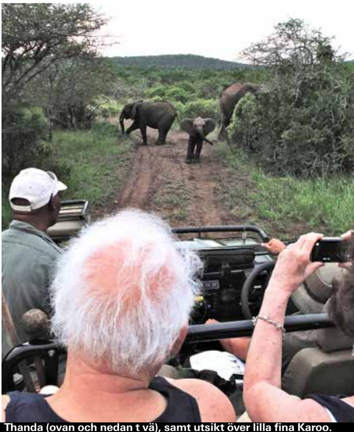
Thanda (ovan och nedan t vä), samt utsikt över lilla fina Karoo.