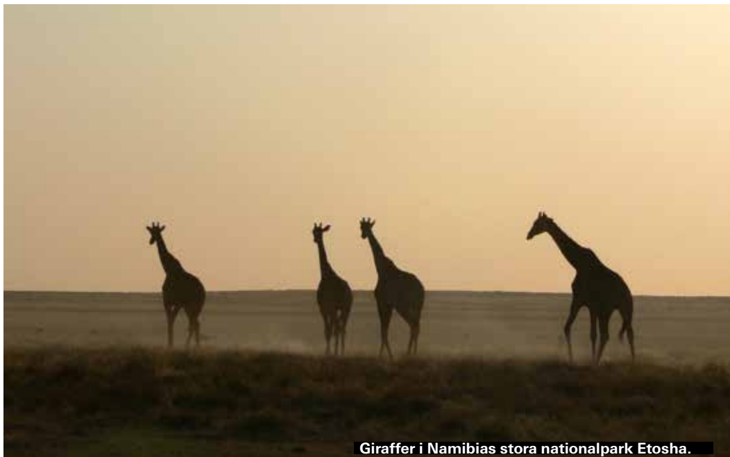
Giraffer i Namibias stora nationalpark Etosha.