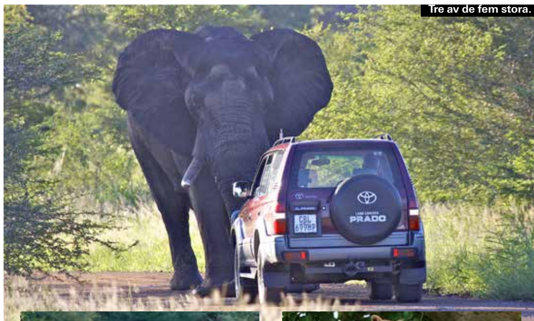
Tre av de fem stora.

De vackra kattdjuren är för många höjdpunkten på en safari. Lejon är relativt lätta att få syn på, de är helt orädda för bilar, ligger mest still och uppträder ofta i flockar på upp till 25 djur. Leoparderna är mycket skyggare och lever oftast ensamma.