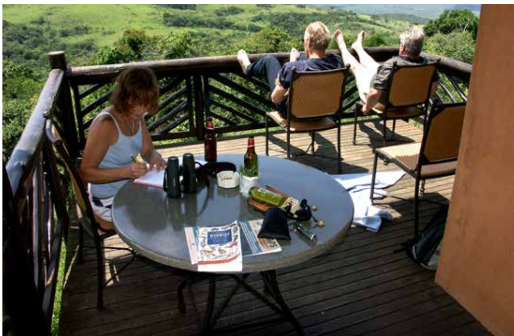
Från balkongen på flera av stugorna i Hluhluwe Main Camp kan man se djuren ströva omkring.