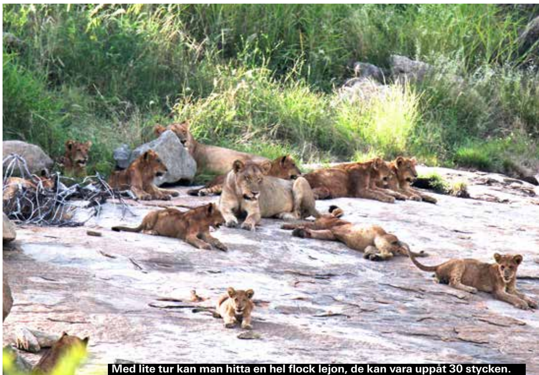
Med lite tur kan man hitta en hel flock lejon, de kan vara uppåt 30 stycken.