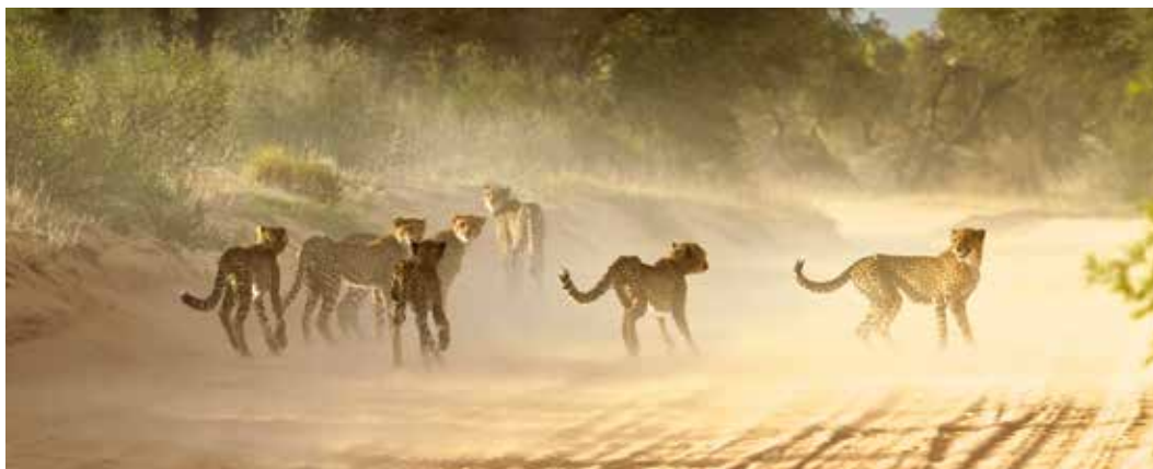
Strax söder om Mata Mata möter man ofta geparder, men sällan så många som sju samtidigt.