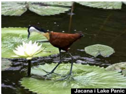
Jacana i Lake Panic

Även om man bara har tänkt köra en kort tur före frukost så kanske man blir stående i timmar vid en flock lekfulla lejon. Ta alltid med mycket, mycket mer dricksvatten än ni tror ska gå åt.