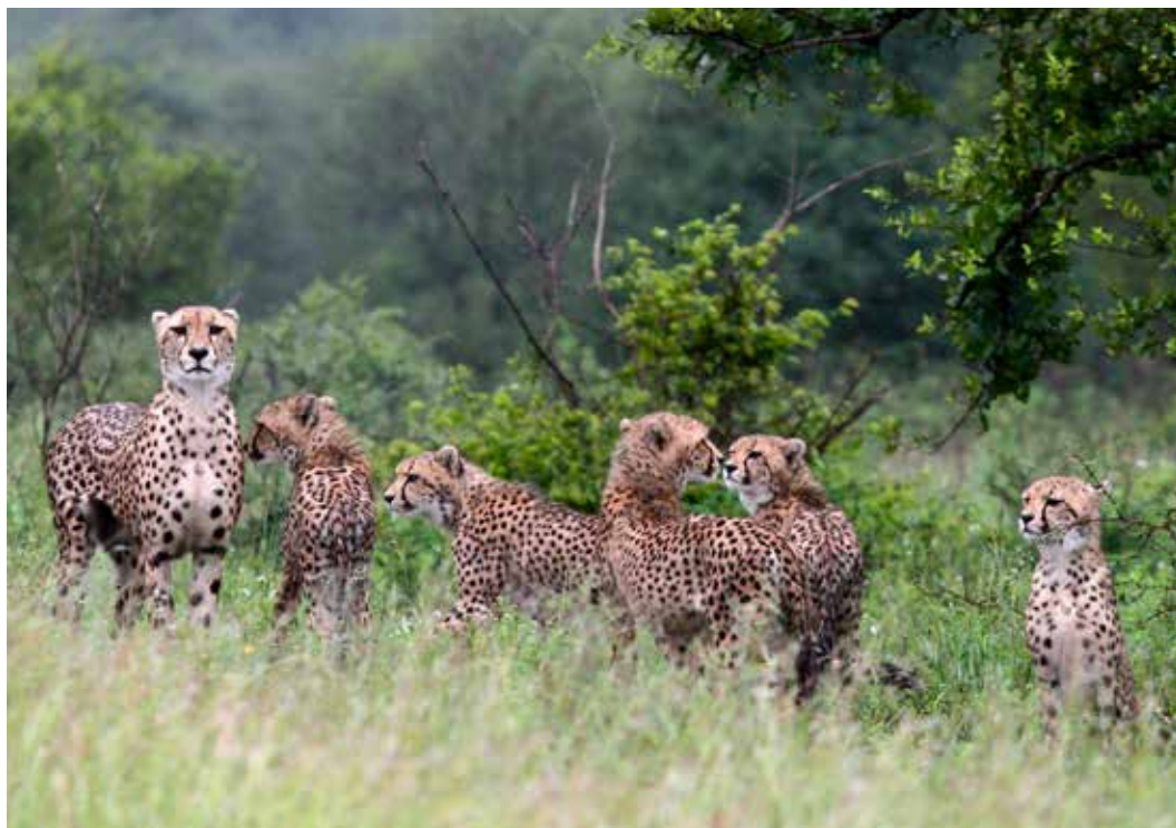
Både väg H6 och den mer kända S100, inte långt från Satara, är bra ställen för att se gepard.

Kanske den mest omtalade vägen i Kruger, känd för den stora chansen att se lejon och gepard. Kör från Satara, fortsatt till höger på S41 när S100 tar slut, och sväng sedan upp på asfaltvägen H6. På de båda senare vägarna har jag haft minst lika många fantastiska möten med de stora katterna som på själva S100.