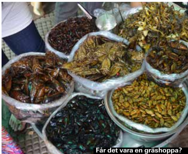
Får det vara en gräshoppa?

Kdam caa är friterad krabba som serveras med lokal, grön paprika. Ang dtray-meuk är grillad bläckfisk som har marinerats i limesås. Bläckfisken grillas och serveras gärna med sås gjord på prahoc. Räkorna är ofta stora och lokala från Mekongfloden, men de kan smaka en aning av dy.