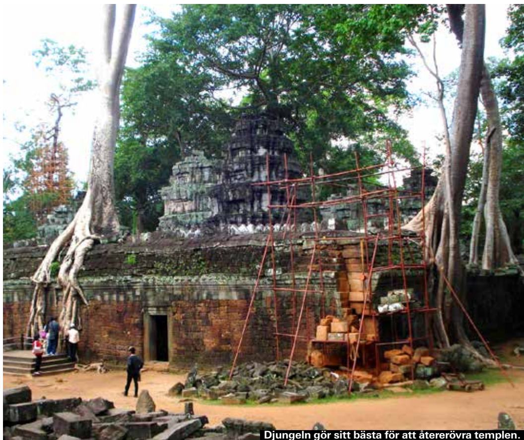
Djungeln gör sitt bästa för att återerövra templen.