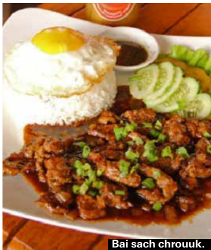
Bai sach chrouuk.