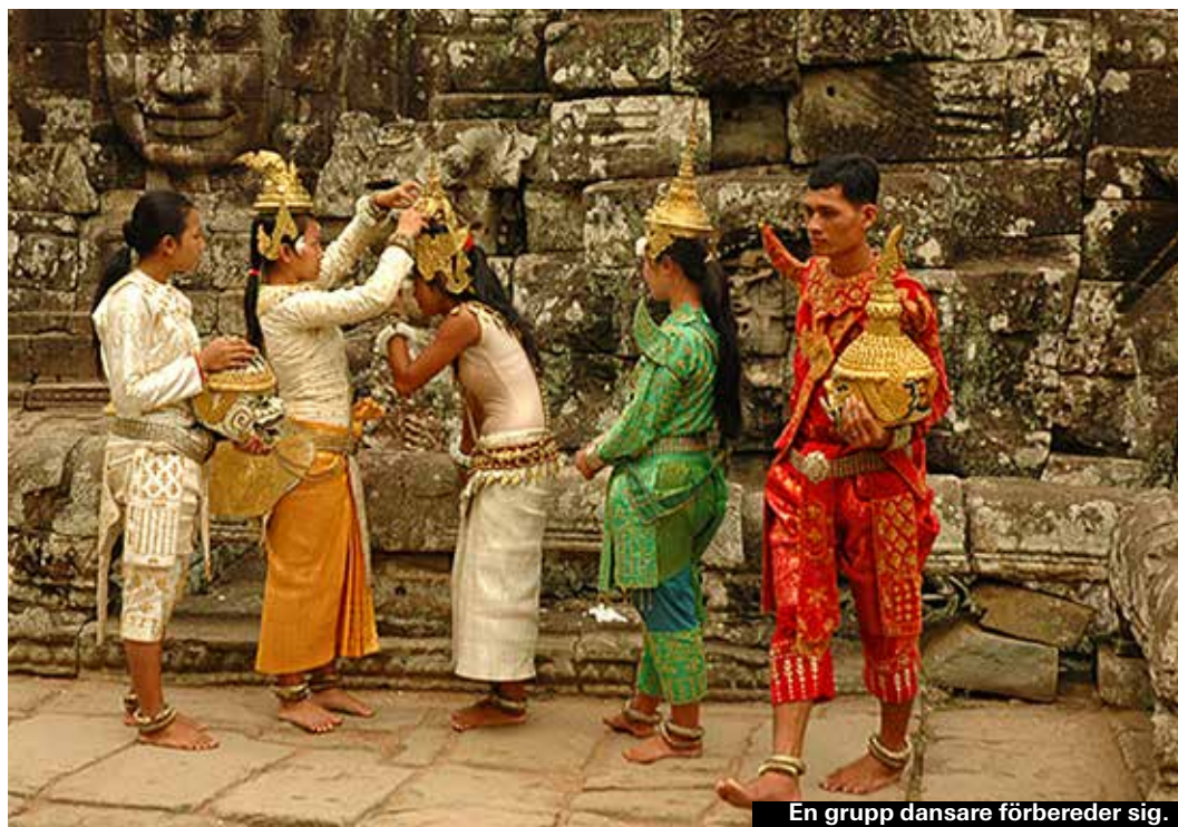
En grupp dansare förbereder sig.