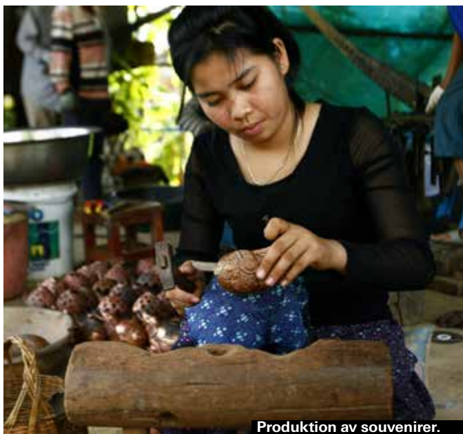
Produktion av souvenirer.

Ta med dig ditt favoritplagg och gå till en av de många skräddare som finns. Där kan du välja tyg och få ytterligare ett exemplar av just ditt plagg. Det går på en dag eller två och ditt nya plagg levereras direkt till hotellet.