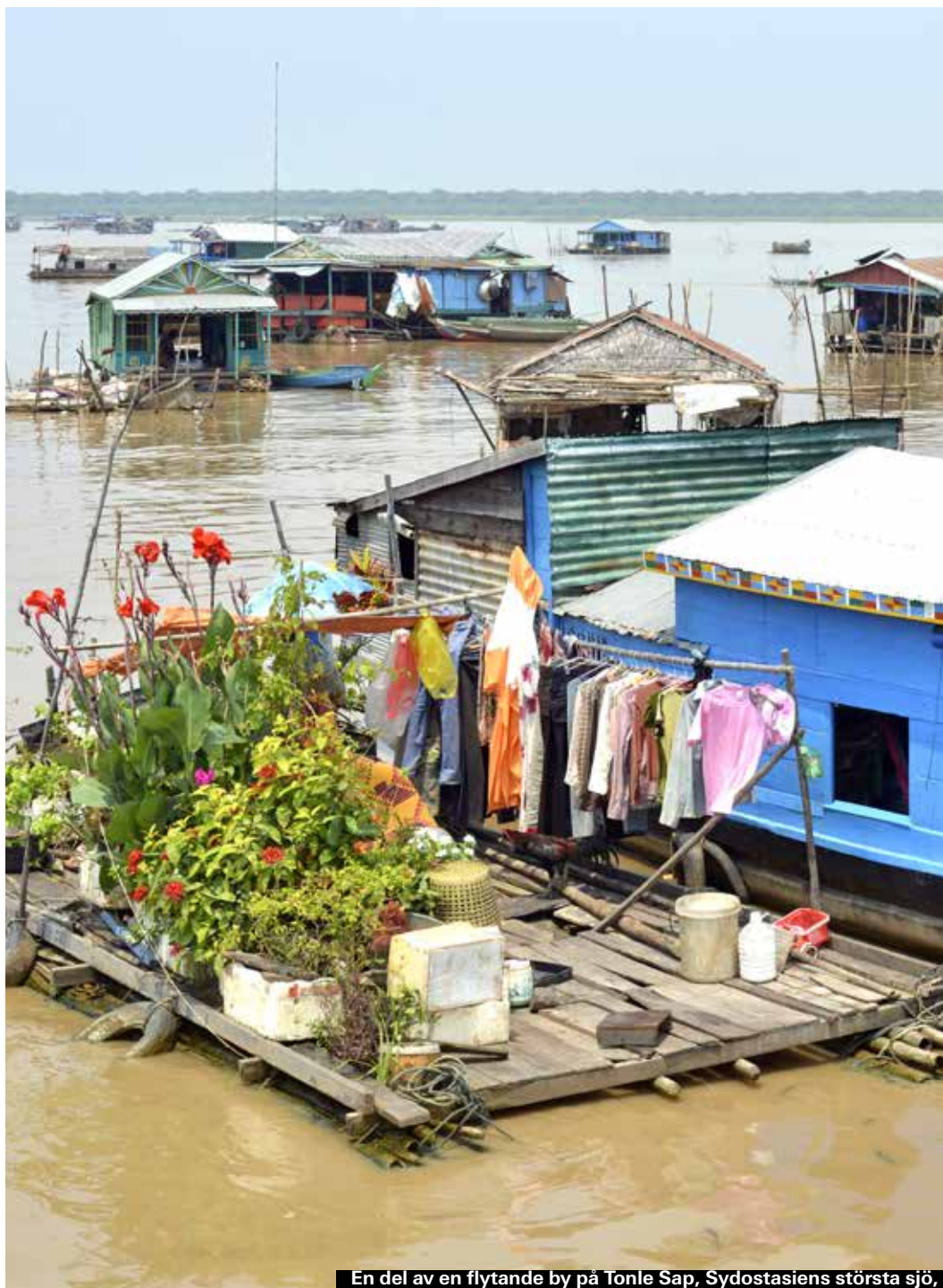
En del av en flytande by på Tonle Sap, Sydostasiens största sjö,