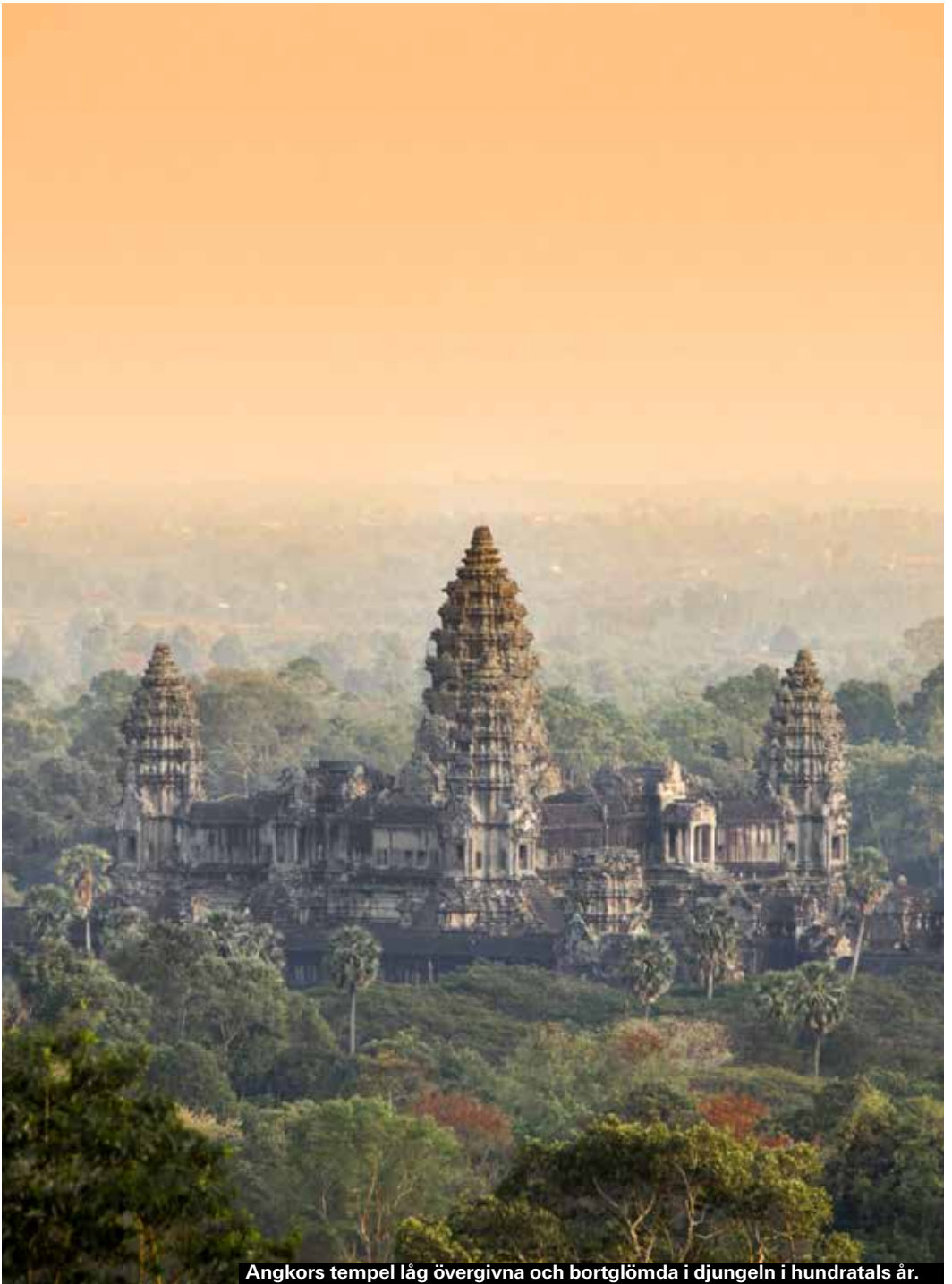
Angkors tempel låg övergivna och bortglömda i djungeln i hundratals år.