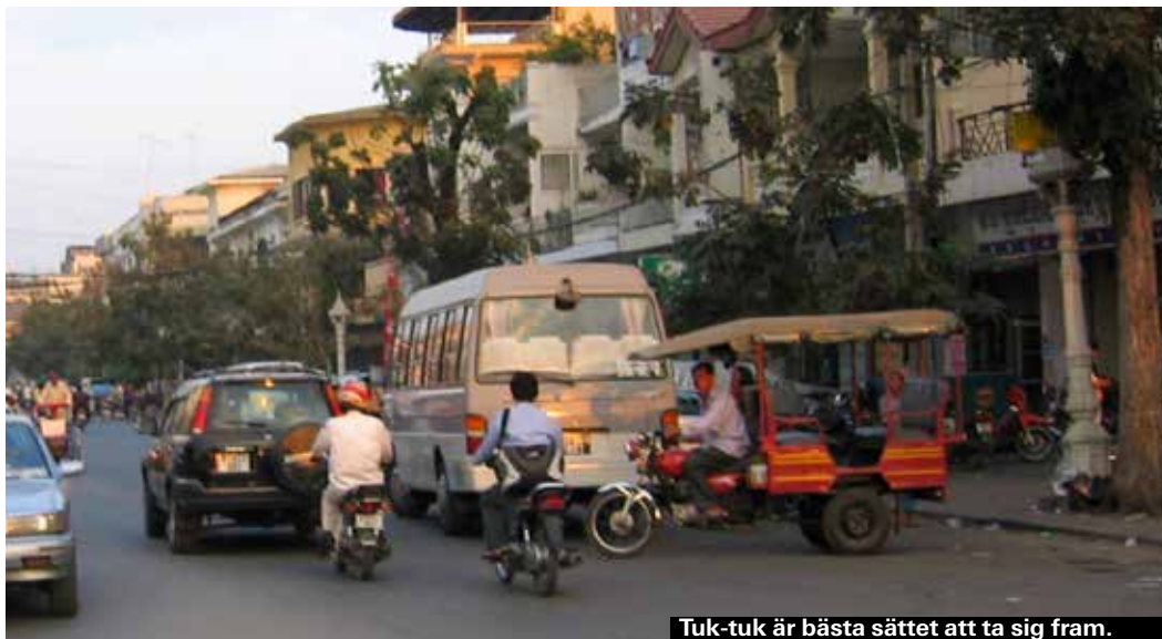
Tuk-tuk är bästa sättet att ta sig fram.