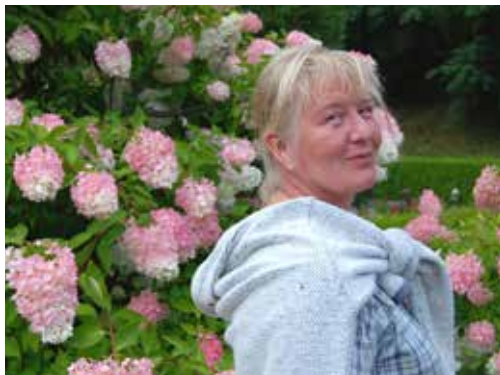
Text & foto: KATARINA ARVIDSON

Turism är en av de viktigaste inkomstkällorna i landet. Varje år kommer fler och fler för att upptäcka variationen i landet. Vare sig du är ute efter sol och bad eller kultur och historia är Kambodja rätt destination för dig.