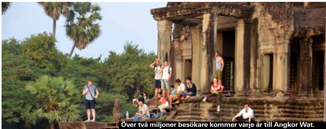
Över två miljoner besökare kommer varje år till Angkor Wat.

■ Sedan 1992 står Angkor på Unescos världsarvslista, och i dag pågår ett omfattande restaureringsarbete av ruinerna för att rädda den även för framtida generationer.