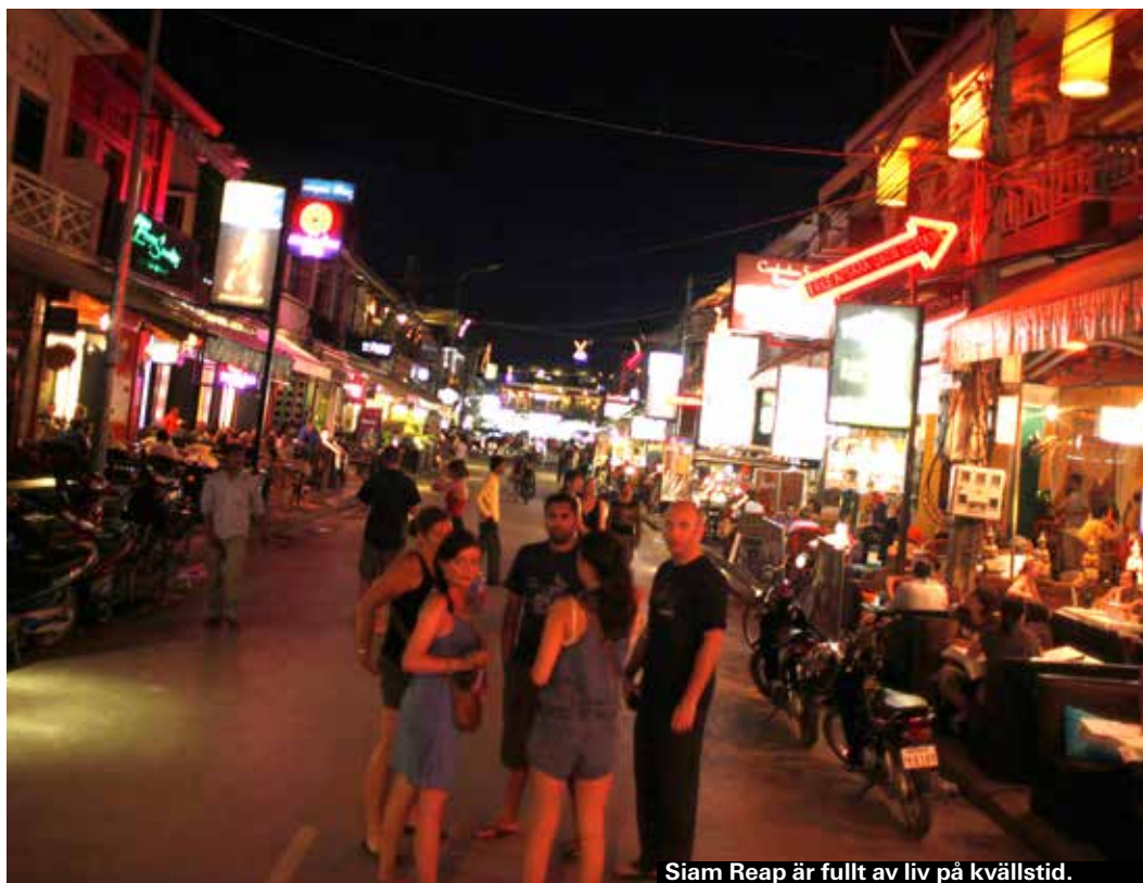
Siam Reap är fullt av liv på kvällstid.

På kvällen vaknar Siam Reap till liv. Kaféer, restauranger, barer och en oändlig räckva av massageshopar och fisktankar. Testa fisktank där importerade japanska sötvattensfiskar gnager bort dött skinn på fossingarna. 20 minuter och du har fötter som en debis. Kostar cirka 3 US-dollar och då ingår en dricka. Fotmassage gör dunder för trötta ben. En halvtimme kostar cirka 5 US-dollar. Ta en promenad runt om i staden, åt gott och kanske ett besök på ett kafé innan det är dags för John Blund.