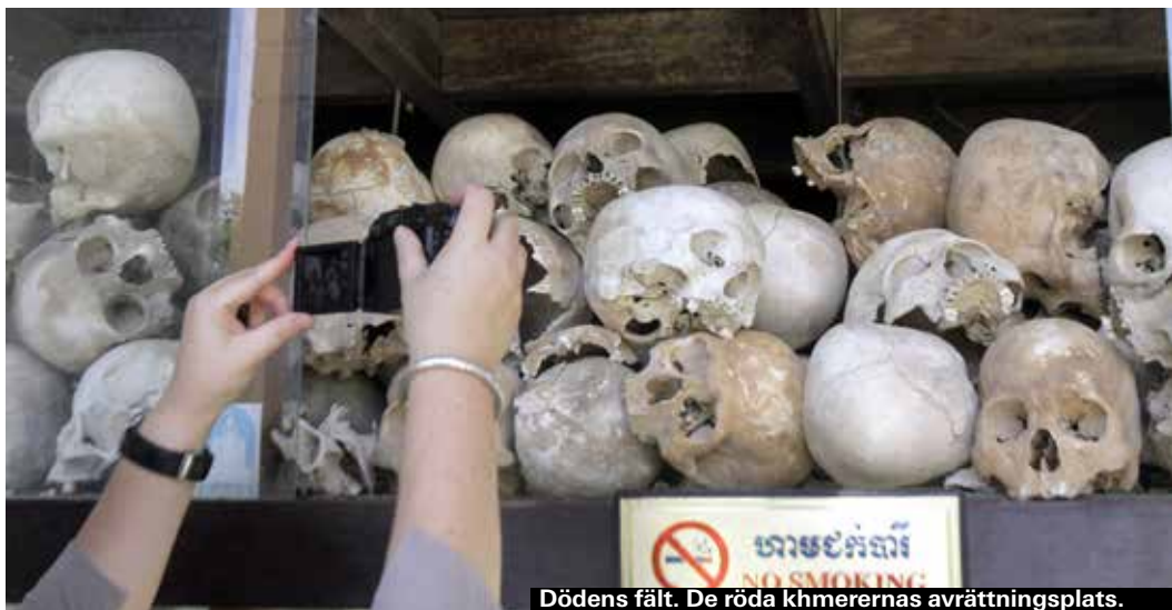
Dödens fält. De röda khmerernas avrättningsplats.