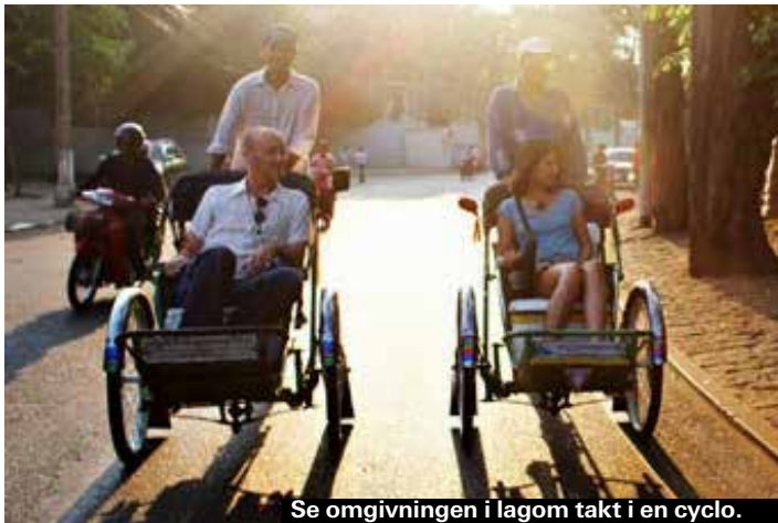
Se omgivningen i lagom takt i en cyclo.

Street 278 är en av de bästa gatorna både dag- och kväll. På dagtid med kaféer och kvällstid har du ett stort och bra urval av restauranger.