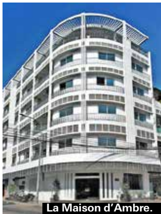
La Maison d'Ambre.

Femstjärniga Raffles hotel Le Royal är ett kolonialarv som har