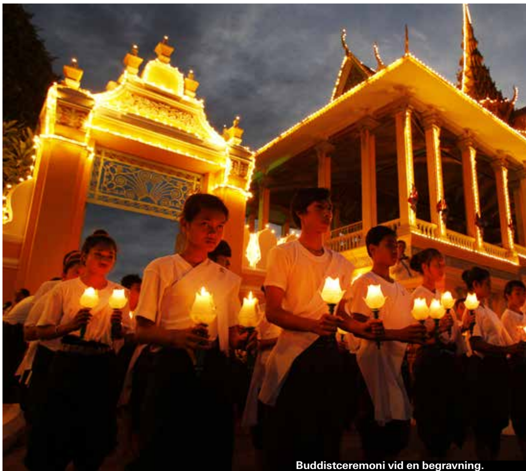
Buddistceremoni vid en begravning.