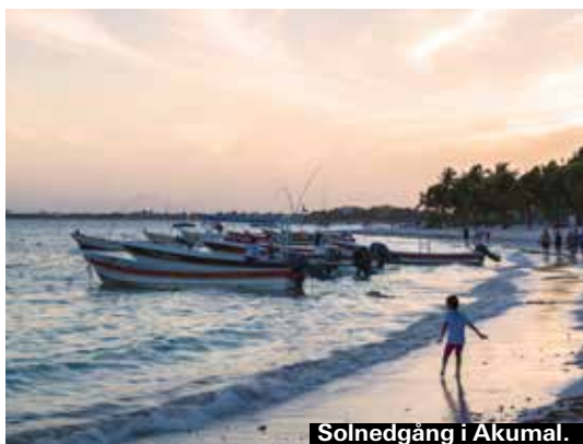
Solnedgång i Akumal.