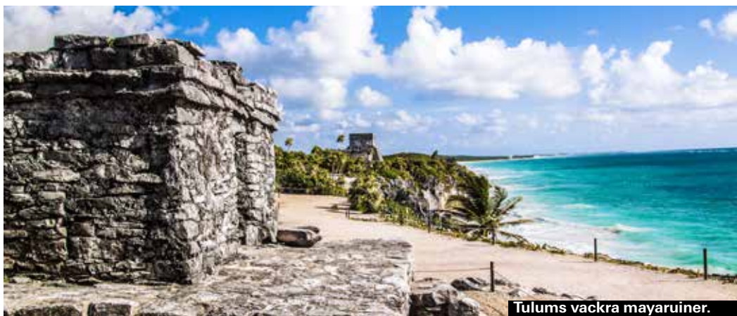
Tulums vackra mayaruiner.

12 timmars bussresa från Cancún men väl värt det om man är intresserad av mayariket. Några av mayarikets mest uppskattade ruiner mitt inne i djungeln.