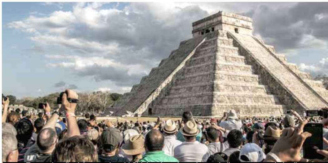
Tusentals människor samlas vid Chichen Itzas huvudtempel när ormen syns hela vägen upp.

Amerikanarnas semesterperiod nummer ett. Åk hit om du vill uppleva amerikanska ungdomar som festar JÄRNET. Åk INTE hit den här tiden om du vill ha lugn och ro. Spring break inträffar i mars-april.