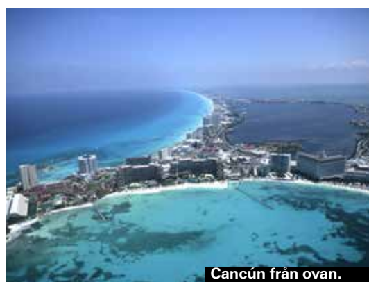
Cancún från ovan.