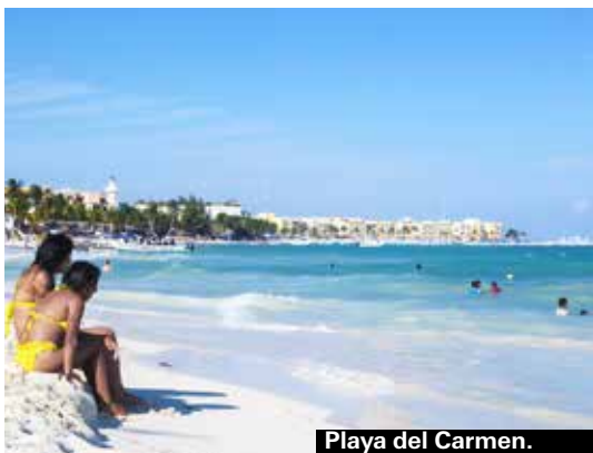
Playa del Carmen.