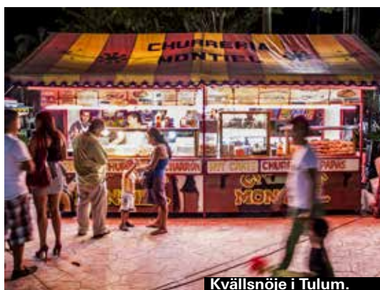
Kvällsnöje i Tulum.