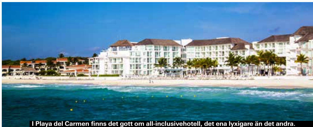
I Playa del Carmen finns det gott om all-inclusivehotell, det ena lyxigare än det andra.

► Playa Maroma, Playa del Carmen ► www.secretsresorts.com