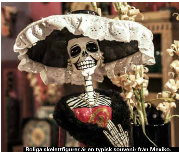
Roliga skelettfigurer är en typisk souvenir från Mexiko.

Den färggranna wrestlingluvan. Säljs överallt och är perfekt för framtida maskerader.