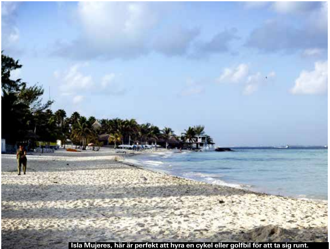
Isla Mujeres, här är perfekt att hyra en cykel eller golfbil för att ta sig runt.

Korallöar som bildar en atoll och även är ett biosfärreservat, cirka två timmar från Mahahual och Xcalak, nära gränsen till Belize. Riktiga Robinson-öar. Hit åker du för att dyka, minst nio skeppsvrak finns vid revet, däribland två spanska galeoner. Några fiskare bor på hus byggda på pålar i vattnet utanför revet, men på land är det inte tillåtet att bo. Man måste ha tillstånd för att åka hit, vilket dykcenter brukar kunna ordna.