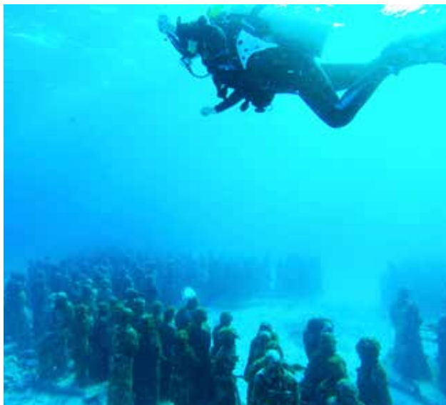
Ett speciellt och coolt museum: MUSA i Cancún.