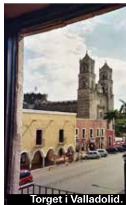
Torget i Valladolid.