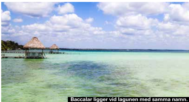
Baccalar ligger vid lagunen med samma namn.

Fantastiskt fin vit, milslång strand. Perfekt för långa strandpromenader. Inte alls så stökigt och trångt som i delar av Playa del Carmen, så åk hellre hit om det är sol och bad du är ute efter.