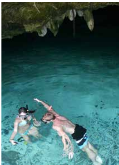
Grand Cenote, snorkel-höjdare.

Dyk i en cenote, underjordiska färskvattensgångar/undervattensgrottorna som är typiska för Yucatanhalvön. Ordet cenote kommer från mayaspråket dznot som betyder vattenöga, för maya-indianerna var det en livsviktig källa till rent vatten. Se eget kapitel för tips på var du ska dyka för bästa upplevelsen.