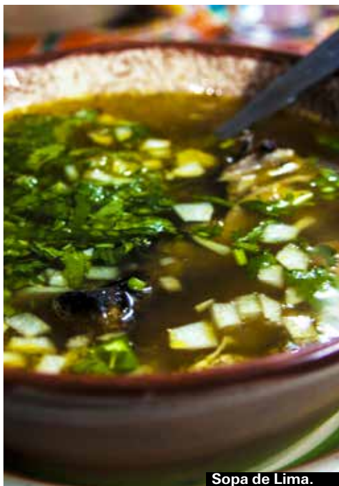
Sopa de Lima.

Som ett mellanting mellan en ångkokt burrito och quesadilla. Serveras ofta i ett banan- eller majscolvsblad.