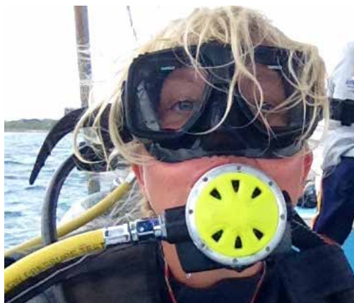
Text och foto: LINDA LINNEA LARSSON

Längs Riviera Maya finns på riktigt verkligen något för alla, och stannar gör man så länge budgeten (eller chefen) tillåter. För åka härifrån, det vill man inte.