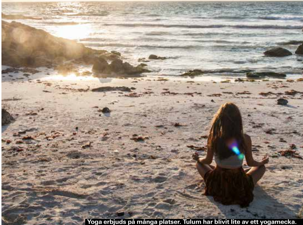
Yoga erbjuds på många platser. Tulum har blivit lite av ett yogamecka.

► Mellan Av. 5 och Av 3, Calle 36, Bacalar