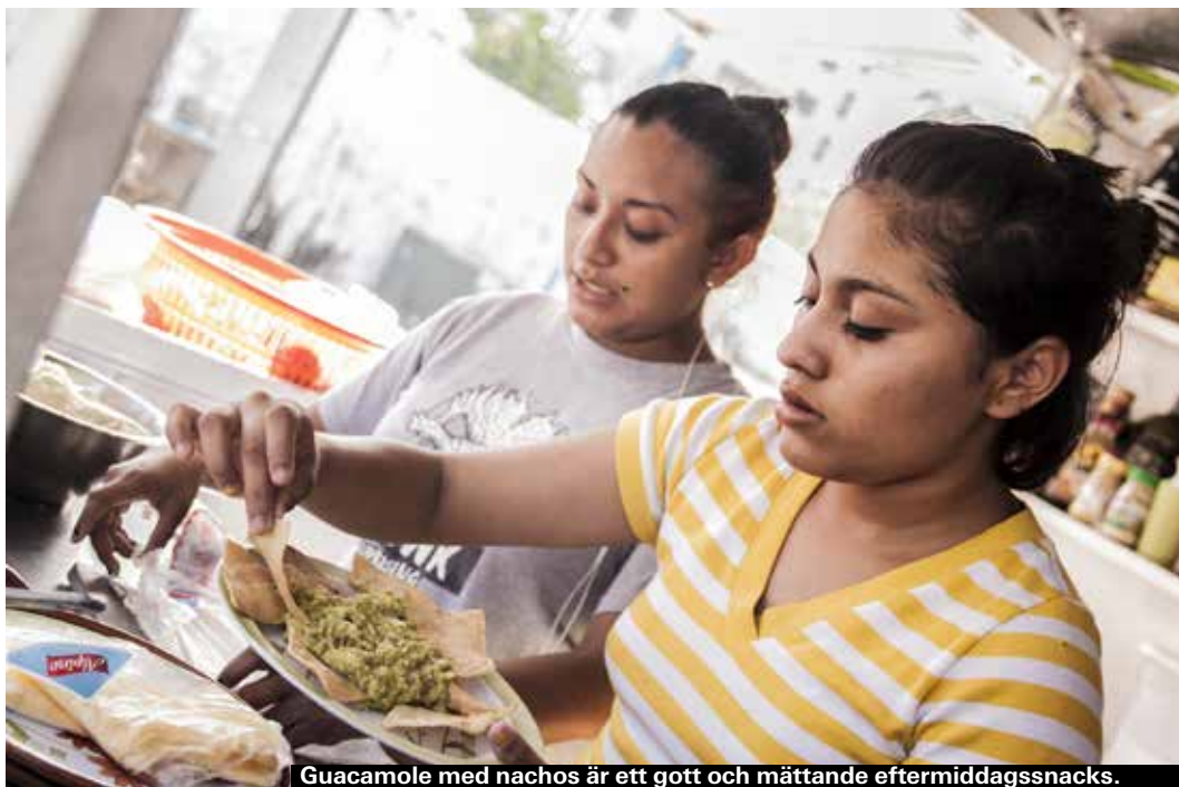
Guacamole med nachos är ett gott och mättande eftermiddagsnacks.

Som ett litet pajska av majsmjöl, toppat med bönor och olika fyllningar.