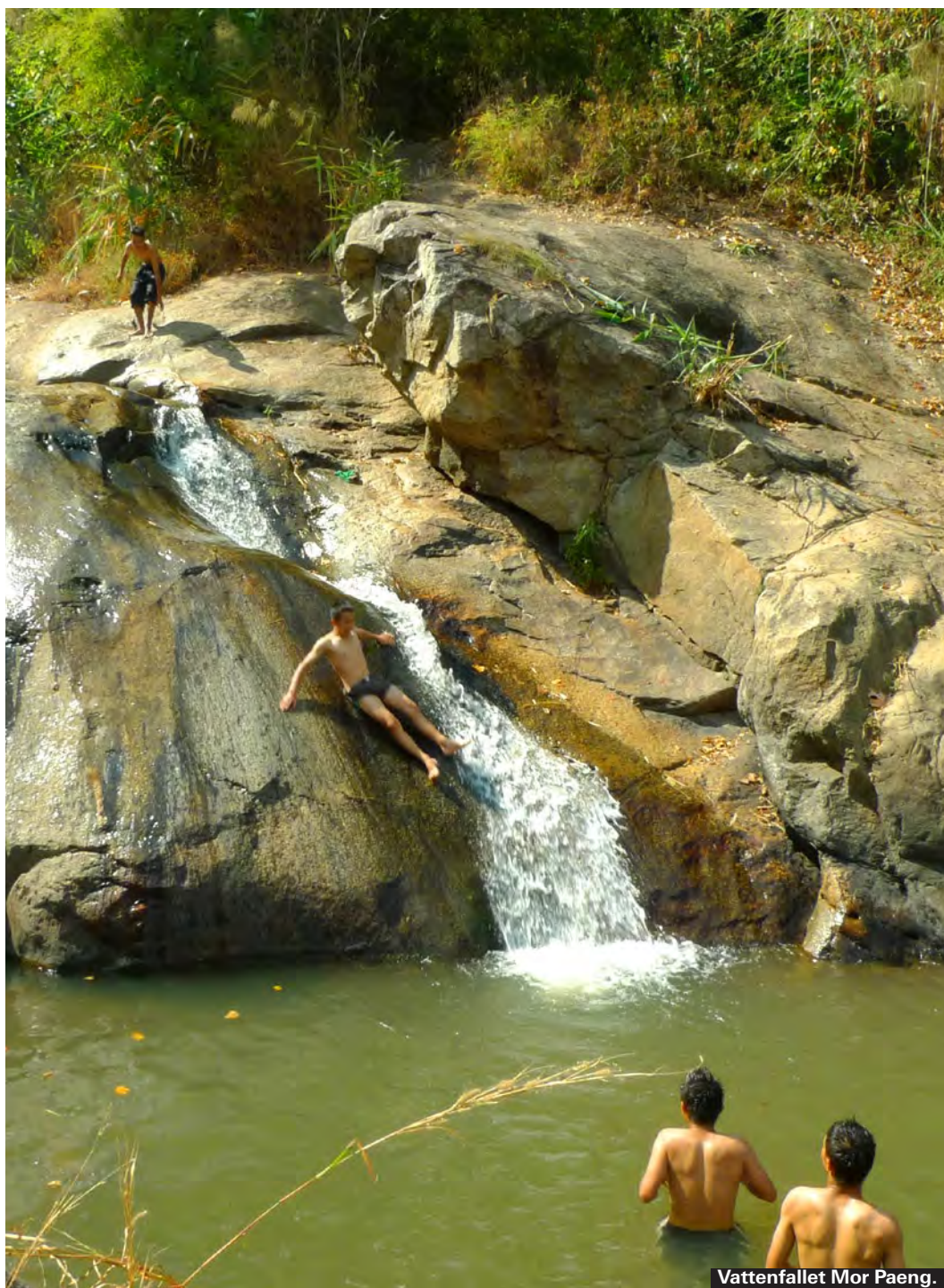
Vattenfallet Mor Paeng.