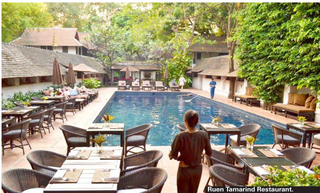
Ruen Tamarind Restaurant.