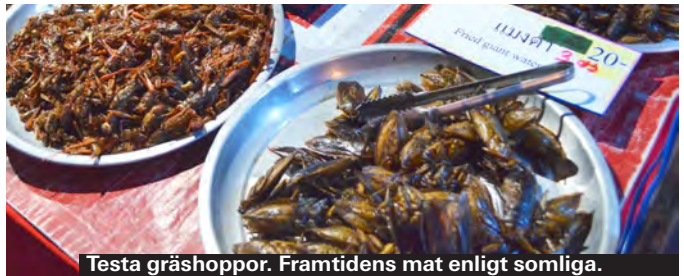
Testa gräshoppor. Framtidens mat enligt somliga.

För trendigare shopping är Nimmanhaemin Road, 2 km väster