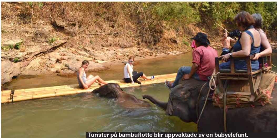
Turister på bambuflotte blir uppvaktade av en babyelefant.