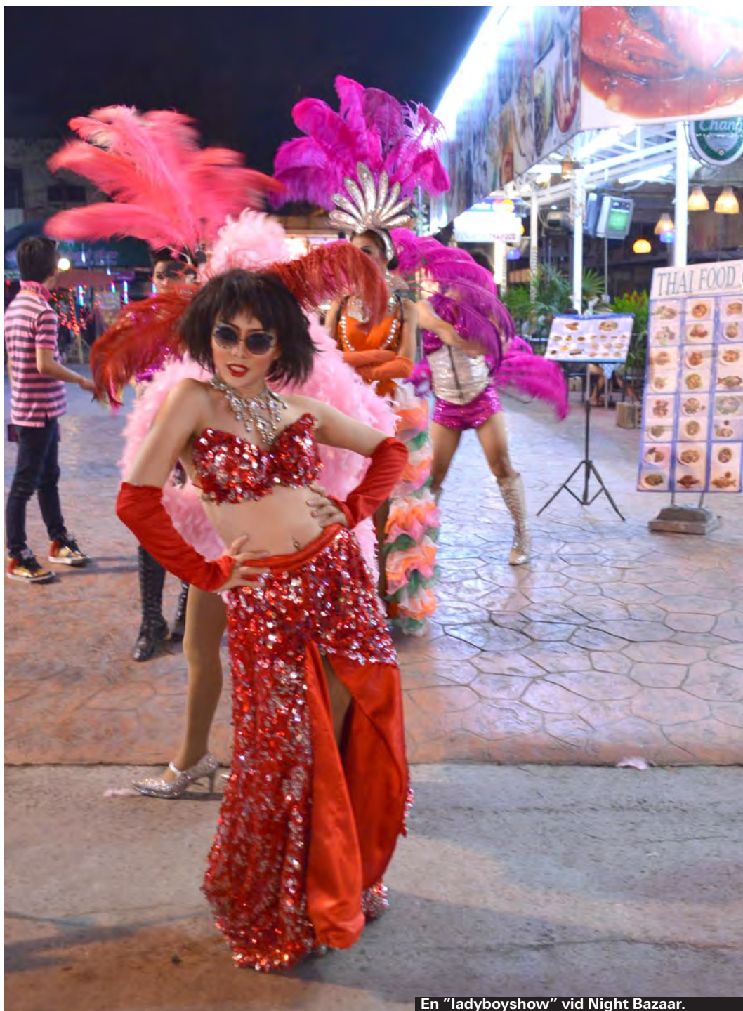
En "ladyboyshow" vid Night Bazaar.