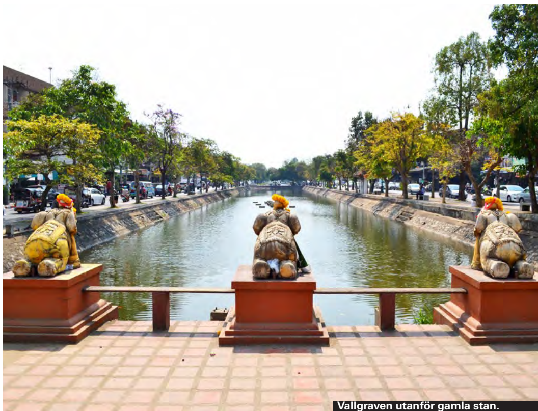
Vallgraven utanför gamla stan.