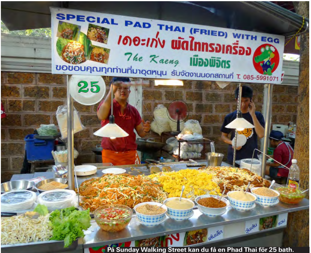
På Sunday Walking Street kan du få en Phad Thai för 25 bath.