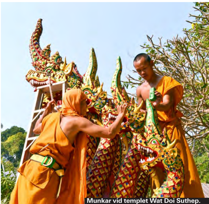
Munkar vid templet Wat Doi Suthep.

Templet Wat Doi Suthep, 1,5 mil utanför stan, är Chiang Mais allra största turistmål. Det är även ett av norra Thailands heligaste tempel så även thailändare vallfärdar hit. Med sitt läge på toppen av berget Doi Suthep är utsikten mot Chiang Mai en del av upplevelsen. Det går att hyra en tuktuk som väntar för 400–500 baht, eller ta en songthaew utanför Chang Phuak Gate, alltså den norra porten, för 80–100 baht/person. Räkna med två timmar inklusive resa och sightseeing. Framme flockas försäljare nedanför de 306 trappsteg som tar dig sista biten. Turister betalar 30 baht inträde. Här finns flera tempelbyggnader och meditationsrum att kika in i. Ta med några baht för att få tända ljus el-