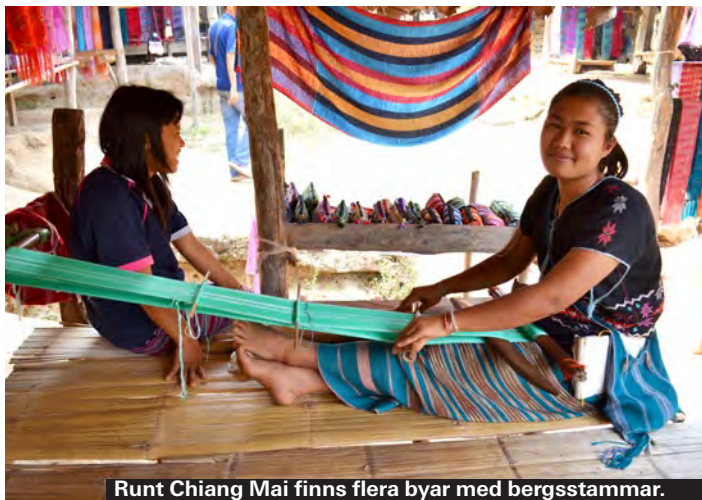
Runt Chiang Mai finns flera byar med bergsstammar.

Du kan också välja att flyga till enbart Bangkok och ta dig vidare med buss eller inrikesflyg. Norwegian flyger dig direkt från Stockholm.