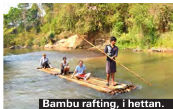
Bambu rafting, i hettan.