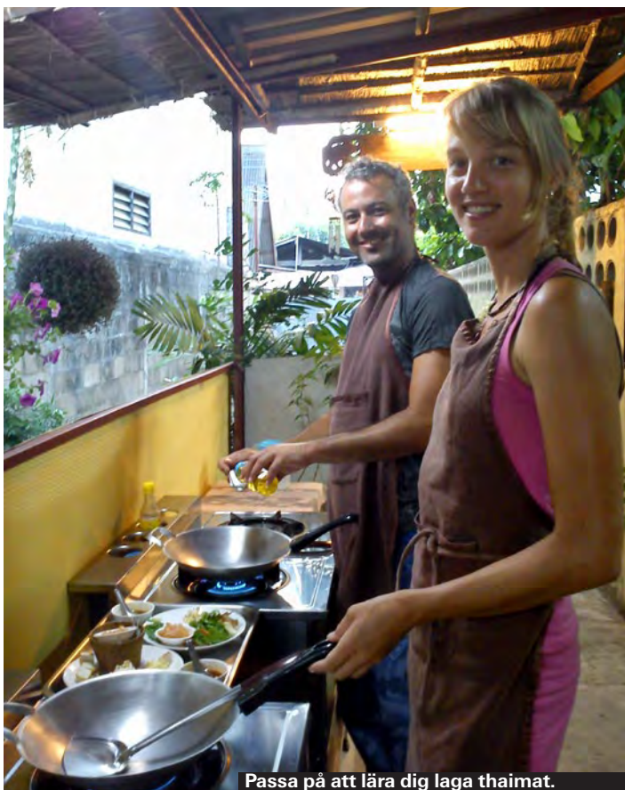
Passa på att lära dig laga thaimat.

Du kan lära dig läderarbete, att göra smycken eller jobba i trä under en eller flera dagar. Genom