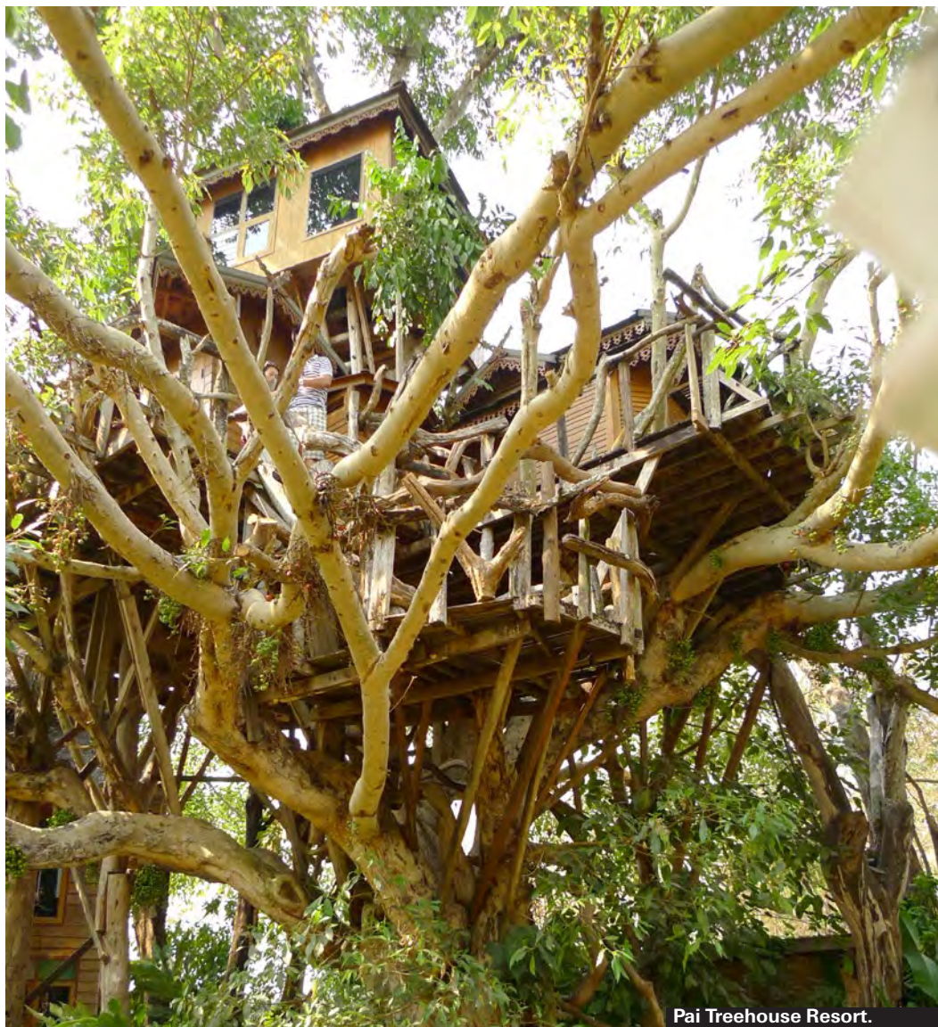
Pai Treehouse Resort.