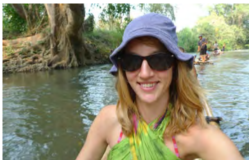
Text & foto: LOTTA ZACHRISSON

Chiang Mai är helt klart rätt plats för den som vill uppleva något mer genuint thailändskt, och som gärna vill ha det i ett smidigt paket av både storstad och natur.