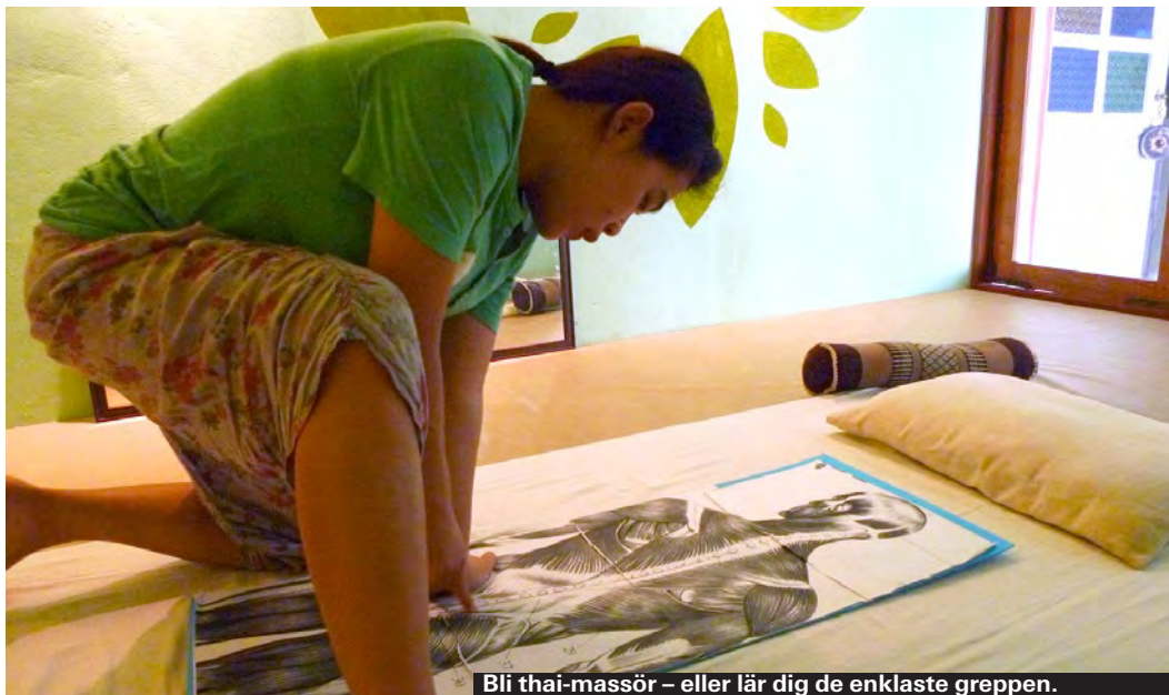
Bli thai-massör – eller lär dig de enklaste greppen.