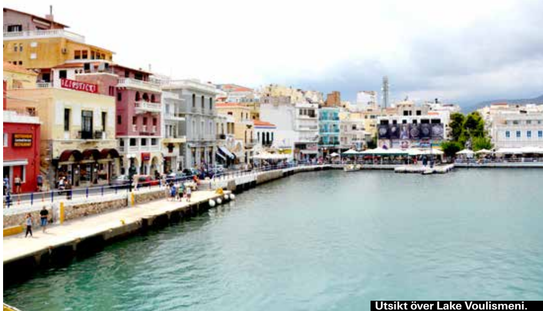
Utsikt över Lake Voulismeni.