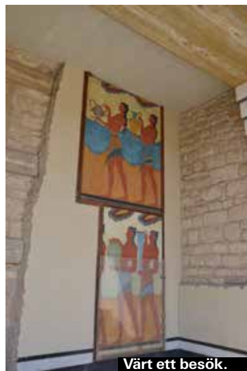
Värt ett besök.