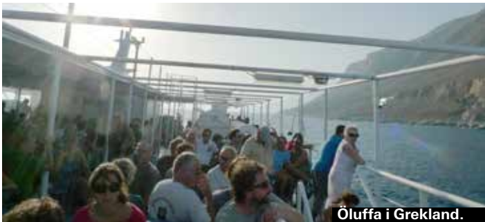
Öluffa i Grekland.