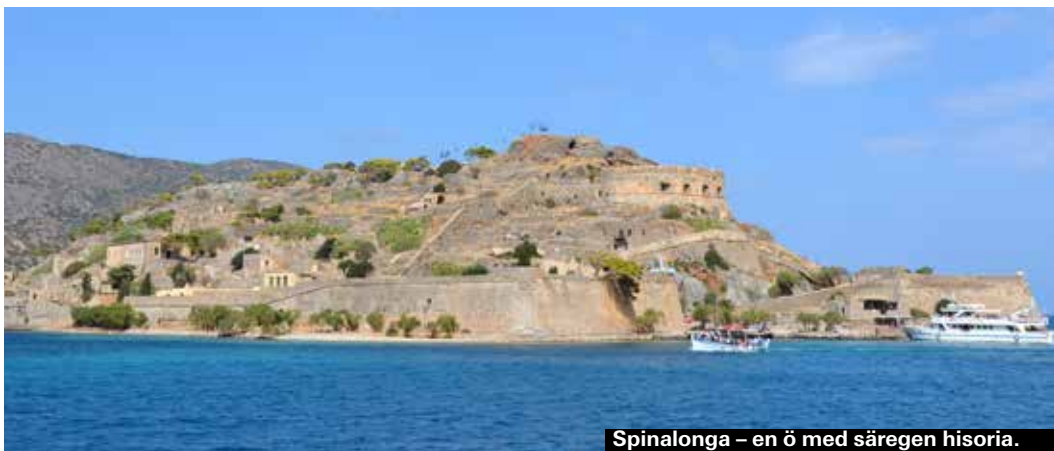
Spinalonga – en ö med säregen historia.

Spetälska går även under namnet lepra och Hansens sjukdom. Det är en infektionssjukdom som kan angripa huden och göra att den drabbade får ett deformerat utseende. Lepra kan botas med antibiotika, men det finns ändå i dag cirka 10 miljoner personer som är drabbade av sjukdomen, främst inom tropiska områden.