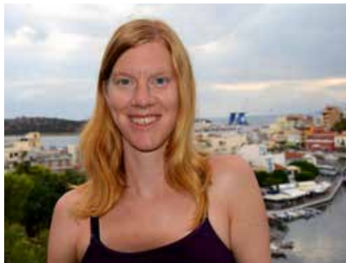
Text & foto: LISA OLSSON

Framför allt: Njut av semestern i det lugna, vänliga och vackra Agios Nikolaos.