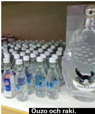
Ouzo och raki.

Det grekiska kaffet är starkt, gott, tjockt och sött. Ganska likt arabiskt kaffe. Det går att bestäl-