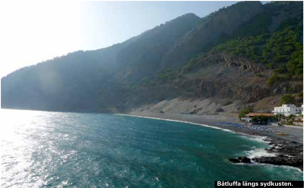
Båtuffa längs sydkusten.