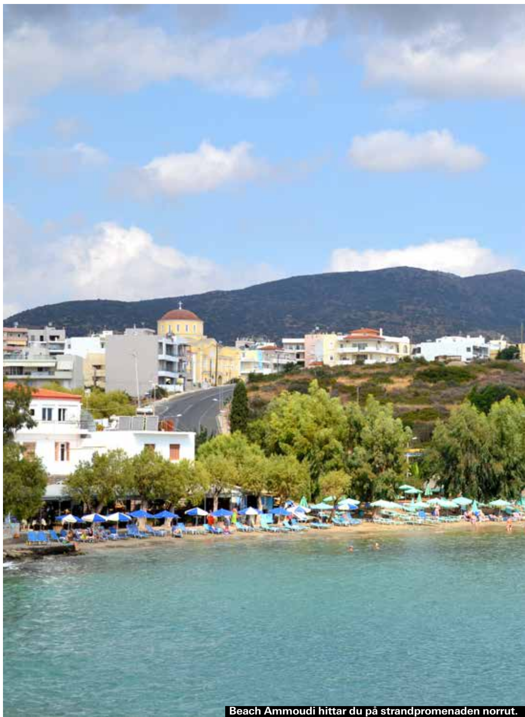
Beach Ammoudi hittar du på strandpromenaden norrut.