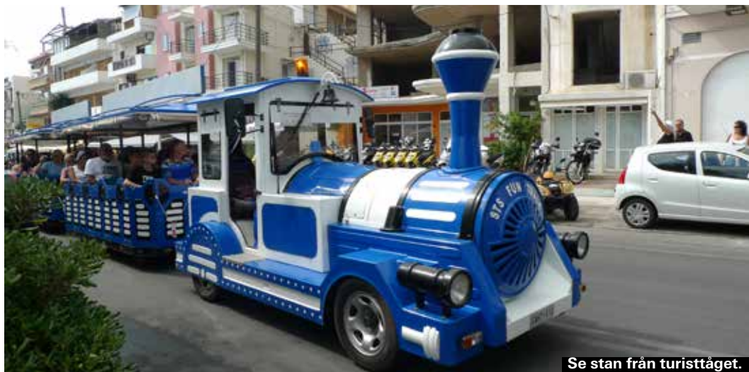
Se stan från turisttåget.