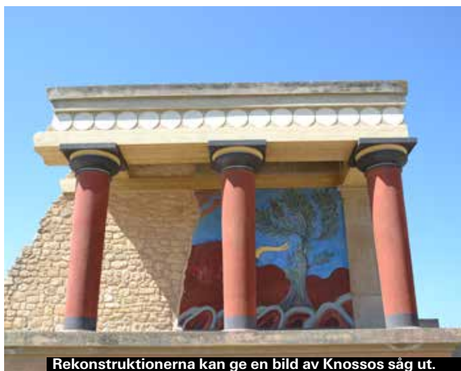
Rekonstruktionerna kan ge en bild av Knossos såg ut.