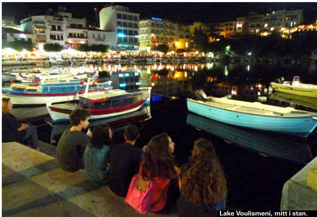
Lake Voulismeni, mitt i stan.