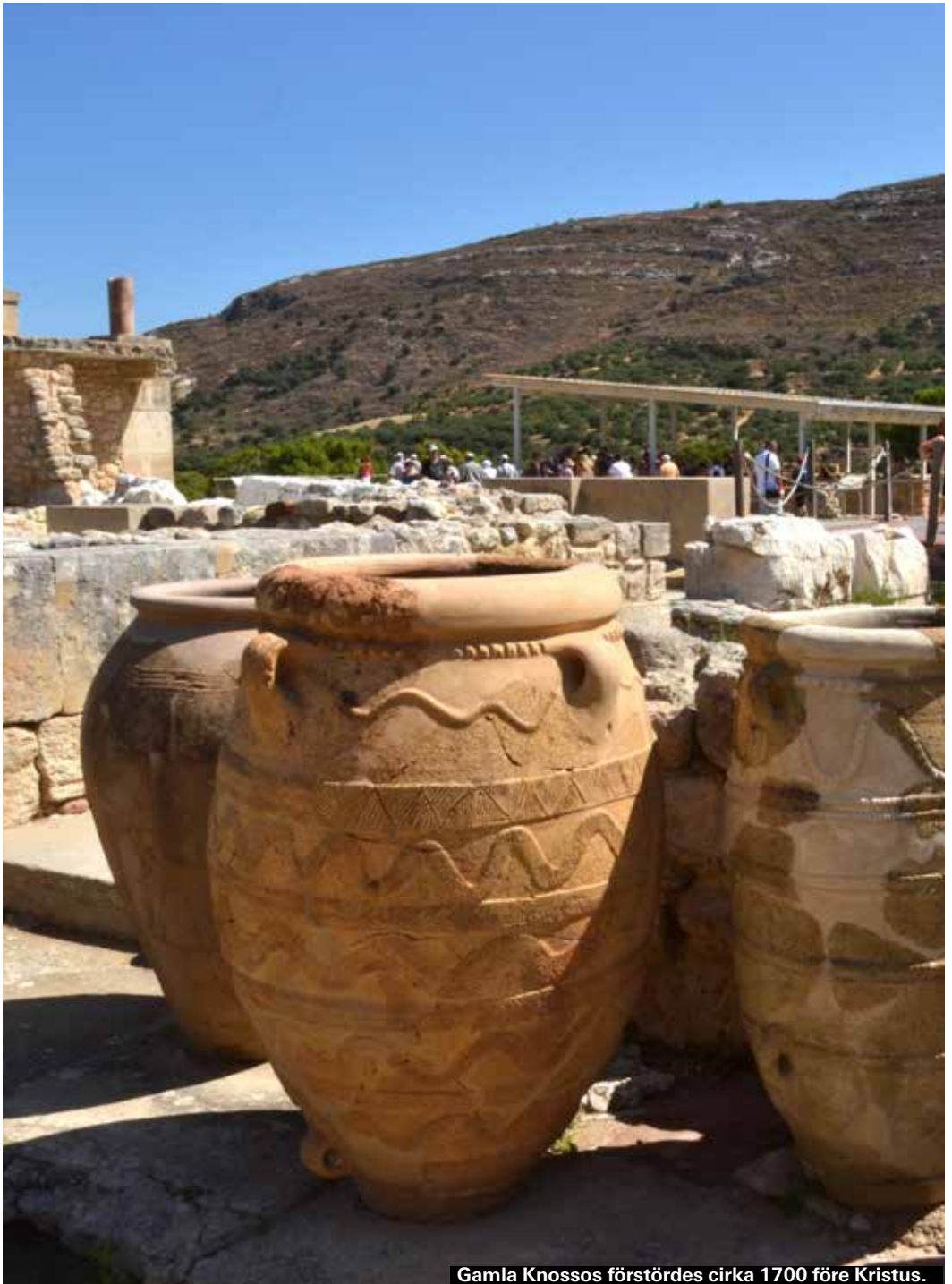
Gamla Knossos förstördes cirka 1700 före Kristus.