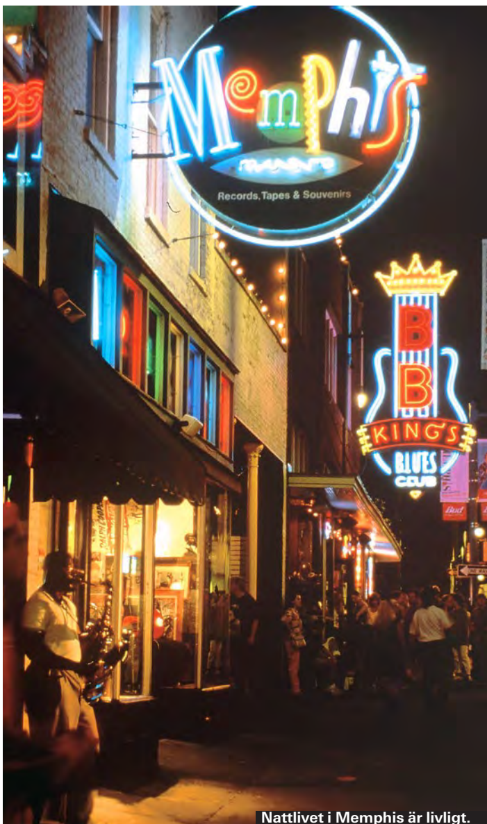
Nattlivet i Memphis är livligt.