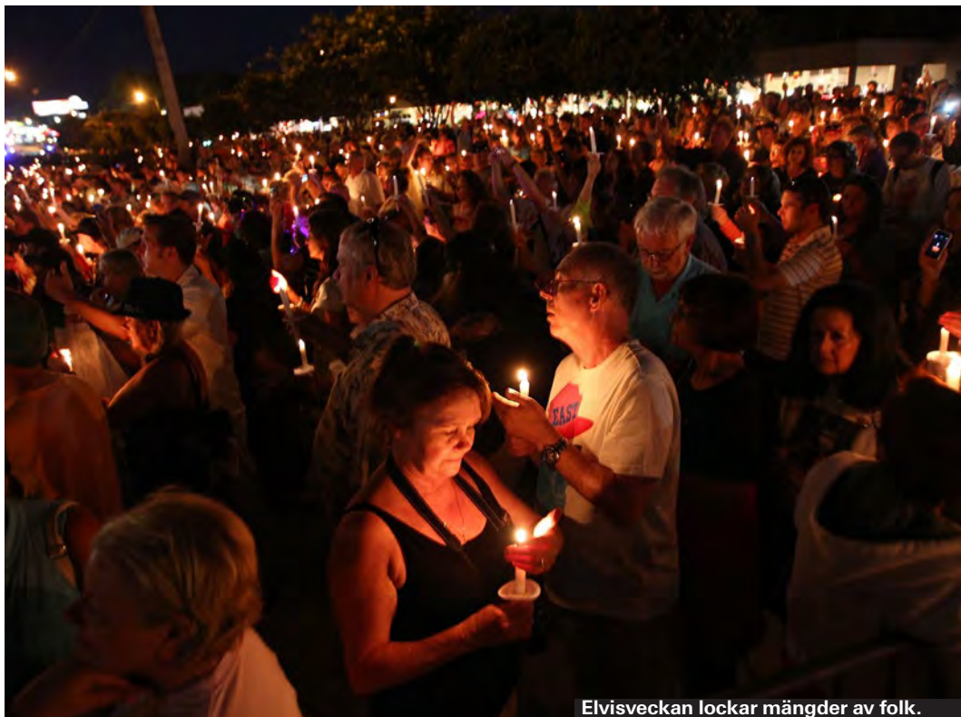
Elvisveckan lockar mängder av folk.