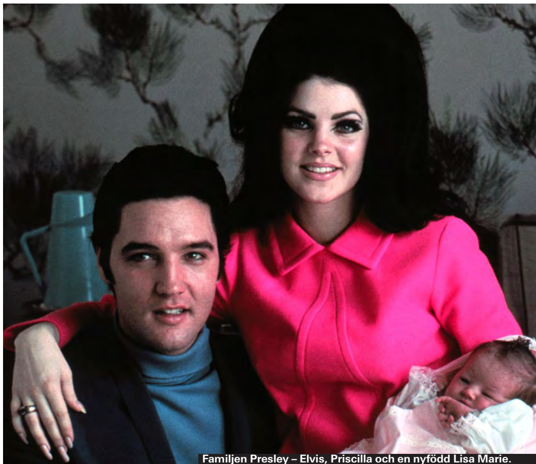
Familjen Presley – Elvis, Priscilla och en nyfödd Lisa Marie.

Mellan 1969 och 1976 jobbade Elvis i Las Vegas med två dagliga konserter, en på eftermiddagen och en vid midnatt. Vanligtvis var showerna efter jul och under sommaren men de två sista åren gjorde Elvis shower före jul.