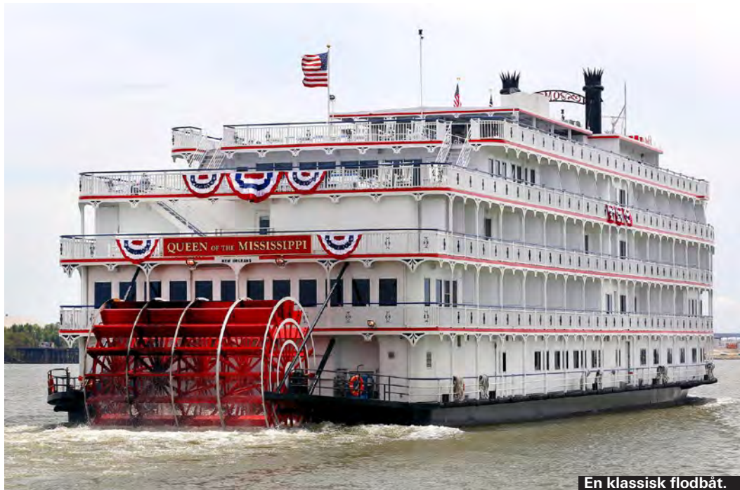
En klassisk flodbåt.