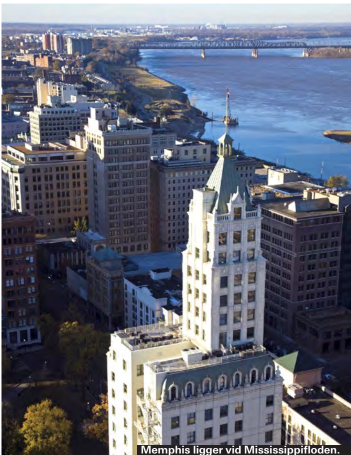
Memphis ligger vid Mississippifloden.

I USA kategoriseras befolkningen i ras. Så även i Memphis. Här är 60 procent svarta, 30 procent vita och fem procent är syd- och latinamerikaner. Resten kategoriseras som blandraser, hawaii-amerikaner och asiater.