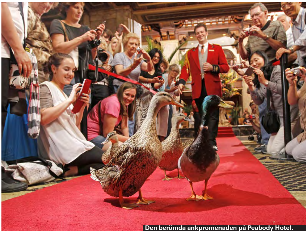
Den berömda ankpromenaden på Peabody Hotel.