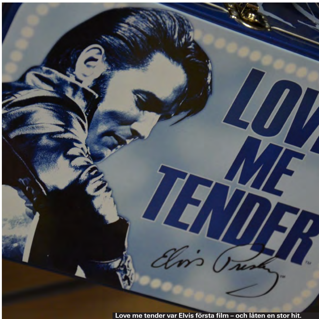
Love me tender var Elvis första film – och låten en stor hit.