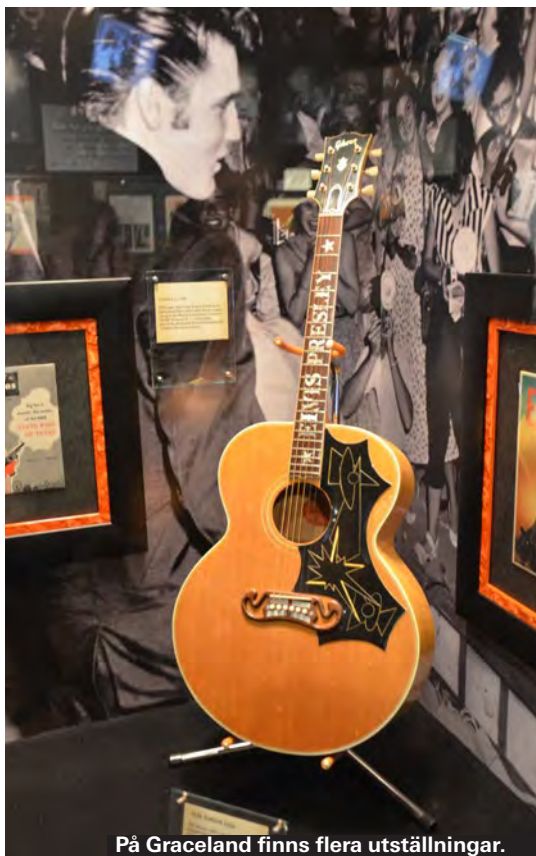
På Graceland finns flera utställningar.