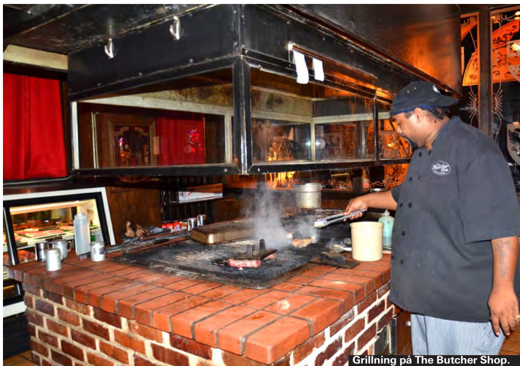
Grillning på The Butcher Shop.