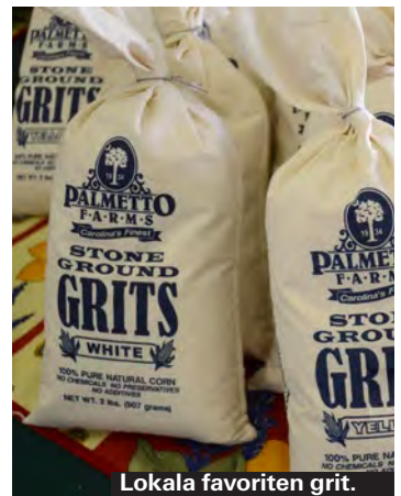
Lokala favoriten grit.