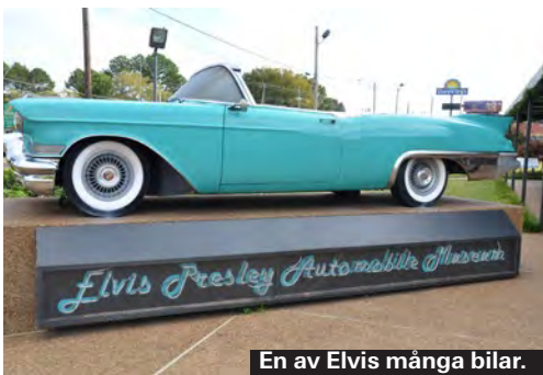
En av Elvis många bilar.