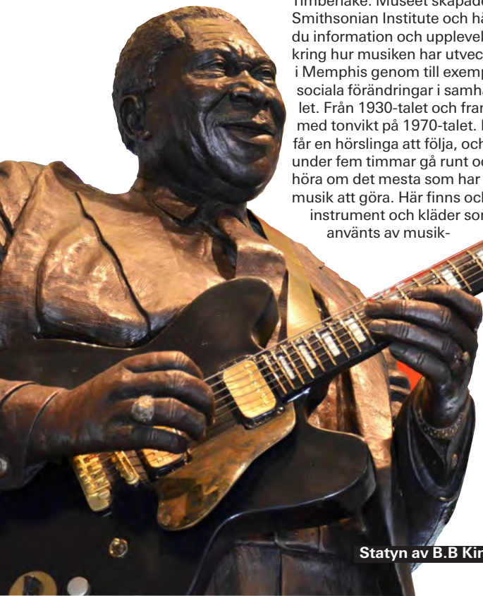
Statyn av B.B. King.

Det går inte att undvika och se den enorma neonskylten till B.B. King´s Blues Club. Förr om åren kom B.B. King hit två-tre gånger för att spela själv. Det sägs aldrig när och inga annonser berättar när han dyker upp. På klubben spelas blues med lokala band och emellanåt kända gästartister. Kuvertavgift runt sju dollar. Öppet varje kväll från 19.00, söndagar från 12.30. Missa inte att fota den stora statyn av B.B. King i Memphis Welcome Center som ligger på Riverside Drive. ▶ 139 Beale Street ▶ www.bbkingclubs.com