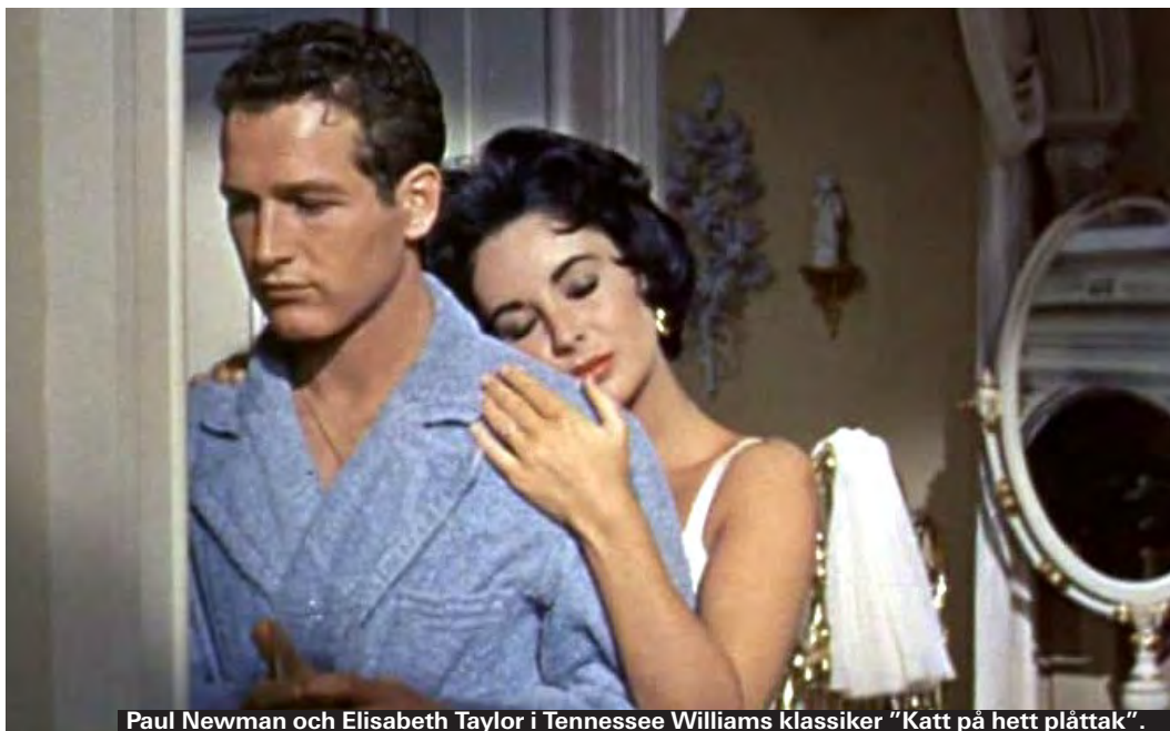
Paul Newman och Elisabeth Taylor i Tennessee Williams klassiker "Katt på hett plåttak".