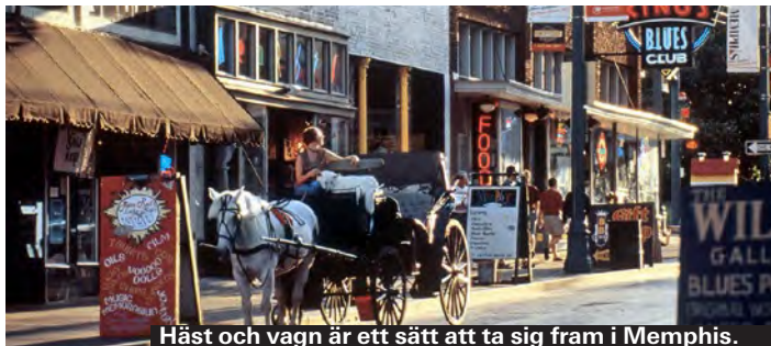
Häst och vagn är ett sätt att ta sig fram i Memphis.

Det finns gott om taxibilar men var noga med att taxametern