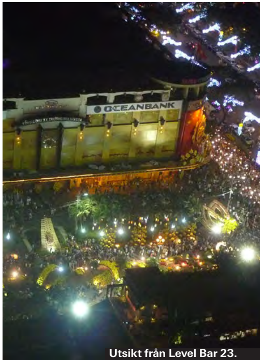
Utsikt från Level Bar 23.