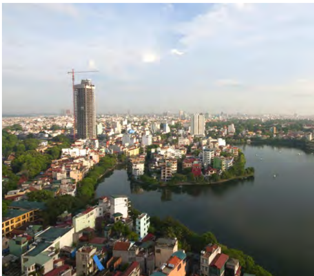
Över fyra miljoner bor i huvudstaden Hanoi i norra Vietnam.