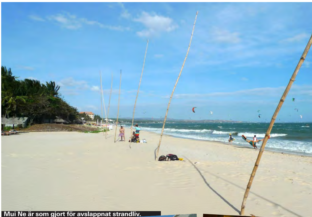
Mui Ne är som gjort för avslappnat strandliv.