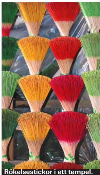
Rökelsesticker i ett tempel.

Wifi finns i princip överallt i Vietnam. På hotell, kaféer och restauranger. I de flesta fall är wifi helt gratis. Internetkaféer är van-