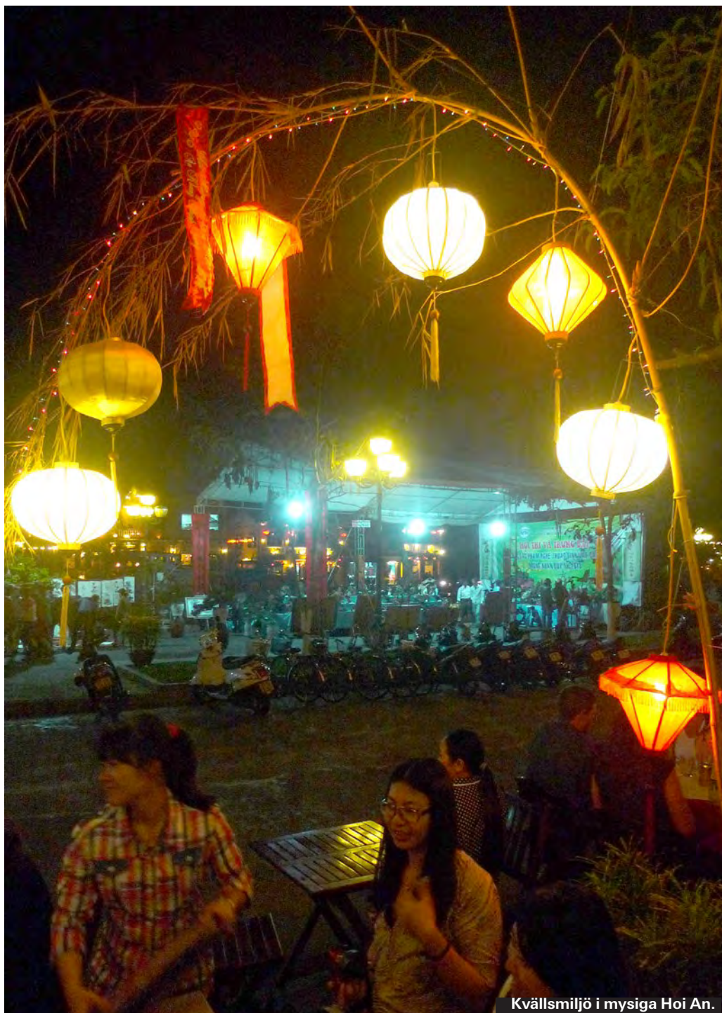
Kvällsmiljö i mysiga Hoi An.