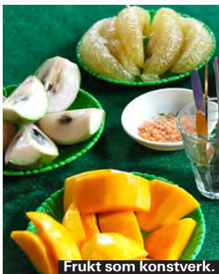
Frukt som konstverk.