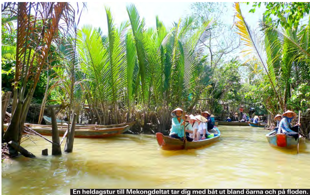
En heldagstur till Mekongdeltat tar dig med båt ut bland öarna och på floden.

Sa Pa är en liten stad i nordvästra Vietnam, 35 mil nordväst om Hanoi, och som ligger på en höjd. Här bor många etniska folkgrupper som Hmong, Dao och Tay. Fransmännen kom hit på slutet av 1880-talet och gjorde Sa Pa till en av sina bastioner. Här njuter du av berg och dalar, grönska och natur. På helgerna samlas såväl de olika etniska minoriteterna som vietnameser på marknaden, vilken är veckans största tilldragelse, även för turisterna.