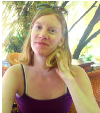
Text & foto: LISA OLSSON

Detta är en uppdaterad version av Vietnam-guiden publicerad i oktober 2011.