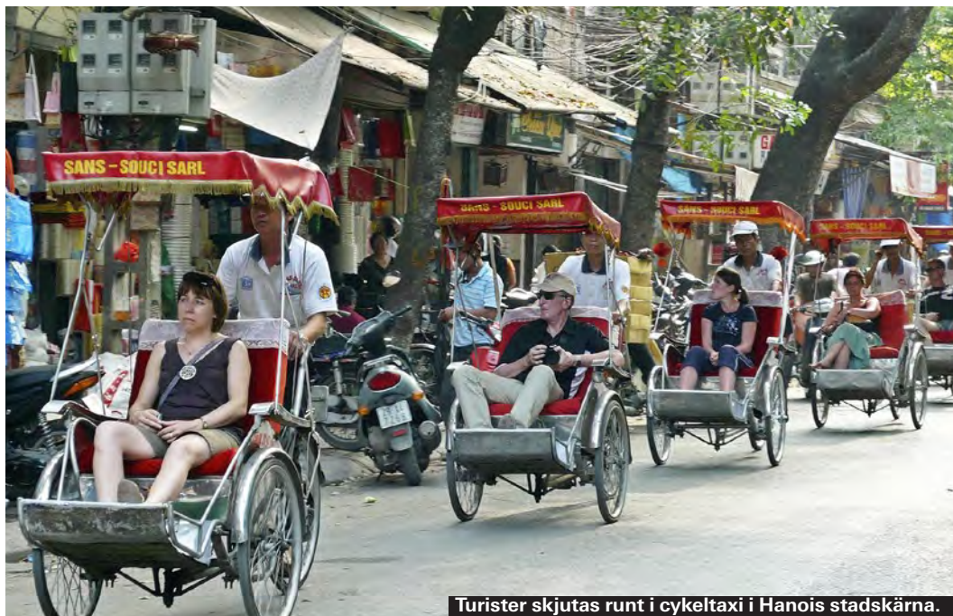
Turister skjutas runt i cykeltaxi i Hanois stadskärna.