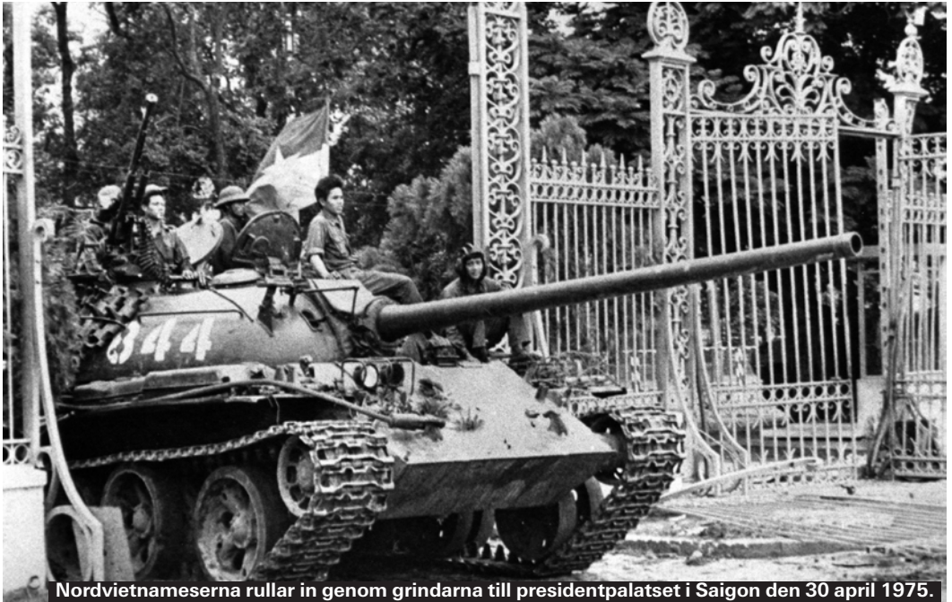
Nordvietnameserna rullar in genom grindarna till presidentpalatset i Saigon den 30 april 1975.