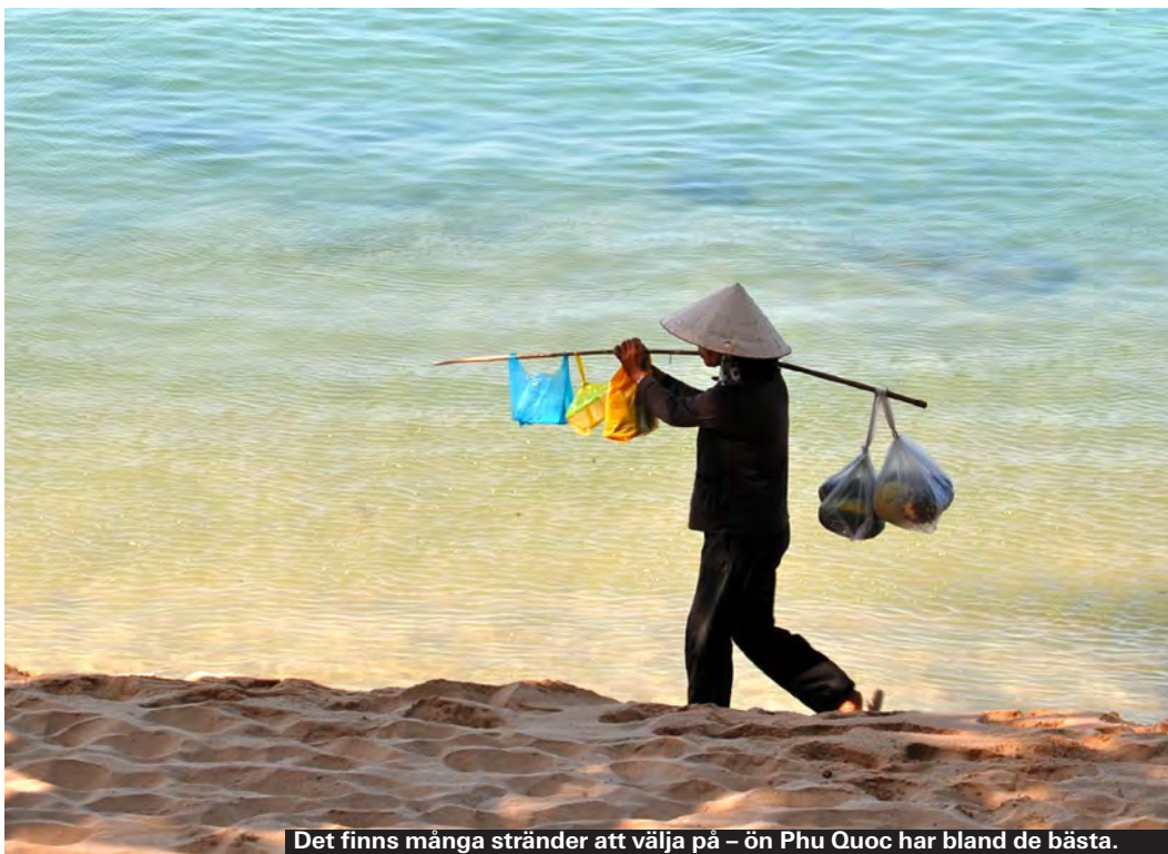
Det finns många stränder att välja på – ön Phu Quoc har bland de bästa.