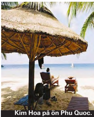
Kim Hoa på ön Phu Quoc.

Ligger i distrikt 1, det mest centrala området i HCMC. 5-10 minuters promenad till backpackerområdet i närheten där det är fullt med kaféer och restauranger. Även väldigt nära till den stora busshållplatsen. Rummen är relativt små men det är rent och prydligt, du får bra service och kan boka turisturer i receptionen. För budgetresenären är priset dock det bästa, från 280 kronor för ett dubbelrum. Hotellet har ingen pool, men varma dagar går det utmärkt att besöka