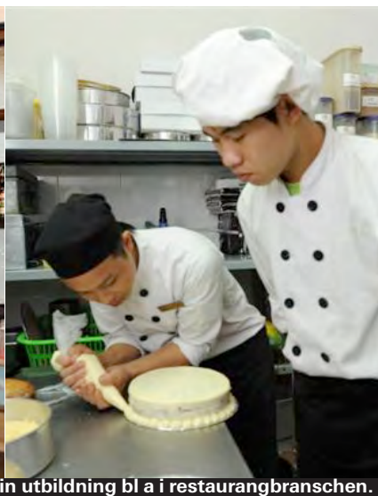
Varje år tar KOTO in nya gatubarn som får påbörja sin utbildning bl a i restaurangbranschen.