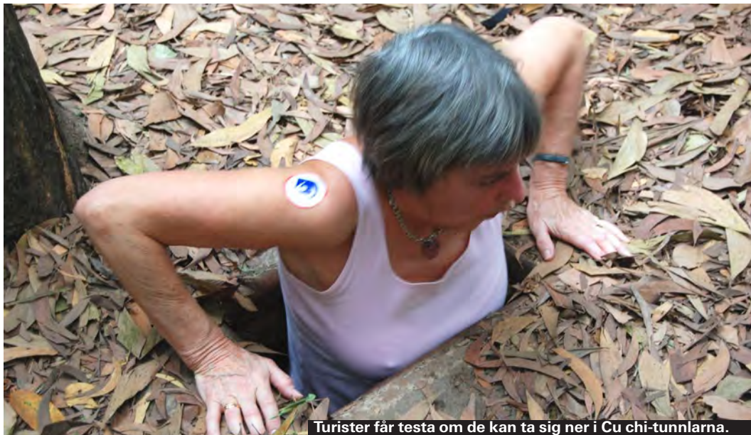
Turister får testa om de kan ta sig ner i Cu chi-tunnlarna.