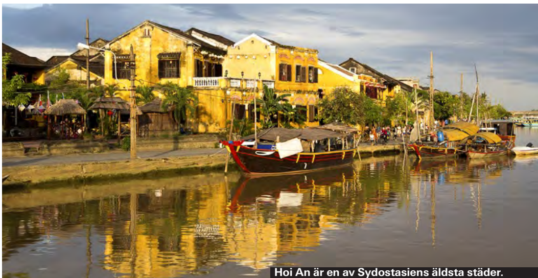
Hoi An är en av Sydostasiens äldsta städer.