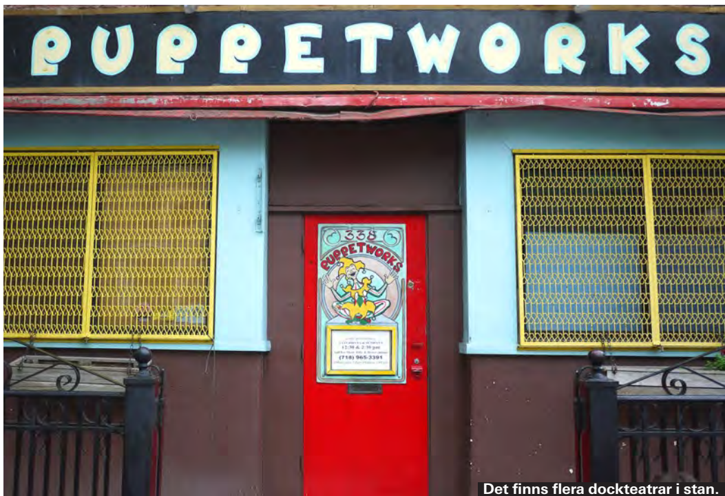
Det finns flera dockteatrar i stan.