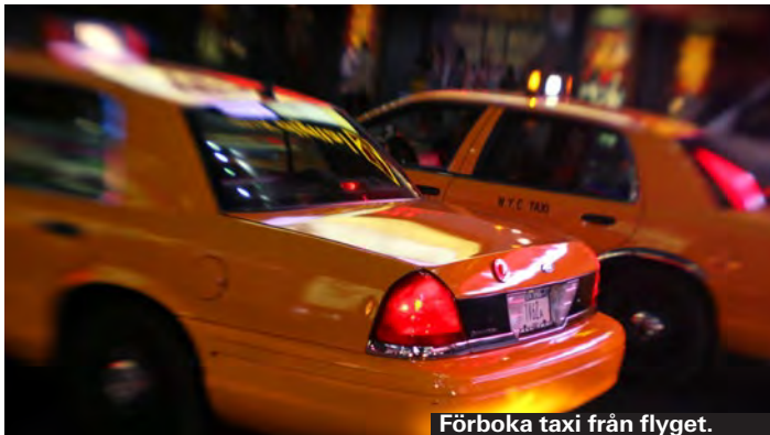
Förboka taxi från flyget.

Bagageregler för barn skiljer sig åt. Flyger du med SAS får din bebis checka in ett vanligt bagage på 23 kilo, på Norwegian gäller 5 kilo. Du får ofta inte ta med något handbagage till bebisens, förutom mat. I regel är det gratis att checka in en barnvagn och/eller bilstol.