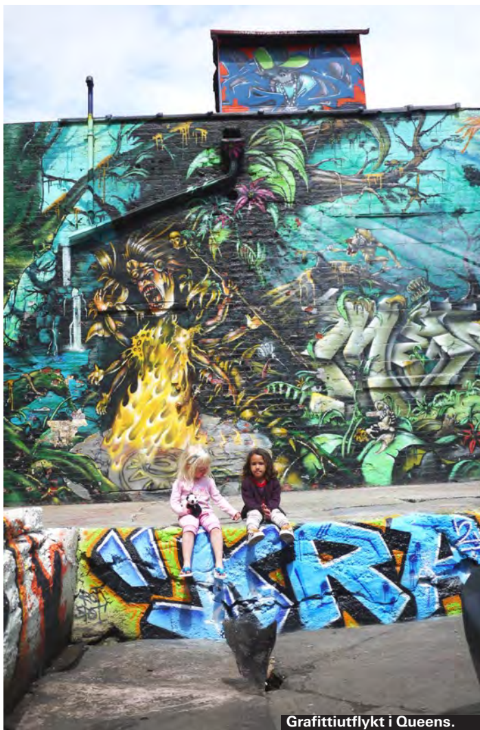
Graffitiutflykt i Queens.

Vill ni lämna stan och kolla in var New York-borna tar vägen på sommaren är det till The Hamptons och underbara The Mountauk ni ska åka. Hyr bil eller ta tåget hela vägen med The Long Island Railroad. Med expresståget tar det två timmar