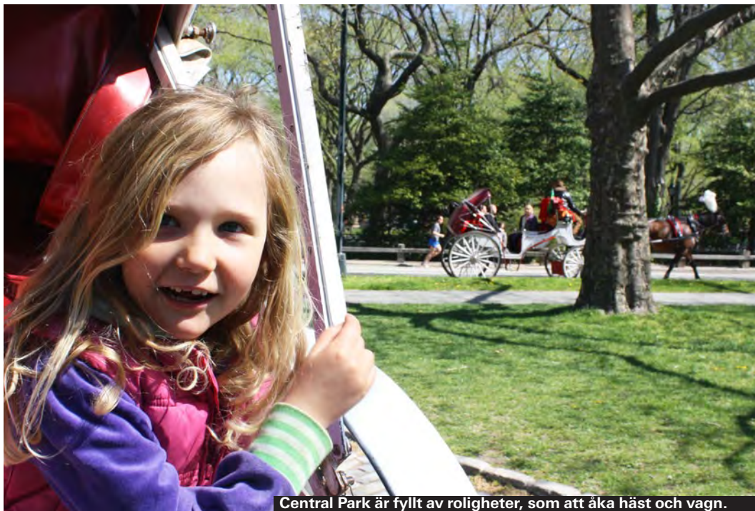
Central Park är fyllt av roligheter, som att åka häst och vagn.