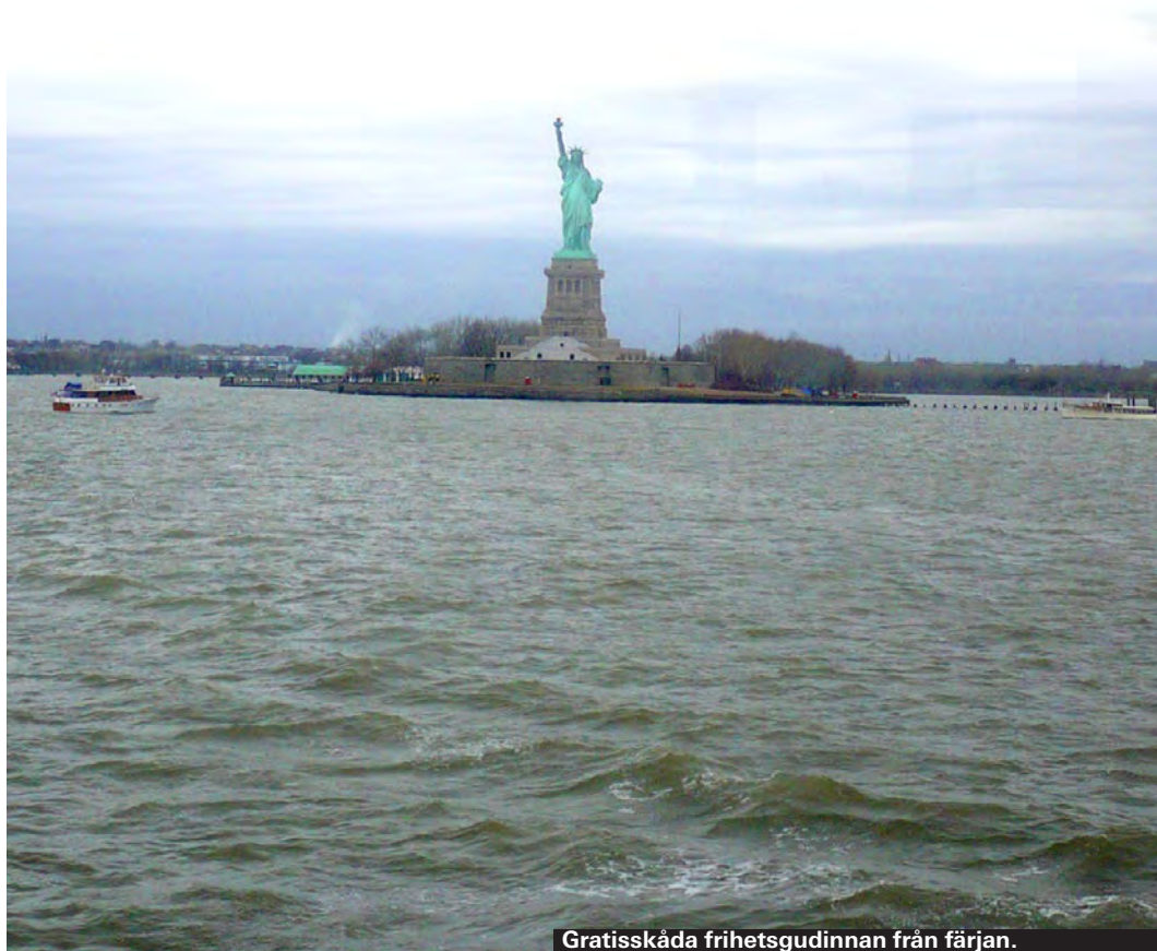
Gratis skåda frihetsgudinnan från färjan.