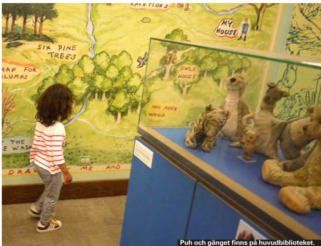
Puh och gänget finns på huvudbiblioteket.