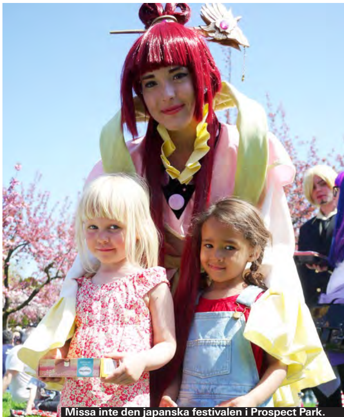
Missa inte den japanska festivalen i Prospect Park.

Den gamla järnvägsrälsen ovanför Manhattans gator har gjorts om till en vindlande park rakt genom stan, perfekt för barnen att springa i utan risk för att bli påkörda av bilar. Gå hela 2,5 km eller hoppa på när det passar. Häng i sköna solstolar, låt barnen klättra på stenbänkarna och titta på blommorna eller den fina utsikten över Manhattans västra sida. Hiss finns, och gångvägen är barnvagnsvänlig.