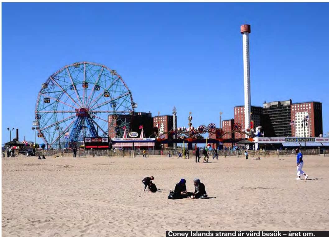
Coney Islands strand är värd besök – året om.