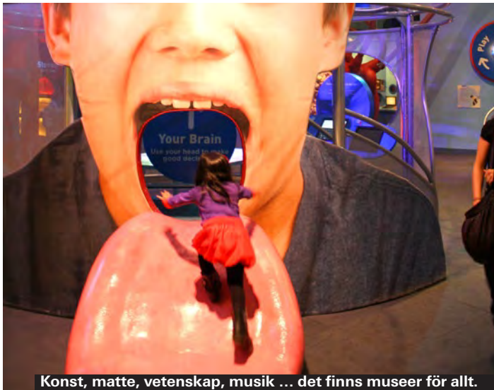
Konst, matte, vetenskap, musik ... det finns museer för allt.

Museum för nyfikna barn som gillar att experimentera. New York Hall of Science ligger i en av byggnaderna från 1964 års världsutställning i New York, i det stora naturområdet Flushing Meadows Corona Park i Queens. Stängt måndagar. Öppet ti-fre 9.30-17. Helger 10-18. Intråde: