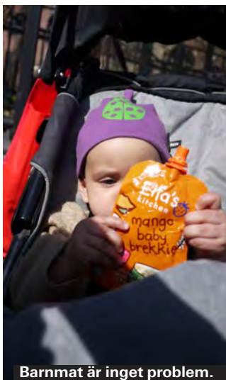
Barnmat är inget problem.