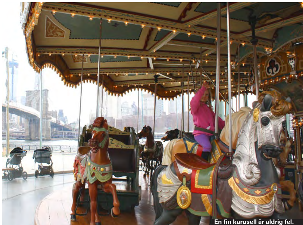
En fin karusell är aldrig fel.