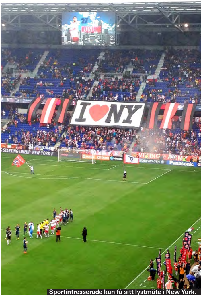
Sportintresserade kan få sitt lystmäte i New York.