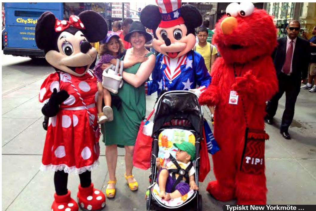
Typiskt New Yorkmöte ...