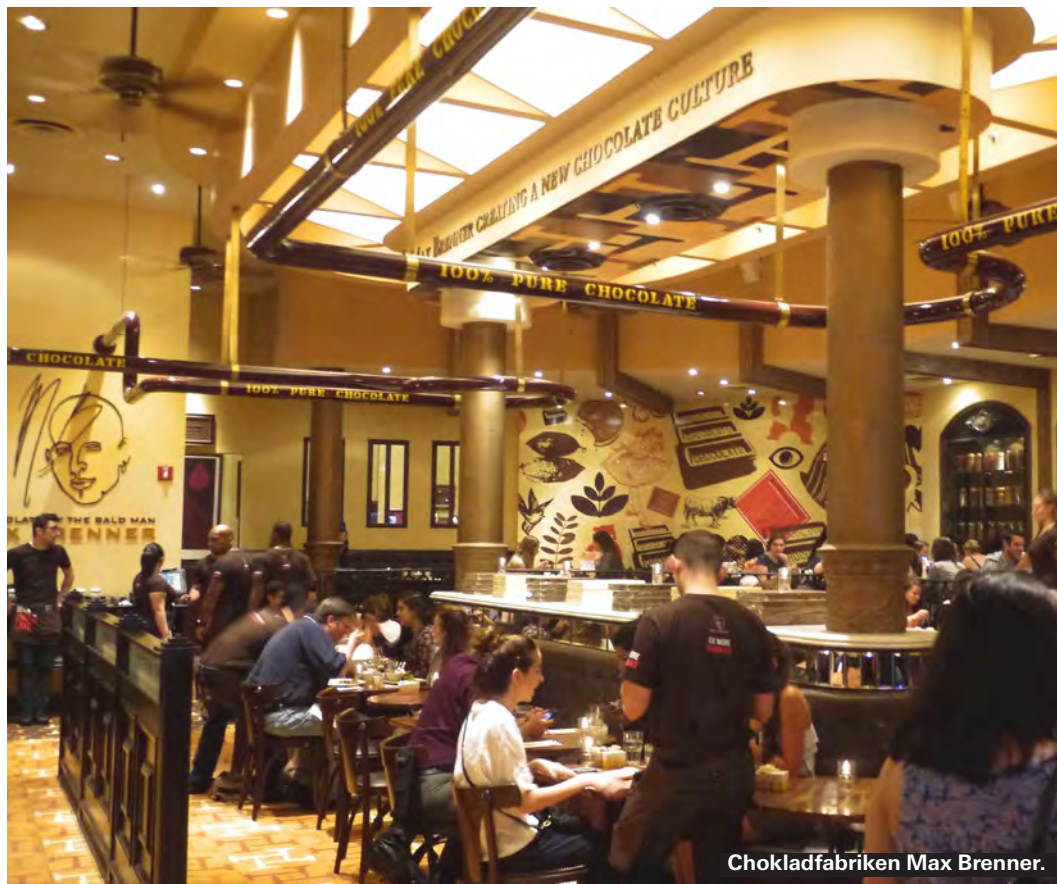
Chokladfabriken Max Brenner.