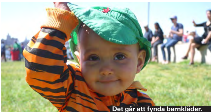
Det går att fynda barnkläder.

Area har ett tiotal butiker i New York, de flesta har både leksaker och kläder. Min favorit är Kicks & Cuts, där du på både kan shoppa skor, (amerikanska märken som Converse, Adidas och Toms är riktigt prisvärt i USA) och få din