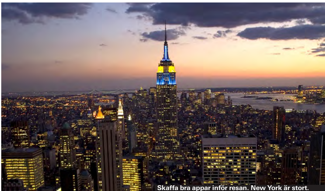
Skaffa bra appar inför resan. New York är stort.

Hyr du cykel är det lag på hjälm upp till 14 års ålder. Barn under ett år får inte framföras på cykel.