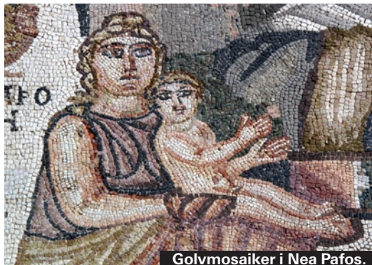
Golvmosaiker i Nea Pafos.

”Den svenska fredsbevarande insatsen 1964-1993”, är den långa titeln på en bok från 1999 skriven av två män med stor kunskap om insatsen. Kostar cirka 210 kronor på nätet.