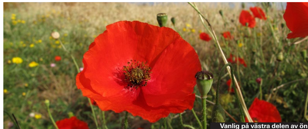
Vanlig på västra delen av ön.