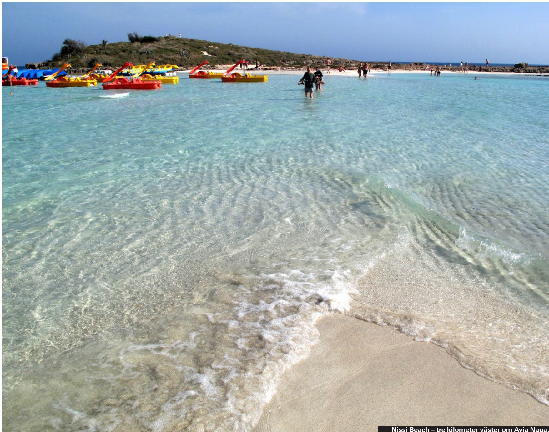
Nissi Beach – tre kilometer väster om Ayia Napa.

Det finns fortfarande några fina stränder i trakten som inte kantas av hotell och diskodunkande barer. Den är stranden har fått sitt namn efter det lilla kapellet intill och den antika gravkammare som senare också blivit grekiskortodoxt kapell. Den enda service som finns är en litens snacksrestaurang, som så klart också har solstolar till uthyrning. Ayia Thekla ligger cirka 7 kilometer väster om Ayia Napa centrum.