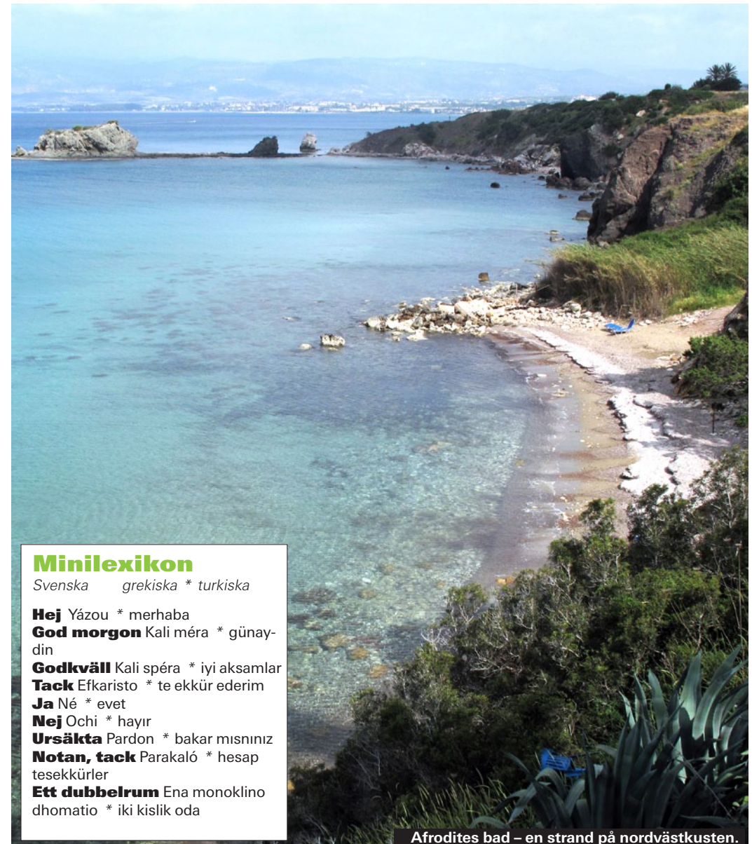
Afrodites bad – en strand på nordvästkusten.

Minilexikon Svenska grekiska * turkiska Hej Yázou * merhaba God morgon Kali méra * günay-din Godkväll Kali spéra * iyi aksamlar Tack Efkaristo * te ekkür ederim Ja Né * evet Nej Ochi * hayır Ursäkta Pardon * bakar mışnınız Notan, tack Parakaló * hesap tessekkürler Ett dubbelrum Ena monoklino dhomatío * iki kislik oda