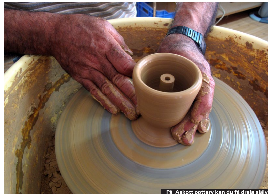
På Askott pottery kan du få dreja själv.

Varken fabrik eller speciellt mycket läder, men en bra sortering handväskor och dessutom väldigt billiga kabinväskor, 8–25 euro beroende på storlek och kvalitet. Två affärer i Ayia Napa. ▶ Nissi Road och Plateia Seferi