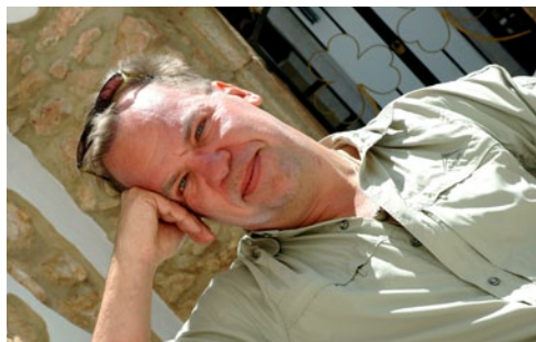
Text & foto: JOHAN ÖBERG

Den som inte vill sitta still har allt fler bra golfbanor att välja på, man kan vandra, dyka, besöka rader av vattenland och kolla utsökta antika lämningar. Med lite planering är chansen god att alla i familjen kommer hem ytterst nöjda.