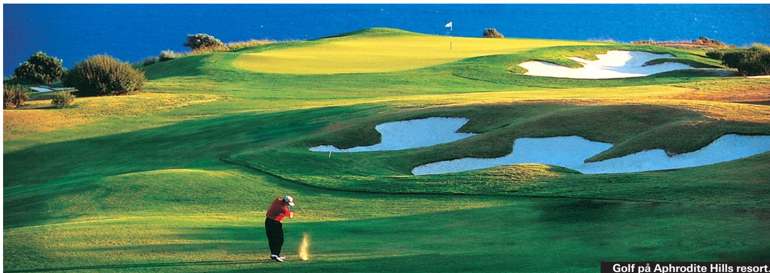
Golf på Aphrodite Hills resort.

Det går att hyra segelbåt både för att segla själv och med besättning. En 40-fotare med kapten kostar runt 8000 kronor för en dag. ► www.windowoncyprus.com/sailing and boats in cyprus.htm