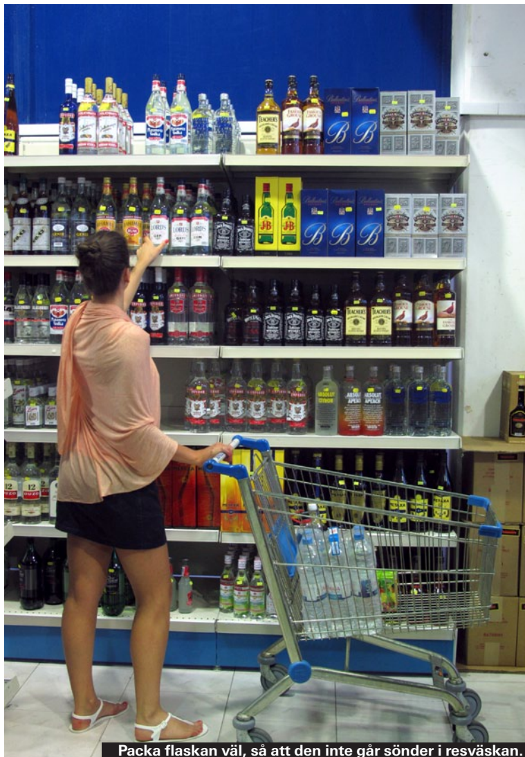
Packa flaskan väl, så att den inte går sönder i resväskan.

Kända spritmärken är ofta billigare på Cypern än på charterflyget. En liter Absolut kostar cirka en hundralapp och en liter Famous Grouse whisky går på 125 kronor.