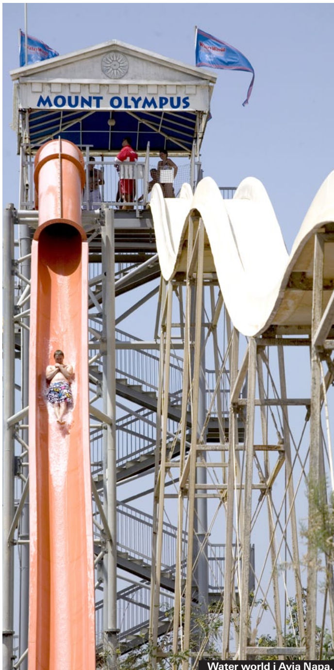
Water world i Ayia Napa.

De billigaste går till Fig Tree Bay. De turerna kostar bara 5 euro (halvdag). Katamaranturer hör till de dyraste, 45 euro. Sen finns det glasbottenbåtar, halvubåtar, piratskepp m m. I vissa turer ingår mat och dryck.