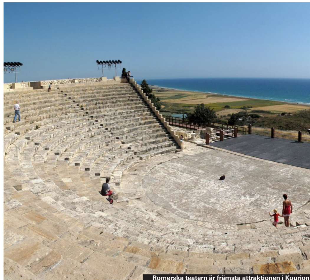
Romerska teatern är främsta attraktionen i Kourion.