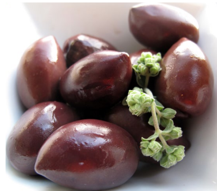
Oliver odlas på ön.

Yogurtdryck som säljs från vagnar på gatan.