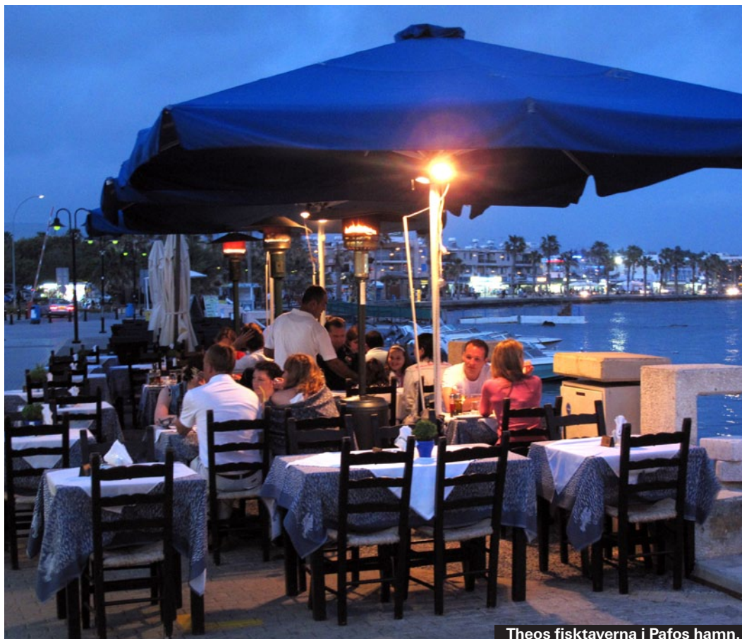
Theos fisktaverna i Pafos hamn.

Pafos stränder är små och omärkta. En knapp mil norr om stan ligger den mycket finare sandstranden i Coral Bay och på nordvästkusten finns flera riktigt fina sandstränder där det sällan blir någon trängsel då de ligger en bit bortom allfarvägarna.