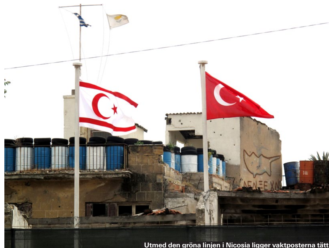
Utmed den gröna linjen i Nicosia ligger vaktposterna tätt.