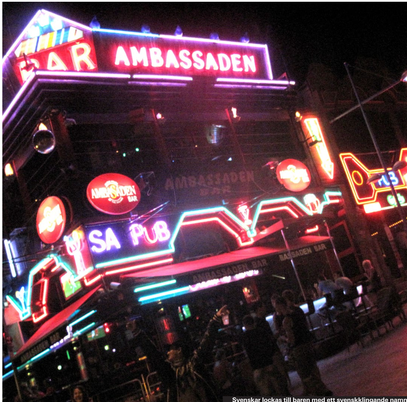
Svenskar lockas till baren med ett svenskkljande namn.

Det disko som överlevt längst i Ayia Napa. Kanske för att man genom åren haft de bästa dj:erna, det tycker i varje fall många hardcore-klubbare. Mycket soul och r'n'b. Passar det inte här finns det varje sommar minst 20 klubbar i stan – välj och vraka! ▶ Louka Louka 6 ▶ www.blackandwhiteclub.com