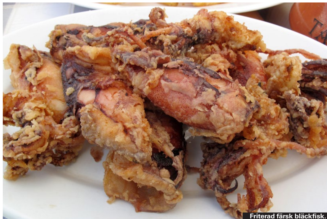
Friterad färsk bläckfisk.

Vinbladdolmar, fyllda med en röra på ris, lök och köttfärs. Finns också vegetariska.