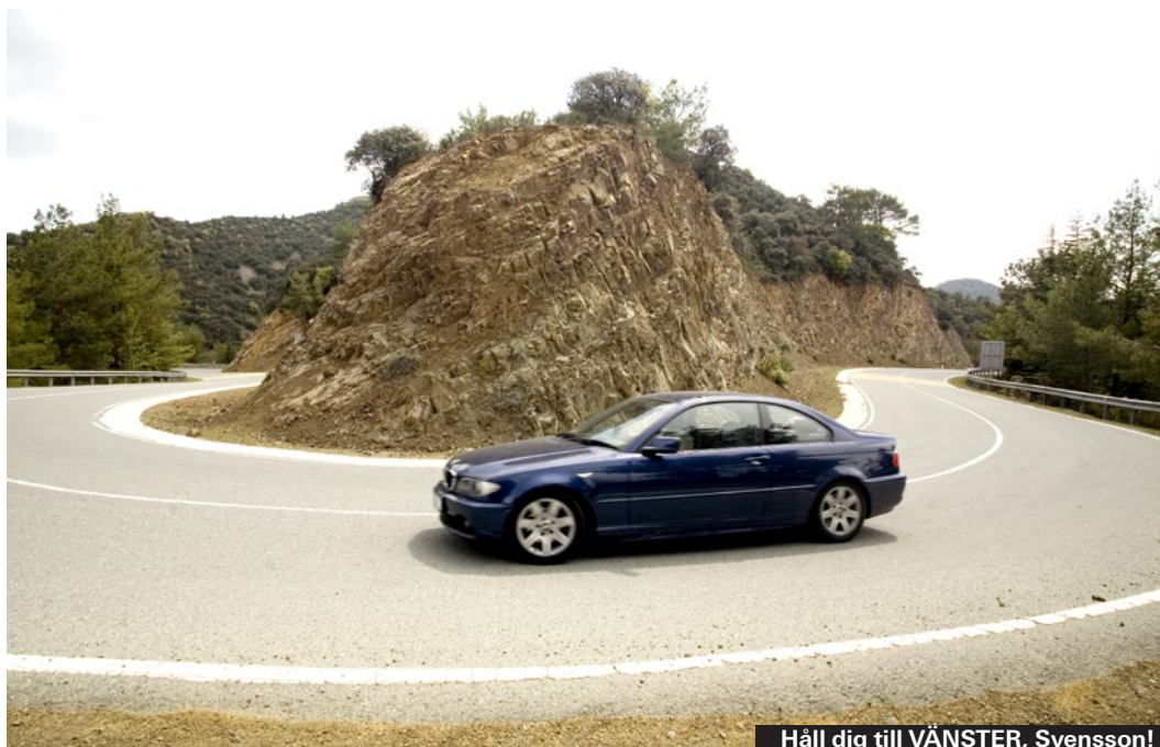
Håll dig till VÄNSTER, Svensson!