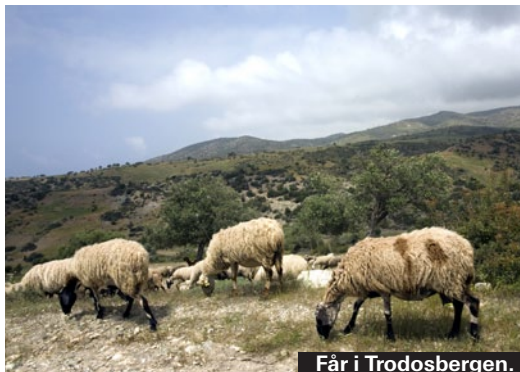
Får i Trodosbergen.