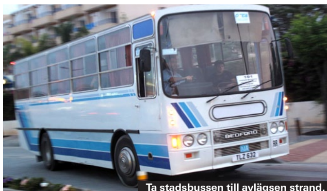
Ta stadsbussen till avlägsen strand.

Taxi kostar 3,72 euro i startavgift och 0,73 euro per kilometer. Inom Ayia Napa går extremt få taxiresor på mer än 7 - 8 euro. Det finns dessutom långfärdstaxi, där man delar utrymme med folk man inte känner. Ayia Napa till Larnaka kostar 8,20 - 10 euro, vardag det högre priset på söndagar.